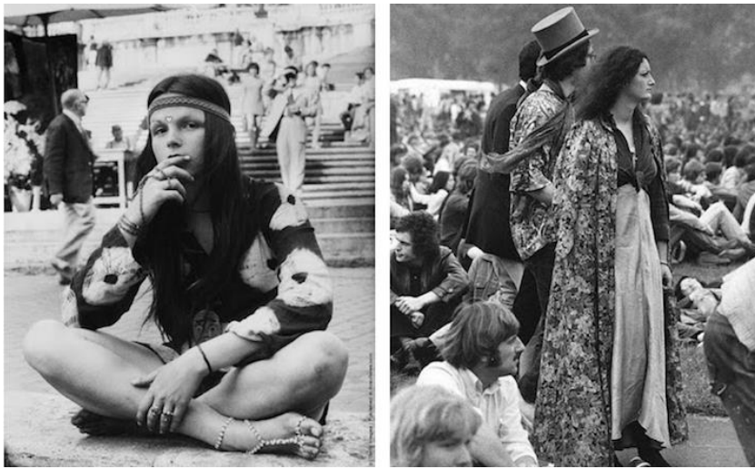
Slika 6. Moda hipija

Članovi hipi pokreta razvili su jedinstveni način oblačenja kojim su pokazivali svoje neslaganje s tadašnjom normom. Članovi hipi pokreta nosili su duge lepršave haljine i suknje, nosili su traperice i „tie-dye“ majice.