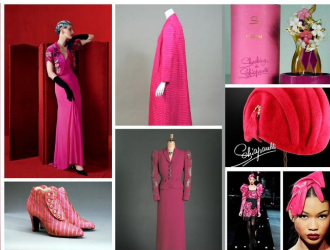
Slika 8. Shocking pink