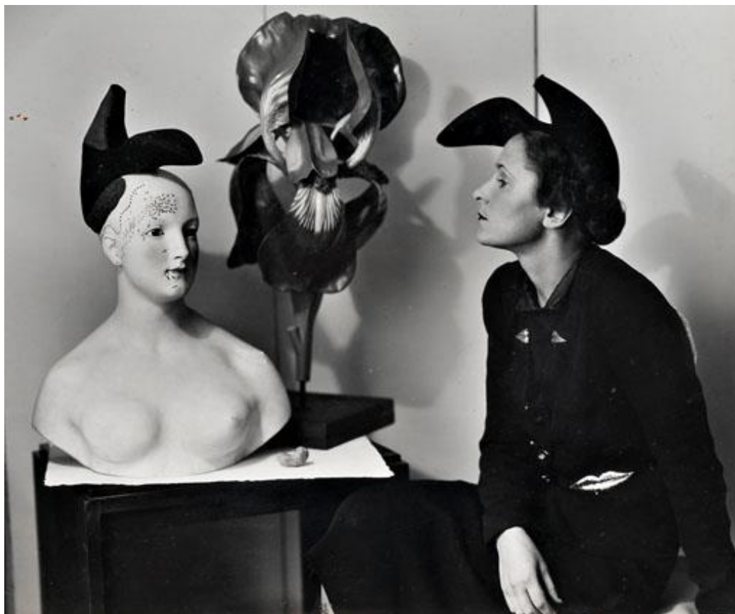
Slika 9. Elsa Schiaparelli i njen Shoe Hat

Nadrealistički utjecaj očitava se na još mnogo 'šokantnih' predmeta poput Shoe Hat-a ( Šešira cipele ) koji je proizašao iz suradnje s Dalijem. Postoje dvije verzije tog šešira: crni s crnom potpeticom i crni sa 'šokantno' ružičastom potpeticom – njenom bojom, koja postaje zaštitni simbol modne kuće Schiaparelli. (Slika 9) Ostali predmeti koji njen rad vežu s nadrealističkim utjecajem su: crne antilop rukavice s apliciranim crvenim zmijskim noktima (inspirirana Man Rayjom), torba u obliku telefona (inspirirana Dalijem), kapa u obliku mozga izrađena od valovitog ružičastog baršuna, gumbi u obliku kikirikija, lokota i papirnatih isječaka, raznobojne perike koordinirane s haljinama te tkanina dizajnirana tako da oponaša novinski print koji ispisuje Schiaparellinu vlastitu recenziju na nekoliko jezika. 77 Man Ray je u to vrijeme fotografirao za časopise Vogue i Harper's Bazaar pa su se tamo mogle pronaći i fotografije Schiaparellinih 'neobičnih' šešira. 78