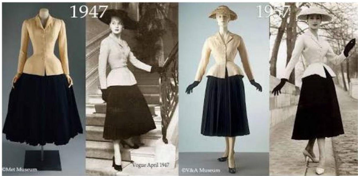
Christian Dior - The Original "Bar Suit" (left) and the 1957 version (right)