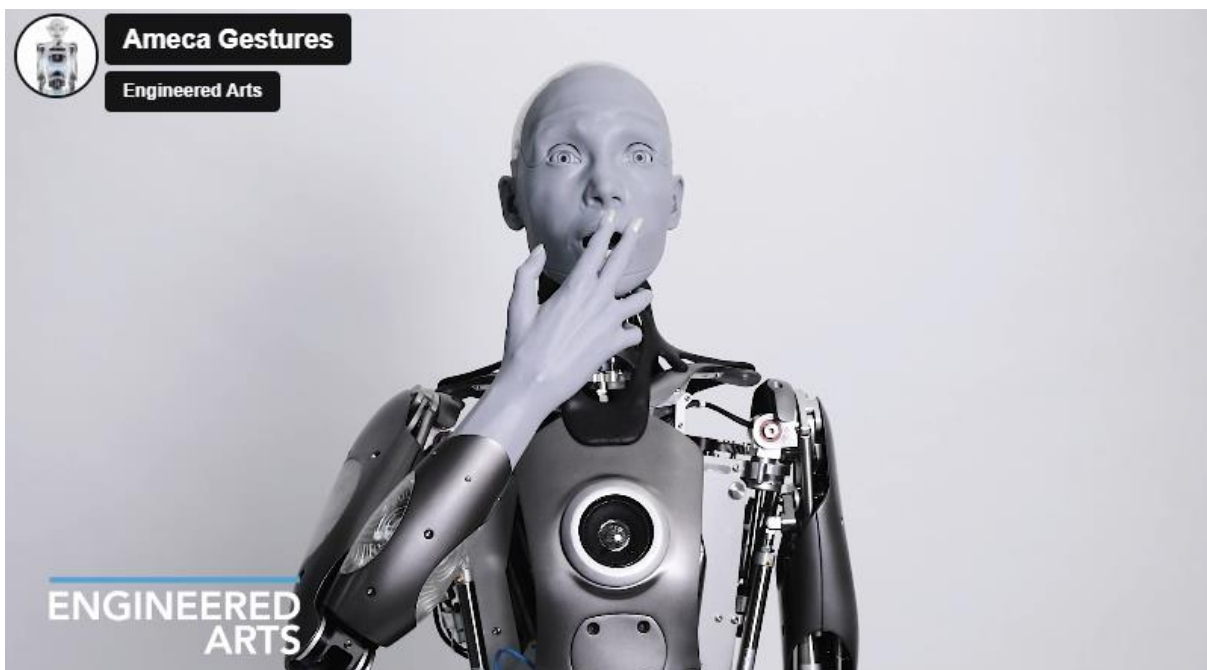
Slika 2. Ameca, Engineered Arts 2021.

Sustav sastavljen od povratnih informacija pomaže OpenAI-u unaprjeđivanje vlastitog modela prikupljanjem informacija od korisnika i pretraživanjem cjelokupnog World Wide Weba-a. No, ono zaista čudovišno ne pojavljuje se u računalno-konverzacijskom obliku, već u obliku humanoida koji imaju mogućnost promišljanja kao otvoreni sustavi, u jednom novom, sintetičkom tijelu.