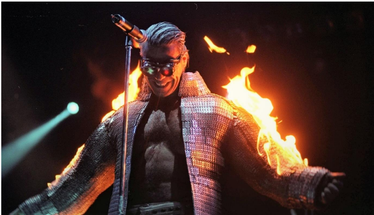
Slika 7. Rammstein, Sydney 2001.

Film istražuje egzistencijalne teme svrhe, autentičnosti, osobnog identiteta te sukoba između slobodne volje i determinizma. On zadire u transformativno putovanje protagonista koji se naziva Neo, a on ima za cilj spasiti ljudsku rasu od ropstva strojevima i umjetnoj inteligenciji (A.I.). Poruka „Probudi se Neo.“ koja se pojavljuje na sučelju njegova osobnog računala je implikacija da sami ispitamo vlastitu stvarnost posebice u doba tehnosfere. Ono što Matrix čini izuzetnim za cyberpunk žanr je slojevita međupovezivost cyberpunk karakteristika. U nekoliko scena, na samom početku filma, pojavljuje se računalna tehnologija, knjiga Jeana Baudrillarda „Simulakrumi i Simulacija“ (1983.), preciznije poglavlje „O Nihilizmu“, neo-gotički klub u kojemu u pozadini s tehno-elektronskim prizvukom svira pjesma „Dragula“ metal benda Rob Zombie, dok su likovi odjeveni u futurističke crne kombinacije koje su izražene posebnim sintetskim materijalima poput vinyla i PVC-a.