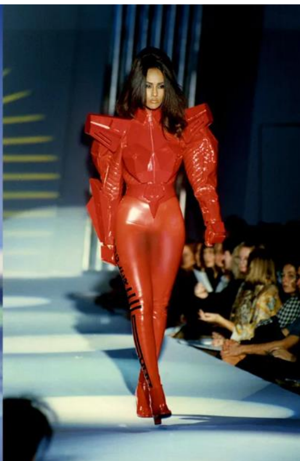
Slika 13. „Beyond the Stars“ 1991.

Iako su Muglerove kolekcije s početka 1990-ih ostavile velik trag na cyberpunk modu i estetiku, nijedna se ne može porediti sa spektakularnom haute couture ekstravagancijom koju je 1995. godine prikazao u dvorani Cirque d'Hiver u Parizu. On je za nju kreirao monolitni bijeli set koji se sastojao od dvije modne piste koje su bile povezane spiralnim stepenicama uz koje su se nalazili stupovi na kojima su bili plesači.