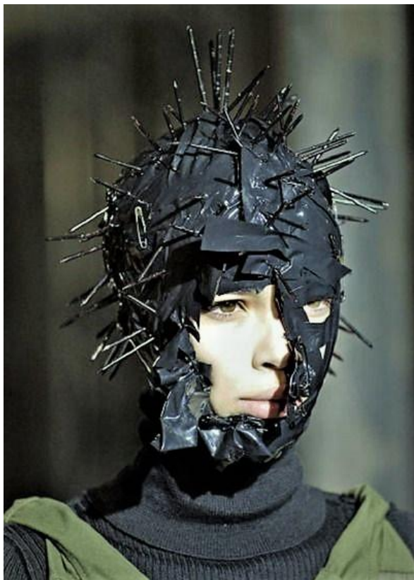
Slika 9. Junya Watanabe F/W 06

Kako navodi teoretičarka mode Yuniya Kawamura on predstavlja svoju prvu kolekciju u jesen 1992. godine u Parizu, no ona se odmah razlikovala od klasičnog neo-avangardnog izgleda modne kuće Comme des Garçons. Činilo se kako će u svojim radovima Watanabe otići korak dalje u dekonstruktivnom dizajnu uključujući nove tehnologije, gotičku punk-rock estetiku kakvu smo uvidjeli u japanskim cyberpunk filmovima poput „Crazy Thunder Road“ (1980.), sintetske i industrijske materijale poput PVCa i metala, kako bi kreirao jedno novo tijelo. 57