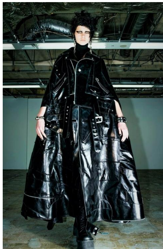
Slika 10. Junya Watanabe F/W 22