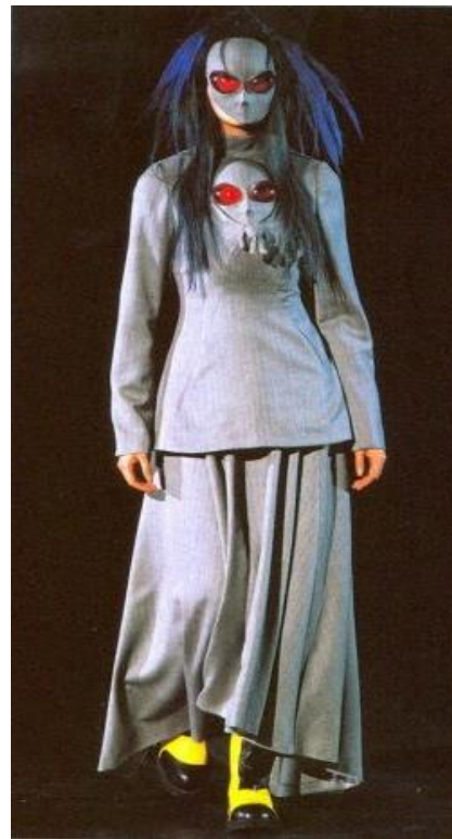
Slika 9. „20471120“ Autumn/Winter 1998.