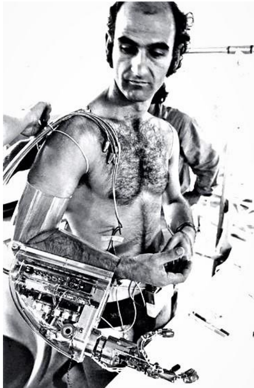
Slika 3. Stelarc 1980. Yokohama, Japan

Jedan od njegovih najznačajnijih radova, onaj iz 1980. kojega je izveo u Yokohami u Japanu pod nazivom „Third Hand“ ili „Treća ruka“, uključuje dodatnu robotsku ruku na njegovom tijelu kojom upravlja putem elektromiografskih signala koji prenose njegove vlastite moždane impulse. Robotska ruka dizajnirana je da oponaša pokrete ljudske ruke i omogućuje interakciju s objektima na isti način kao ona biološka. Takav performans propituje odnos između tijela i tehnologije brišući granice između čovjeka i stroja. Stelarc dovodi u pitanje ontološko poimanje tijela uvodeći treću ruku koja mijenja tradicionalno shvaćanje ljudskog oblika.