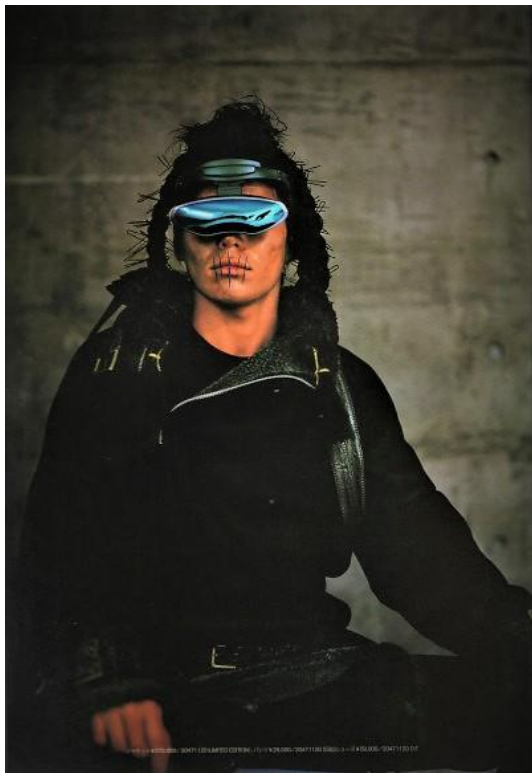
Slika 8. „20471120“ Autumn/Winter 1998.

Nakagawa ističe kako je zamišljao 2047. godinu kao godinu u kojoj će svijet prevladati različitosti te u kojoj će ekstravagantni individualizam i osobni identitet napredovati usporedno s računalnom tehnologijom. On koristi brojke za naziv brenda kako bi izrazio promjenu, različitost, budućnost i kreativnost. Nakon što su otvorili svoje poslovnice u Tokiju i prvi put prezentirali svoju kolekciju u sezoni proljeće/ljeto 1995. godine, njihova moda postala je popularna među mladima koje je zaintrigirao futuristički i distopijski karakter njihove odjeće. 55