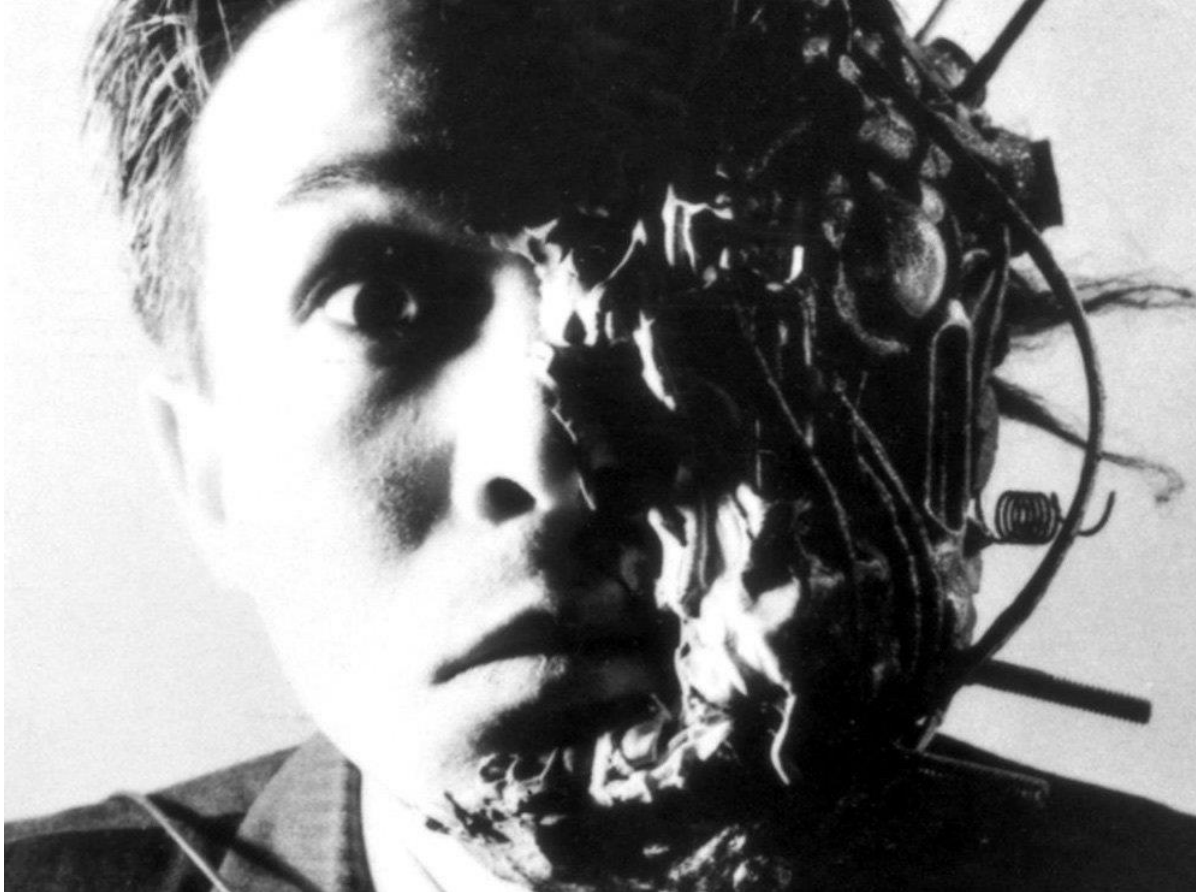
Slika 4. „Tetsuo: The Iron Man“ 1989.

Tetsuo je prožet provokativnom i eksplicitnom erotikom koja dodatno briše granice između „užitka“ i „boli“, „ljepote“ i „gađenja“. On istražuje teme fetišizma, sado-mazohizma i seksualne represije, zadirući u mračne zakutke ljudske psihe. Svi ovi elementi pojačani su tehnologijom koja se ogleda u metalu i stvaraju uznemirujuće i intenzivno iskustvo gledanja, te izazivaju konvencionalne predodžbe ljepote i senzualnosti u kinematografiji.