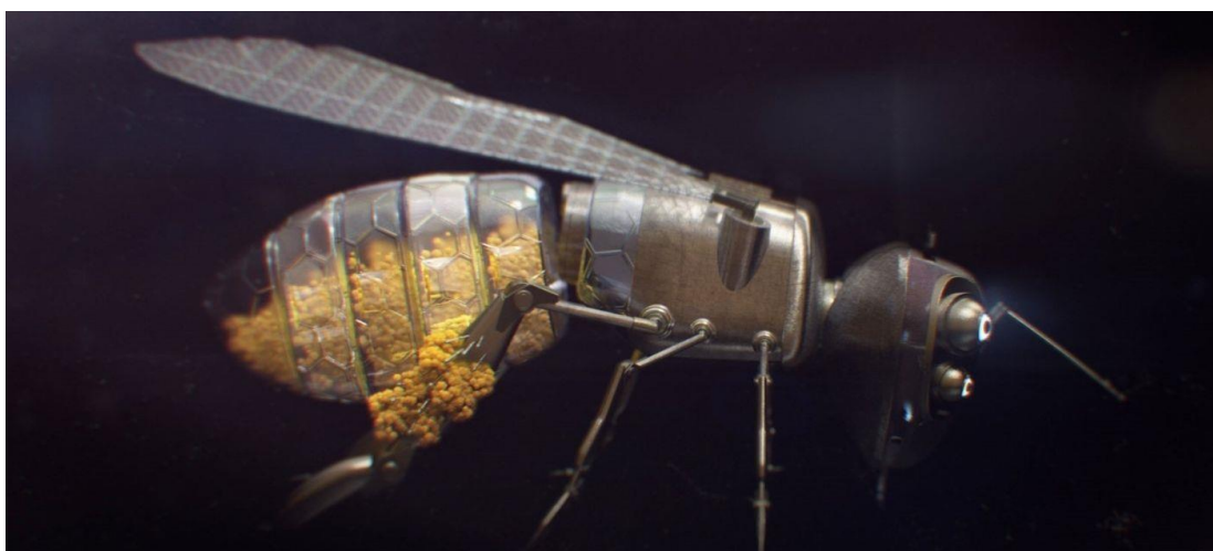
Slika 1. Black Mirror S6E3, mehanička pčela

Istraživači su koristili algoritme inspirirane mravima za dizajn robotskih sustava sposobnih za kooperativno ponašanje, samoorganizaciju i raspodjelu zadataka, odražavajući koordinaciju koju su na njima opazili. Proučavanje ponašanja mrava utjecalo je na razvoj algoritama i modela u području umjetnog života (A.L.), posebice u području robotike rojeva. Upravo tom tematikom bavi se engleski producent Charlie Brooker u svojem futurističkom serijalu pod nazivom „Black Mirror“. U epizodi pod nazivom „Hated in the Nation“ roj umjetno generiranih pčela koristi se za oprašivanje biljaka obzirom da su biološke pčele izumrle.