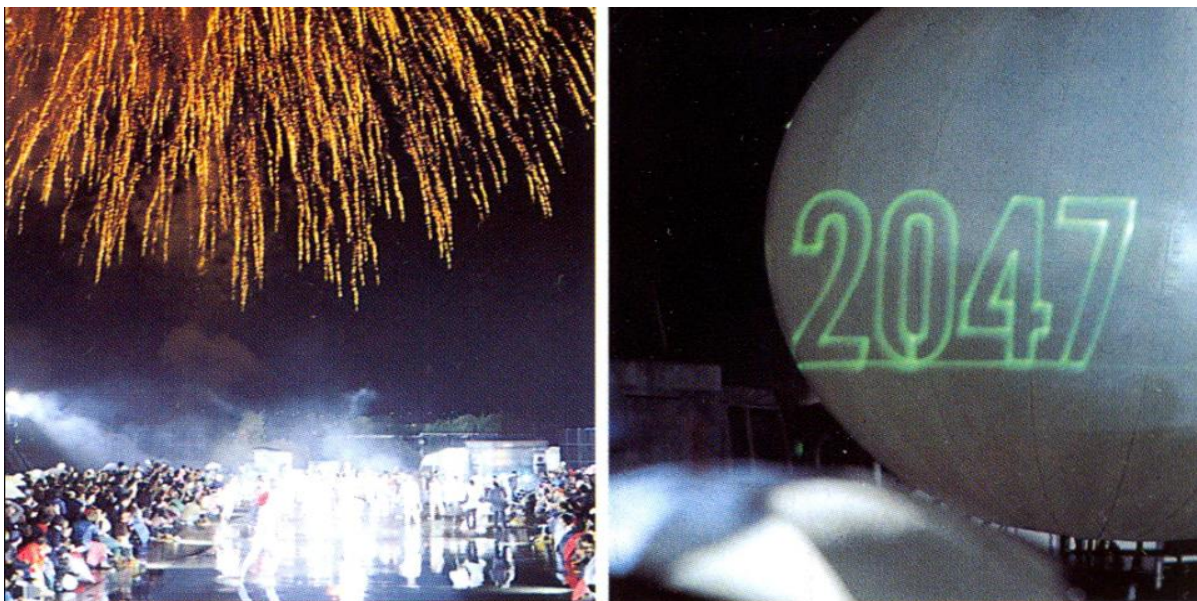
Slika 10. „20471120“ S/S 1998. „YIKES“

Revija održana 20. studenog 1997. u Tokiju, ostavila je neizbrisiv trag u svijetu mode. Ona kolažnom tehnikom povezuje visoki kapitalizam i supkulture, nove tehnologije i mitologiju, glazbu i film. Početak revije otvara kratki animirani film nakon kojeg se putem helikoptera spuštaju prvi modeli koji iz njega izlaze na koturaljkama. Iza njih se ubrzo pojavljuju modeli s futurističkim oglavljima i tehnološkim napravama, u dekonstruiranim, tamnim ili fluorescentnim odjevnim kombinacijama koje su napravljene od različitih sintetičkih materijala. Zajedno s modelima na reviji se pojavljuju minijaturni motocikli, klauni, performer i na štulama, čudovišta, astronauti, dinosauri i na kraju biznismeni u asimetričnim odijelima s aktovkama. Cijela revija karakterizirana je kaotičnom energijom, brzinom i masovnošću, a atmosferu dodatno pojačava umjetna kiša, dim, pirotehničke eksplozije i vatromet, te glazbena podloga koja povezuje metal, tehno i punk-rock glazbu. 56