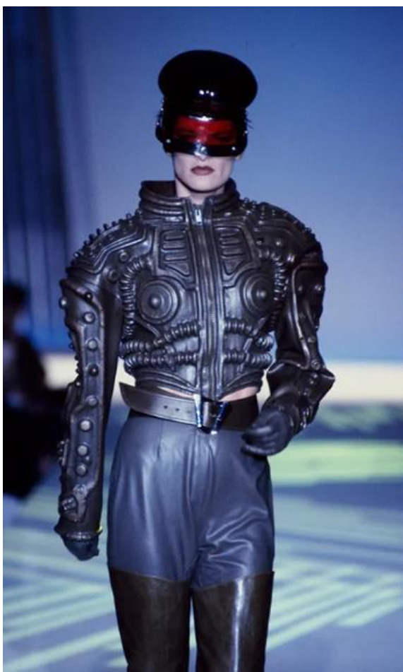
Slika 12. Thierry Mugler „Divine“ 1990.

Uz japanske dizajnere na globalnoj razini formirao se niz modnih dizajnera koji se bavili cyberpunk estetikom poput Rick Owensa, Demne, Gareth Puga, Raf Simonsa i drugih. No, možda ponajviše od svih ističe se francuski dizajner Thierry Mugler koji je 1990-ih godina kada se cyberpunk moda formirala, afirmirao njenu estetiku u svojim kolekcijama „Divine“ 1990. i „Beyond the Stars“ 1991. U njima su prikazani odjevni predmeti u koje su besprijeckorno uklopljeni elementi tehnologije, cyberpunk filma i kulture. Njih su karakterizirale siluete čije su površine bile nalik mehaničkom stroju, tamnih, zagasitih ili neonskih boja, a koje su realizirane putem 3D printa sintetskih materijala poput vinyla i lateksa.