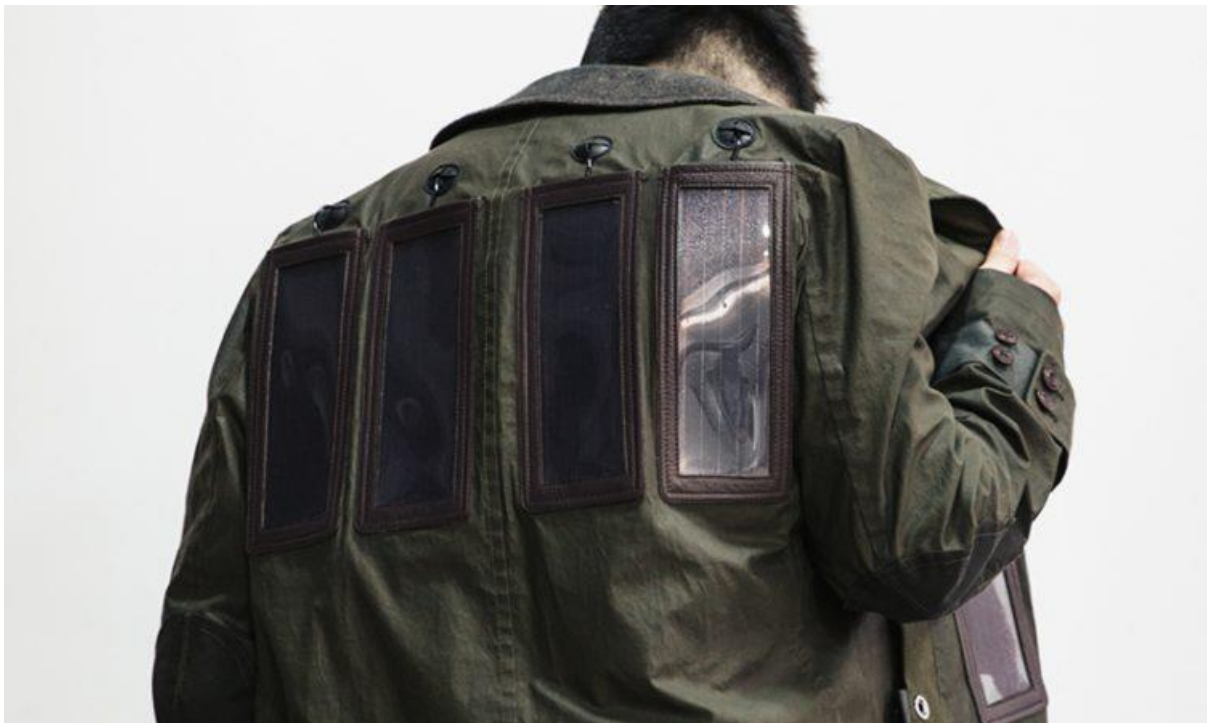
Slika 11. Junya Watanabe F/W 16

Njegov suvremeni rad ide korak dalje u predstavljanju cyberpunk estetike dodavanjem raznih ogavlja i tehnoloških naprava. Tako u kolekciji jesen/zima 2016. godine on na odjevne predmete ugrađuje solarne panele koji pomoću električnih provodnika imaju mogućnost zagrijavanja odjeće i punjenja tehnoloških naprava.