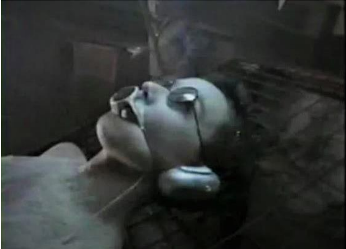
Slika 5. „Death Powder“ 1986.

Film odražava strahove i tjeskobe vezane uz nesputanu moć tehnologije i ljudsku želju da nadiđe svoja biološki zadana ograničenja. Android, koji se pojavljuje kao utjelovljenje tehnološke dominacije, izaziva osjećaj straha i ističe kontrast između ljudske krhkosti i hladne mehaničke prirode.