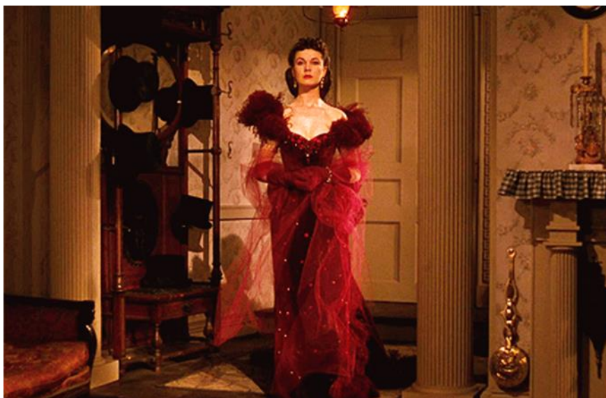
Slika 30. Scarlett u ikoničnoj crvenoj haljini na proslavi

prikladne dizajne izrađene od bogatih materijala poput baršuna. U tom razdoblju ženski kodeks odijevanja vlada strogim pravilima koja Scarlett krši kad stigne odjevena u svoju nevjerojatnu, ali odvažnu haljinu usred obiteljske proslave.