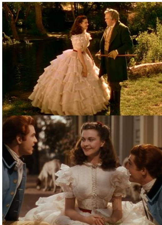
Slika 18. Scarlett O'Hara u bijeloj haljini s volanima

Scarlett O'Hara lik je veći od života i sila na koju treba računati – ona je lik koji balansira ambiciju, odlučnost i snagu. Ona je središnji lik filma, zbog čega je neizbježno usredotočiti se na nju kada govorimo o kostimima filma. Njezin ormar nije samo ikoničan, već prikazuje i čitav njezin lik. Walter Plunkett ispričao je priču o ovom nevjerojatnom liku kroz svoje kostime, ostavljajući nam ogromnu lekciju o narativnom dizajnu na koju će se pozivati mnogi nadolazeći dizajneri. Kada prvi put upoznamo Scarlett, ona je tek dijete – razmažena djevojčica koja je uvijek uživala u svim blagodatima i privilegijama svog statusa, ali još uvijek dijete. Sukladno tome, predstavljena je u velikoj bijeloj haljini s volanima.