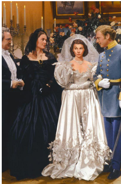
Slika 20. Vjenčanje Scarlett i Charlesa

Zanimljivo je kako ta haljina nije bijele boje kao i prijašnje haljine. U ovoj vjenčanici Plunkett se udaljio od bijelog tona, već je haljinu napravio od boje bjelokosti kako bi ona dobila manje otmjen izgled. Udajući se za Hamiltona iz inata, slomila je svoju nevinost. Ta suptilna promjena boje podcrtava njezin prvi zastoj jer napušta nevinost djetinjstva. Više nije tako nevinna te tako napušta idiličnu prirodu svog djetinjstva u isto vrijeme kada Jug ulazi u rat. Prije nego je Scarlett i promislila o braku s Charlesom, već je bila obučena u majčinu vjenčanicu, no kod vjenčаницe primjećujemo nešto zanimljivo. „Njena majka Ellen se udala oko 1844. godine, a moda tada je bila potpuno drugačija od ove koju je odjenula Scarlett, koja je tipičan primjer mode iz 1930-ih godina. Budući da je Plunkett pomno istraživao povijest mode nije moglo doći do zabune, te se pretpostavlja da je i njena majka uletjela brzo u brak te da je posudila vjenčanicu od svoje starije sestre koja se udala desetljeće prije nje, a poznato je da je moda u Americu stizala kasnije nego što je bila trend u Europi.“ 25