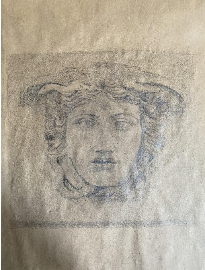
Slika 1, Rad (Meduza, Phidias)