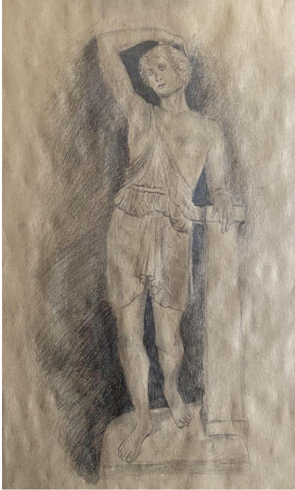
Slika 3, Rad (Amazonka, V. st. pr. Krista (rimska kopija), Ny Carlsberg Glyptotek, Kopenhagen, autor: Poliklet)