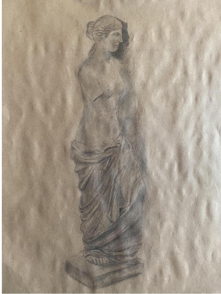
Slika 4, Rad (Afrodita Miloska, kraj II. St. Pr. Krista, Louvre, Pariz)