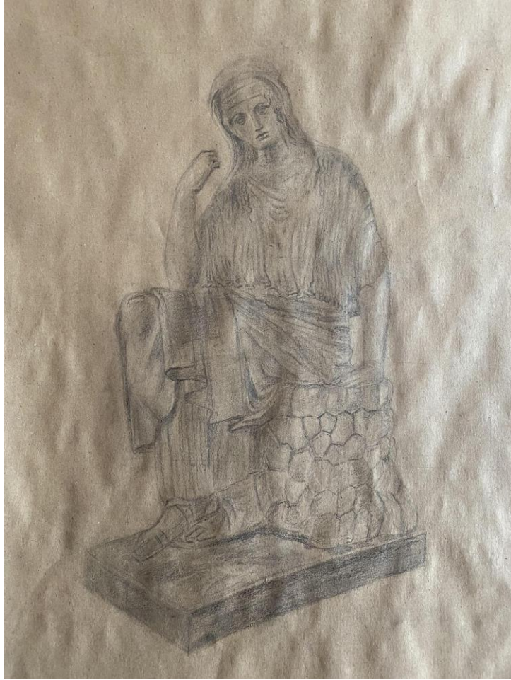
Slika 5, Rad (Penelopa, V. st. pr. Krista, Rim, Musei Pontifici, autor: Kalamis)