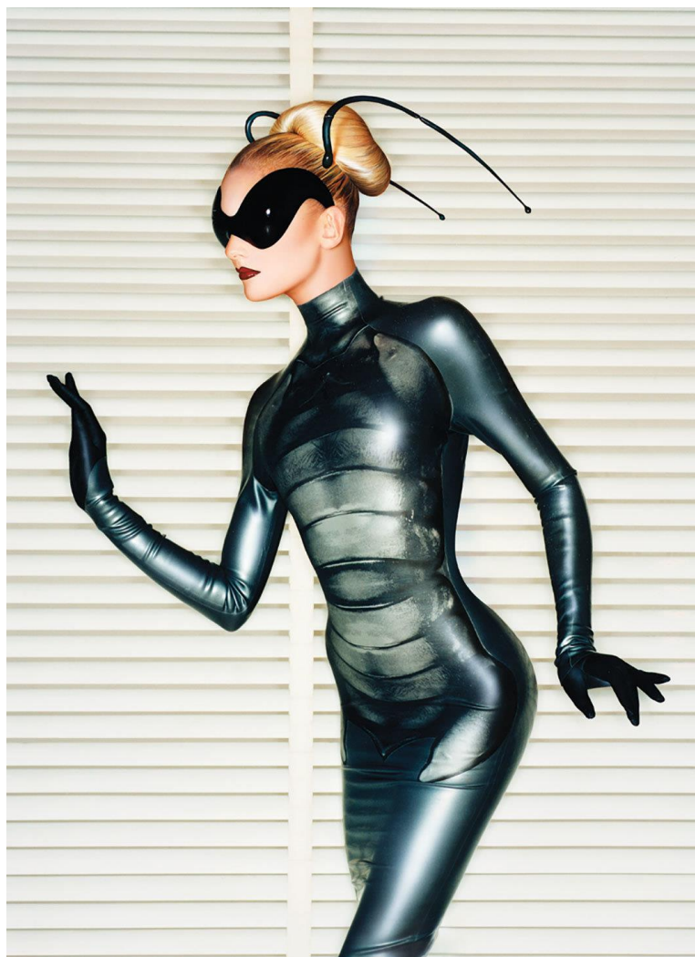
Slika 2. Thierry Mugler Spring/Summer 1997 „Les Insectes“

Valerie Steele jedna je od najvažnijih teoretičarki mode koja se bavila pojmom fetiša. Istraživajući tako sve njegove aspekte, 1996. piše Fetish: Fashion, Sex and Power , djelo koje se nadovezuje na Freudovo poimanje fetiša. Steele fetišizirane odjevne predmete smatra nastanjenima i nošenima, nikako isključivo objektom gledanja. Nadalje, Steele se referira na pojam „falusalne“ žene, odnosno za nju je falusalna žena ona koja putem mode komunicira moć muskularnim odjevnim predmetima u koje odijeva žensko tijelo. Isto tako, Steele naglašava da je upravo muskularna odjeća okidač za element fetiša jer nerijetko označava određenu uniformu. Steele zapravo ilustrativno podsjeća na to da je definicija fetišizma nerijetko vrlo fluidna i podložna raznim interpretacijama, a uzmemo li fetiš kao izvor moći, i pozicija žene, kao i uloga same mode, ali i objekti, mogu biti fetišizirani. Još davno je Freud prepoznao da dijelovi tijela ili pojedinac mogu biti fetiš-objekti, dok je u kontekstu mode važno napomenuti kako se podražaj može osjetiti i samo kroz objekt, primjerice određeni odjevni predmet. To nam još jednom