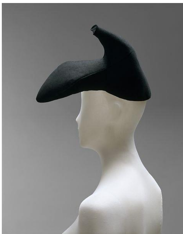
Slika 5. Elsa Schiaparelli Shoe Hat, 1937.-38.

Modna dizajnerica, muza i umjetnica Elsa Schiaparelli sinonim je za identitet, maskarade i performativnost. Njezin nadrealistični dizajn od 1936. do 1939. dio je mijenjajućeg diskursa avangarde. Evans u radu Masks, Mirrors and Mannequins: Elsa Schiaparelli and the Decentered Subject analizira ključne odjevne predmete od 1937. do 1938. koji fokusiraju ideju Elsine maskarade. Primjerice, Shoe Hat and Ensemble , koje je dizajnirala u kolaboraciji s Dalíjem, samo su neki od primjera metafore „maske” koje Joan Riviere opisuje kao nešto poput odjeće, ali nešto što ima moć sakriti, odnosno transformirati ono što se nalazi ispod.