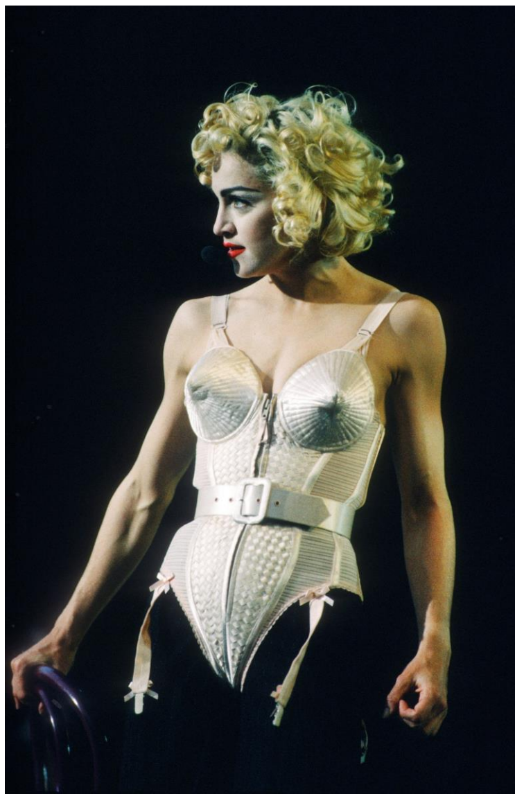
Slika 1. Madonna, „Blond Ambition Tour“, Rotterdam, 1990.

Kada govorimo o materijalima, koža je materijal koji se najčešće koristi u fetišiziranoj modnoj estetici. Claude Montana među prvima postaje poznat po koži, a devedesetih ga je slijedio talijanski dizajner Gianni Versace koji je napravio pravu modnu senzaciju koristeći spomenuti materijal. Tada se ponovno postavlja jedno od ključnih pitanja: je li to chic ili okrutno? Dizajneri poput Thierryja Muglera i Johna Galliana u visoku modu uvode i druge materijale, poput npr. lateksa koji vrlo brzo zauzimaju mjesto sinonima fetišiziranih modnih kolekcija, a zanimljivo je i to da su spomenuti dizajneri karakteristični i zbog zajedničke naklonosti ka „nakaradnim“ cipelama i čizmama koje su važan dodatak fetiš-garderobi.