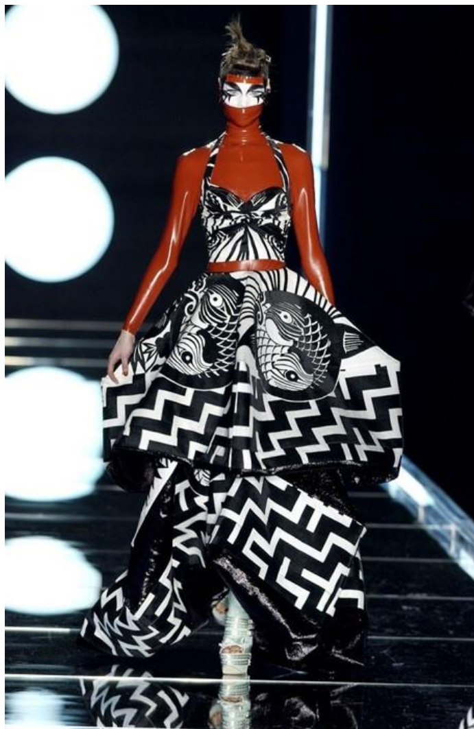
Slika 3. Christian Dior Autumn/Winter 2003.

potvrđuje kako je interpretacija fetišizma u modi poprilično konfuzna te bitna odrednica višeznačnih simbola. 45