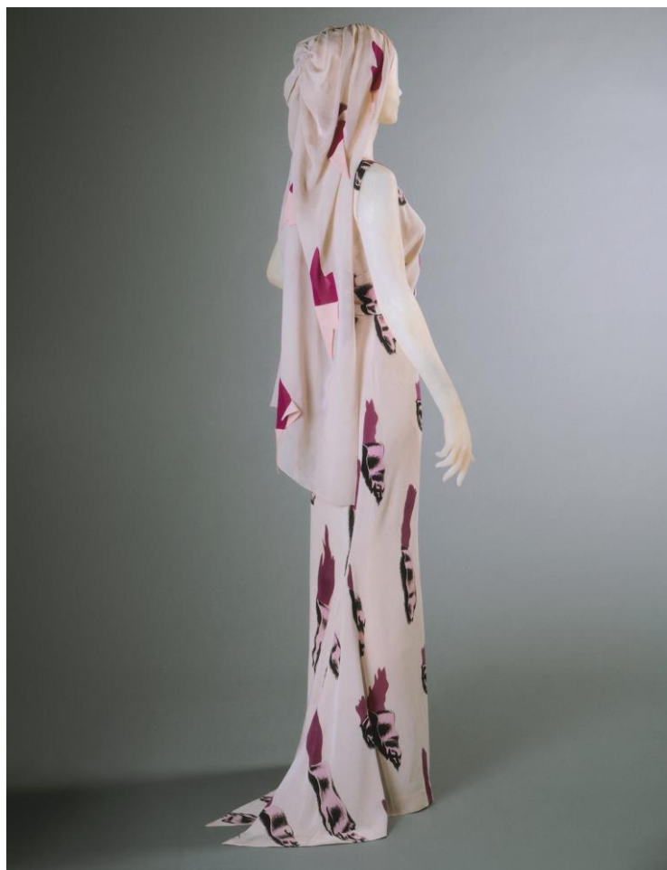
Slika 6. Elsa Schiaparelli Spring 1938. Tears dress „Circus“

Elegantna večernja haljina ukrašena je trompe l'oeil uzorkom rasparotina i nosi se sa šalom za glavu. Blijede „pukotine“ boje mesa otkrivaju tamniju ljubičasto-ružičastu svilu koja aludira na boju modrica i rastrganog mesa. No, do danas ostaje nerazriješeno je li iluzija namijenjena sugeriranju poderane tkanine ili mesa? Što god da je zaključak, Elsa se igra s idejama nesvojstvenima modi vješto suprotstavljajući ravnotežu i spokoj, nasilju i tjeskobu. Kolekcija Circus tako postaje mjesto spektakla, zabave i napuštanja, ali i mračan svijet utočišta, opasnosti i gubitka sebe. Cirkus je sada kao kakvo erotizirano mjesto, „pokretni simulakrum želje u pokretu“, objašnjava Evans.