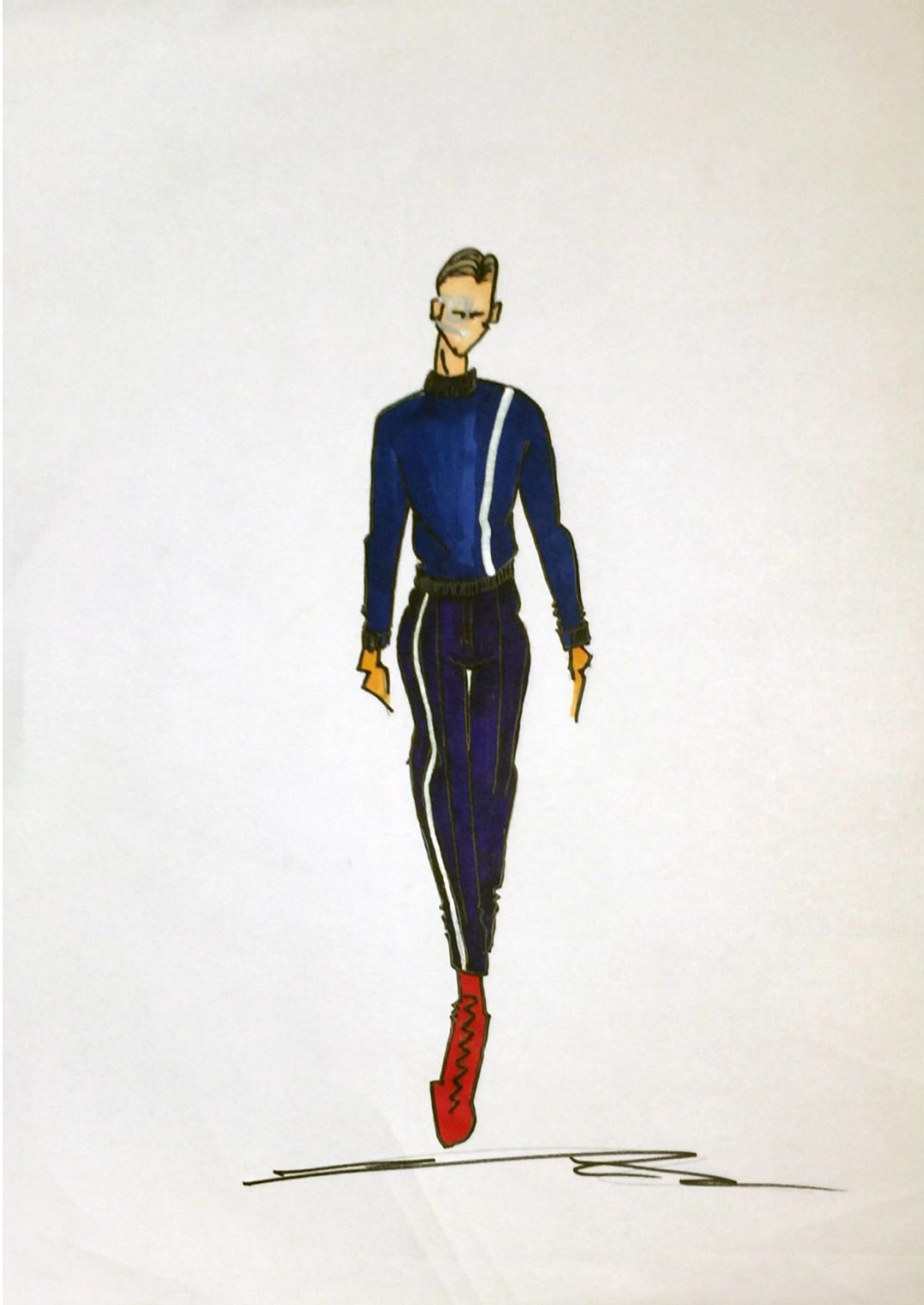
Jean Baptiste Emanuel Zorg