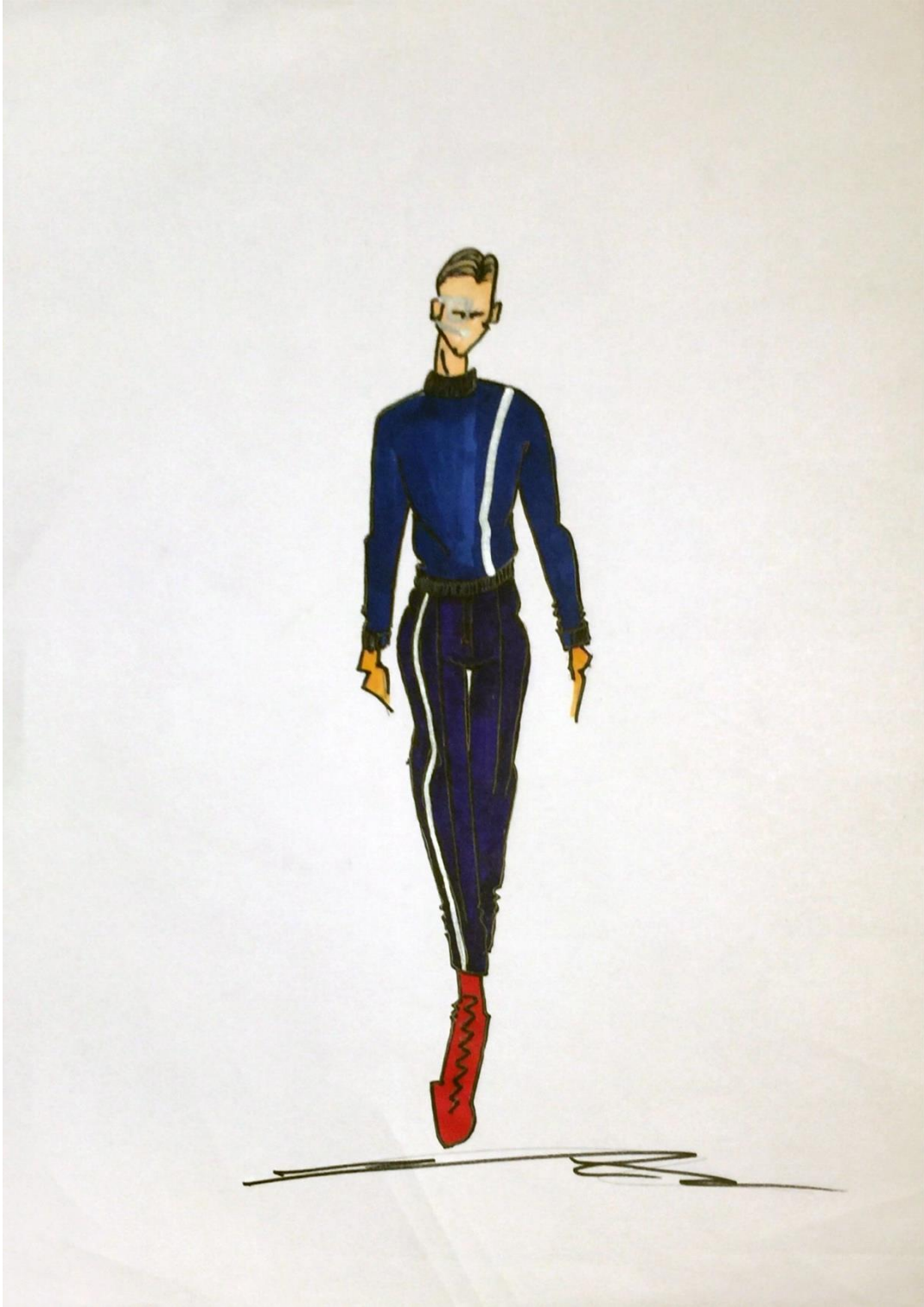
Jean Baptiste Emanuel Zorg