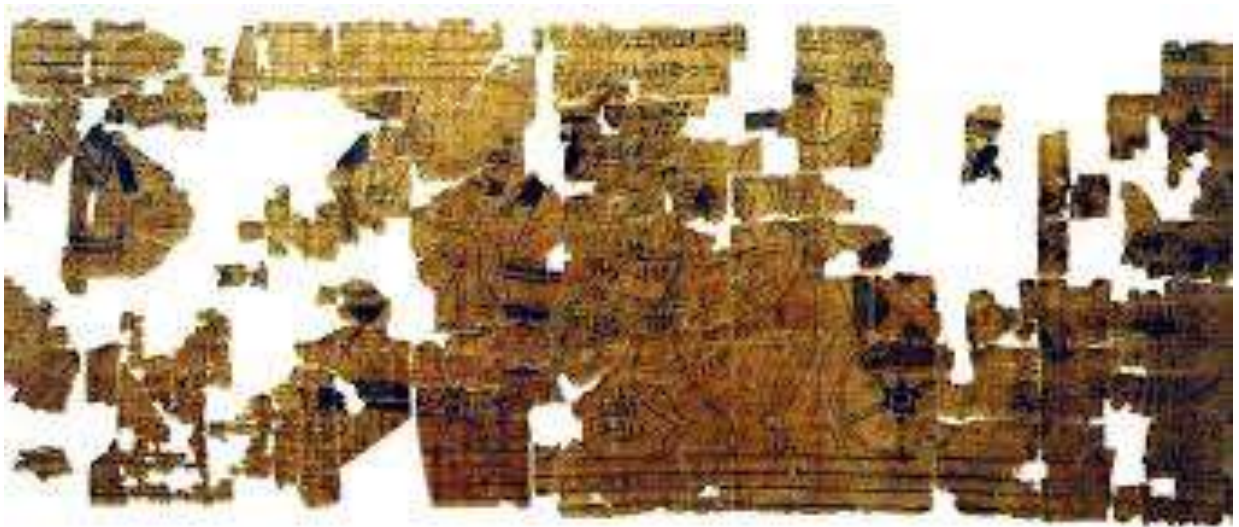
Slika 19. Erotic ands Satirical papytus, Der el-Madina (1186-1070 Pr. Kr.)

Rekreacija nagog ljudskog tijela u umjetnosti zahtjeva od gledatelja da svjesno ili subjektivno odluči je li to u dobrom ili lošem ukusu, što vrijedi i kako ocjenjujemo umjetnost općenito. Seksualno uzbuđenje ne mora biti jedina namjera pornografije, ali smatra se da je to njegova središnja ili krajnja namjera. Sa biblijskog stajališta, možemo se osvrnuti na Pavlovu poslanicu Rimljanima: