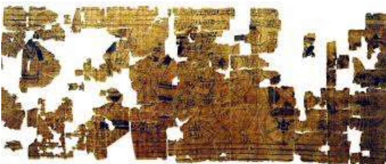
Slika 19. Erotic ands Satirical papytus, Der el-Madina (1186-1070 Pr. Kr.)

Rekreacija nagog ljudskog tijela u umjetnosti zahtjeva od gledatelja da svjesno ili subjektivno odluči je li to u dobrom ili lošem ukusu, što vrijedi i kako ocjenjujemo umjetnost općenito. Seksualno uzbuđenje ne mora biti jedina namjera pornografije, ali smatra se da je to njegova središnja ili krajnja namjera. Sa biblijskog stajališta, možemo se osvrnuti na Pavlovu poslanicu Rimljanima: