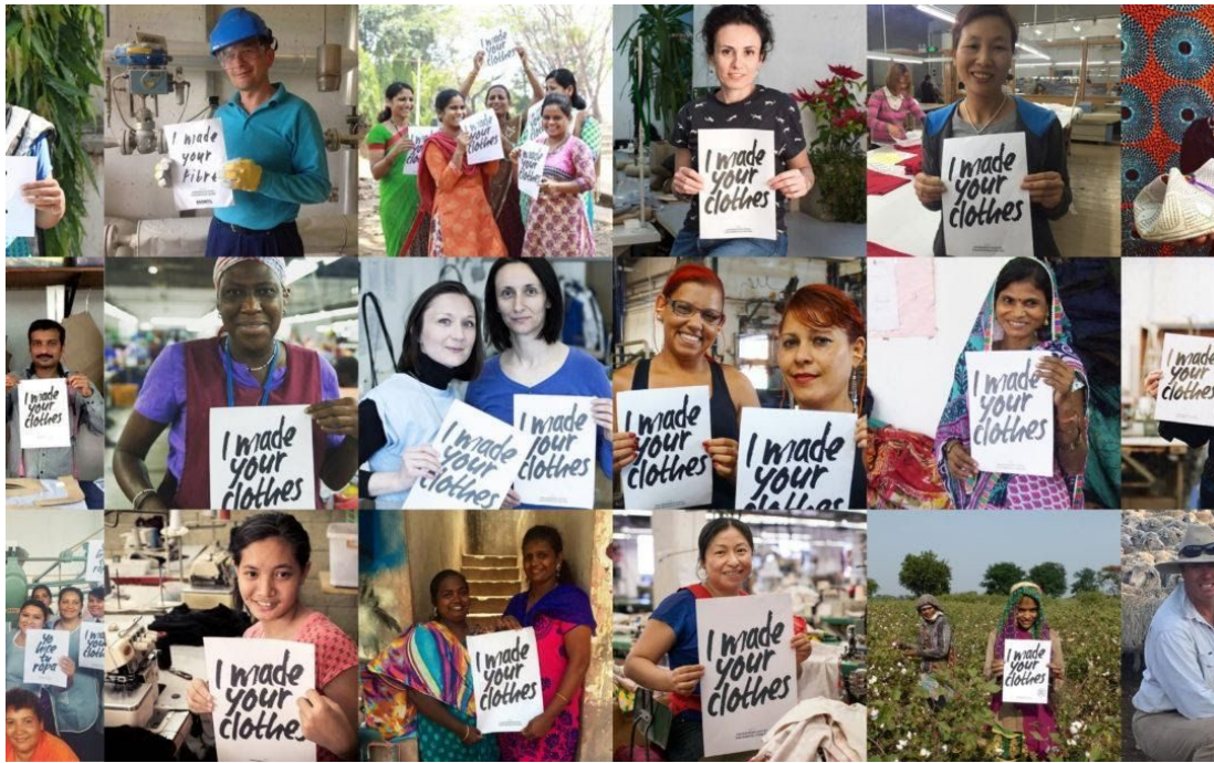
Slika 1 - Prikaz inicijative #whomademyclothes osnovane od strane Fashion Revolution-a, gdje su se radnici koji rade u proizvodnji odjeće slikali s natpisom I made you clothes u svrhu privlačenja pažnje potrošača gdje se proizvode artikli koje koriste