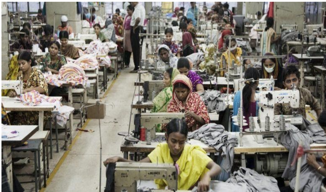
Slika 4 - Fotografija radnika u sweat shopu koji proizvodi odjeću

dolara. Mnogi se brandovi oslanjaju na sirovine iz ove regije te bi zabrana njihovog korištenja izazvala velike probleme i za proizvođače, ali i za farmere iz regije koji ovise o proizvodnji pamuka. Od 2017. godine više od milijun ujgurskih muslimana premješteno je u visoko-sigurnosne kampove za "de-ekstremifikaciju" gdje su prisiljeni proizvoditi industrijsku i poljoprivrednu robu za izvoz[12].