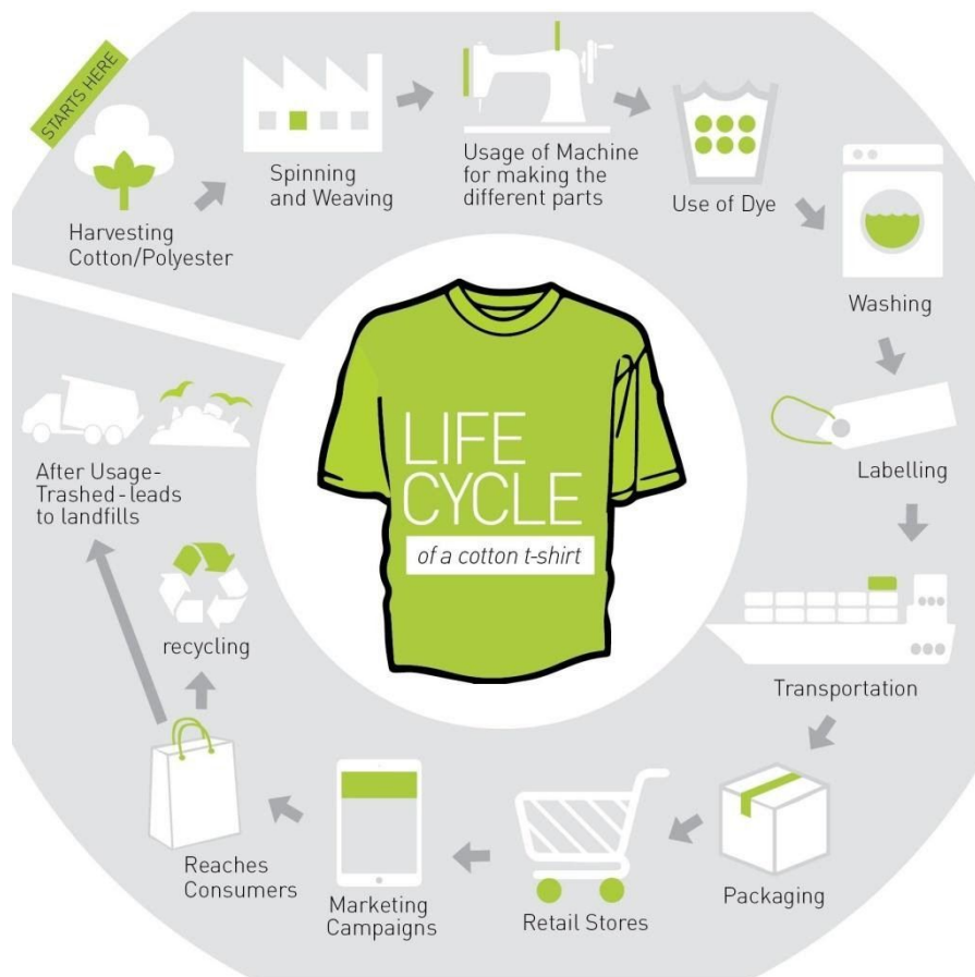
Slika 2- Prikaz životnog vijeka modnog predmeta od njegovog nastanka do trenutka kada postaje otpad