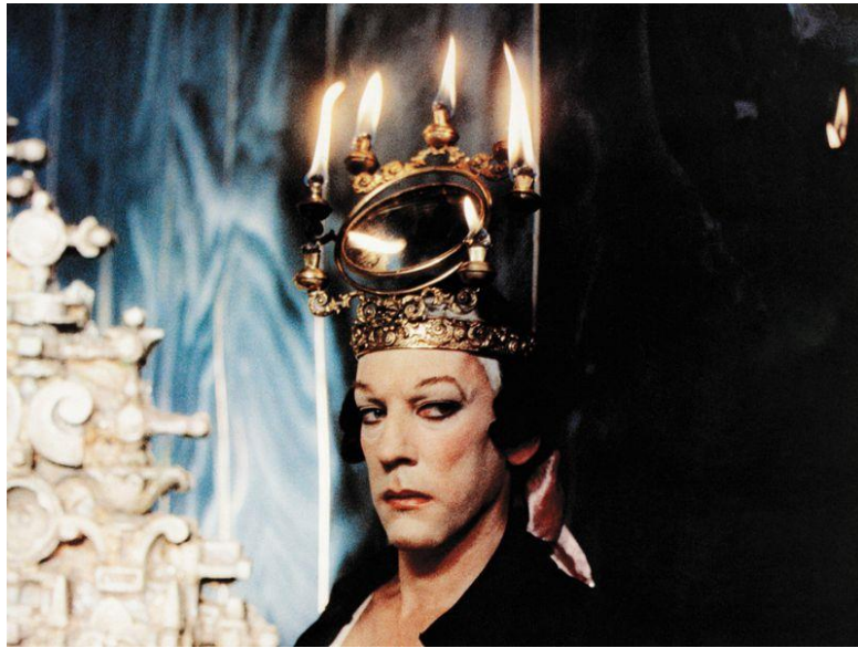
Slika 11: Casanova s neobičnom krunom sačinjenom od svijeća