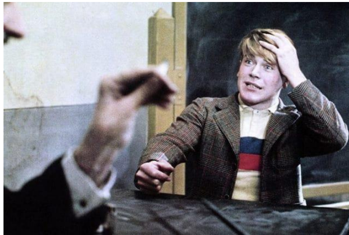
Slika 13: Titta u jednoj od svojih tipičnih odjevnih kombinacija, smeđi sako i prugasta polo majica ispod

Titta (Bruno Zanin) odjeven je u filmu kao i ostali dječaci toga doba. Nosi smeđe kaputiće od tvida, a u jednoj sceni ispod sakoa nosi polo majicu sa plavom i crvenom prugom. Hlačiće mu sežu, kao i ostalim dječacima, do koljena, nosi čarape i smeđe kožne cipele. Razdragan je i pozitivan lik, pomalo nestašan dječak koji prolazi kroz adolescentsku dob i kupi sve popratne pojave što ta dob donosi sa sobom. Titta i njegovi prijatelji nose staru odjeću, ručno izrađenu, koja ih još dodatno otuđuje od žena (mlađih i starijih) u gradu. Većinom na njihovoj odjeći prevladavaju nijanse smeđe boje, od samta nose kape na glavi u stilu toga vremena, sakoe, i remenčiće koje im pridržavaju hlače. Odjeća je izrađena od jeftinijih materijala.