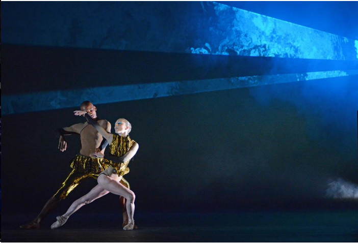
Slika 14, Balet Woolfs Works, 2015.

Kao zadnju varijantu imamo balerine tijekom vježbi u malo opuštenijim pozama i dugim prozirnim haljinama i dva akta u neobičnim položajima koji prikazuju moderni balet. Balerine modernog baleta imaju naglašenu anatomiju tijela. Za usporedbu prikazane su emocije kroz pokret i u klasičnom i modernom baletu.