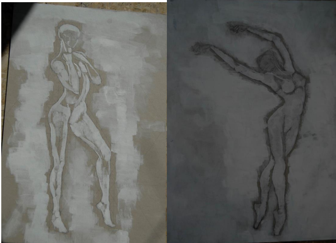
Slika 9, Rad

Osnova za početak izrade balerine kao figure je tehnika olovke, i to u obliku aktova. Zatim je cijeloj slici dana bijela podloga. Nakon podloge su figure oslikane lagano rozom bojom ili bojom kože za isticanje osnovne anatomije tijela.