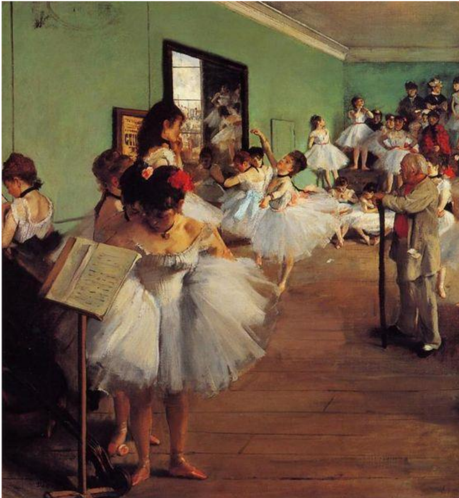
Slika 5, Degas, E., Ispit iz plesanja , 1874.

I haljine djeluju jednostavnije, iako jednako lepršave i u pokretu, imaju manje šarenih detalja. Promjena boje u svjetlije i živahnije inspirirala me za izradu pozadine u raznim bojama i odraz svjetla kod balerina koje vježbaju u opuštenom položaju.