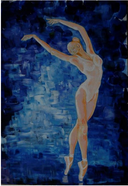
Slika 13, Rad