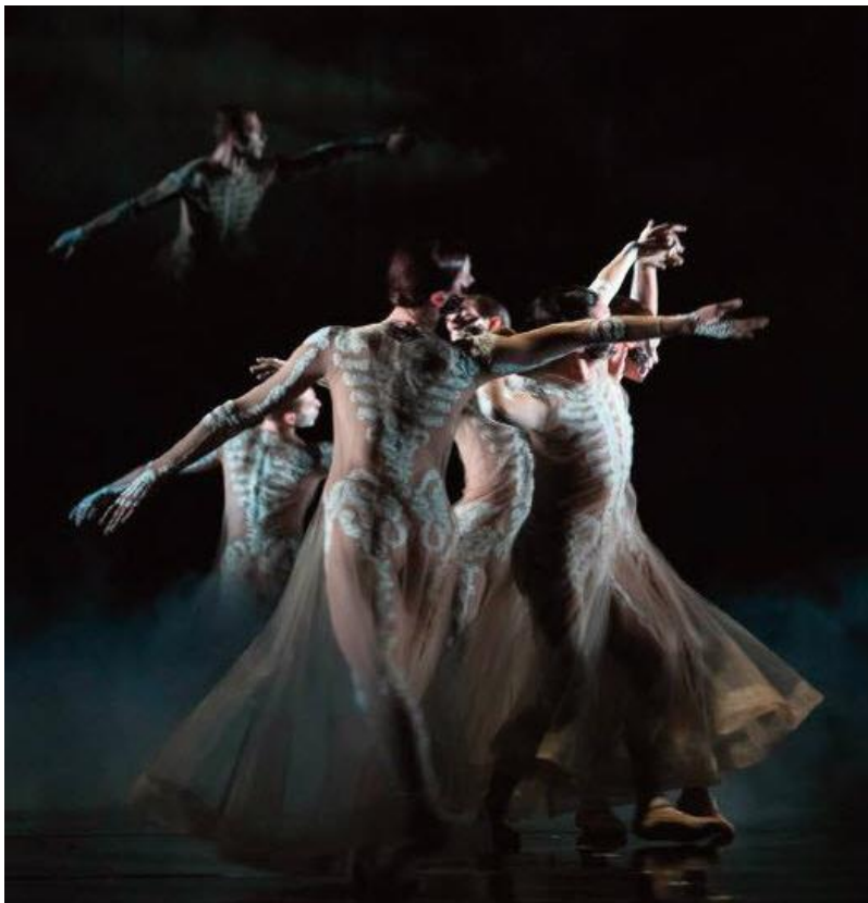
Slika 15, Bolero

Istražujući današnji utjecaj na modu baleta najveći dojam su mi ostavili kostimi Ricarda Tiscia za „Paris Opera Ballet“ za izvedbu Bolera. Za adaptaciju Ravelovog Bolera Tisci je izradio seriju prozirnih trikoa izvezenih sa rebrima i kralješcima sa ciljem naglašavanja tijela plesača. Kostimi dolaze posebno do izražaja jer su vezeni bijelom bojom dok je cijela scenska pozadina tamna i prožeta usmjerenim svjetlom. Prozirnost trikoa i lepršavost materijala, te izraženi mišići plesača savršeno se uklapaju.