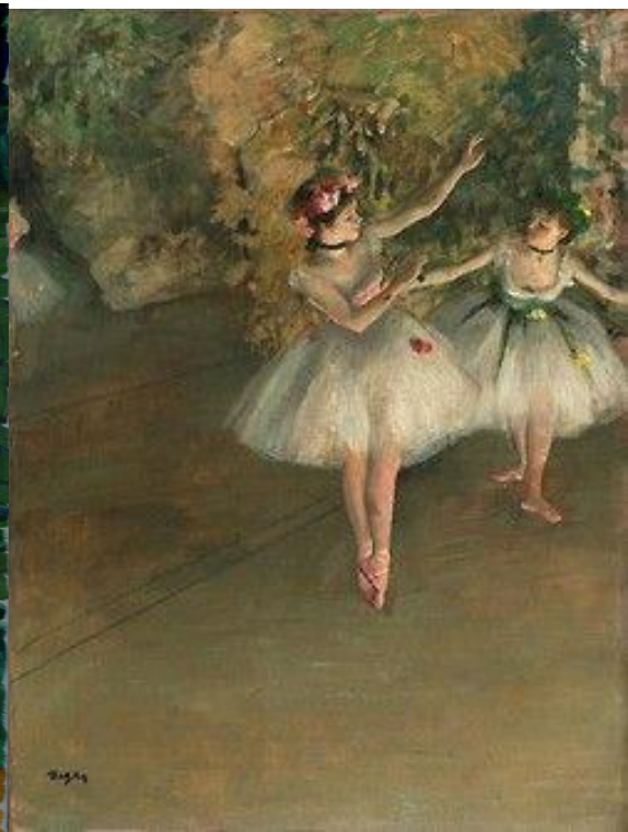
Slika 12, Degas, E.,