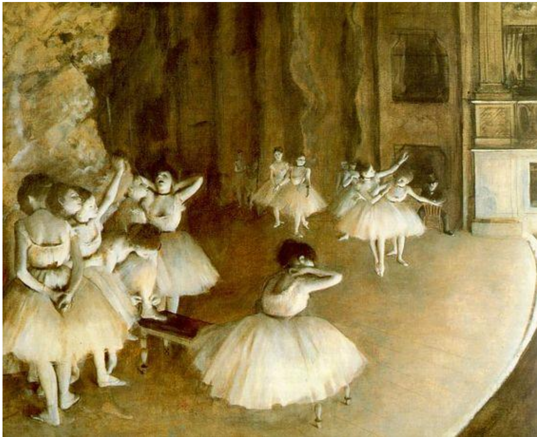
Slika 3, Degas, E., Baletni pokusi na pozornici , 1874.

Na slici iz 1874. godine „Baletni pokusi na pozornici“ Degas je uporabom kontrasta namjeravao prenijeti atmosferu. Sjaj kazališnog svjetla stvara kontrast u odnosu na jake sjene u dubokoj, tamnoj pozornici. Degas je tvrdio da „privlačnost ne leži u prikazivanju izvora svjetlosti, nego u prikazivanju njezinih efekata“. Svjetlost i praznina kazališta stvaraju čudan dojam. Postigao je pravi dojam umjetnog svjetla tj. stvarnog kazališnog svjetla. To je također postigao upotrebom slične boje puti i haljina. Boja koju je Degas upotrijebio kao neprirodna boja kazališta me inspirirala za boju trikoa i prikaza tijela balerina modernog baleta. (Grove: Degas, 2006.)