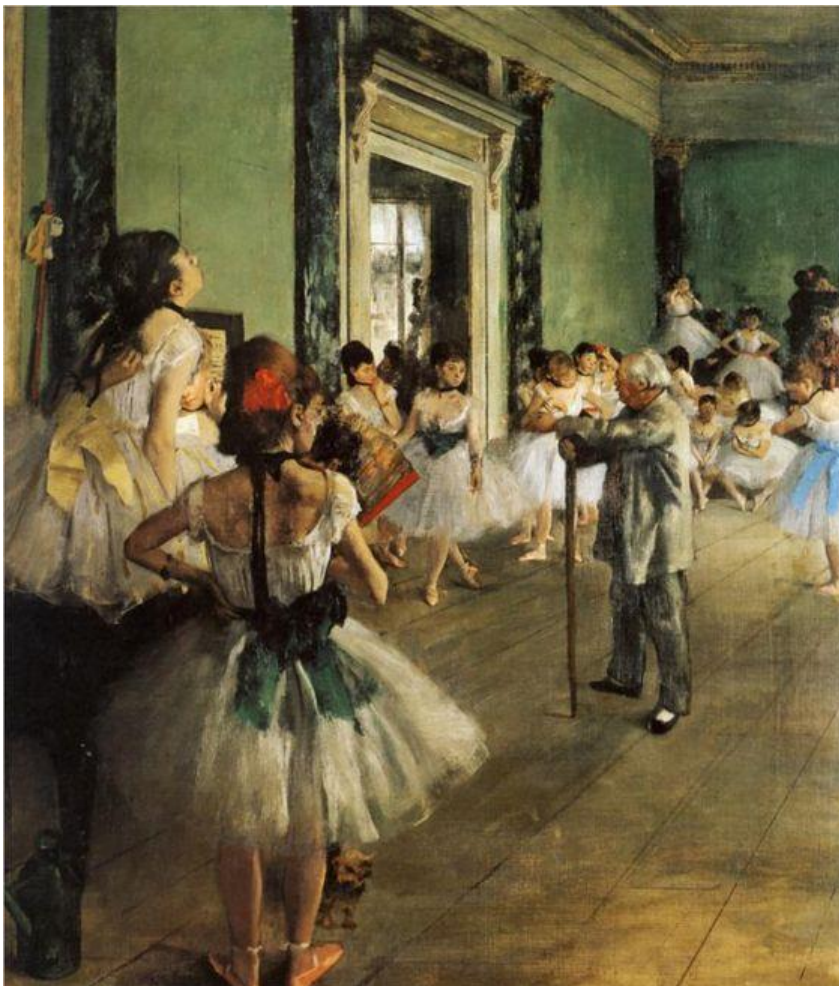
Slika 4, Degas, E., Sat plesa , 1873.

špic papučica i haljina do koljena. (Grove: Degas, 2006.)