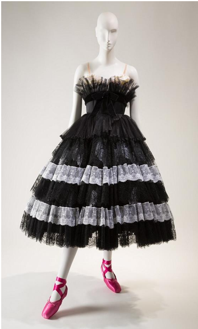
Slika 16, Valentino, 2012

Valentinova haljina iz 2012. godine koja je dizajnirana za izvedbu „Bal de Couture“ ima oblik klasične baletne haljine. Također korištena je lagana prozirna tkanina koja dava tipičnu lepršavost balerina. Ujedno til na prsima dava i dojam jednog nemira i slobode kroz detalj svijetlih naramenica. Detalj koji mi se posebno svidio je roza boja špic papučica koja je vrlo upadljiva i privlači pažnju na rad noga.