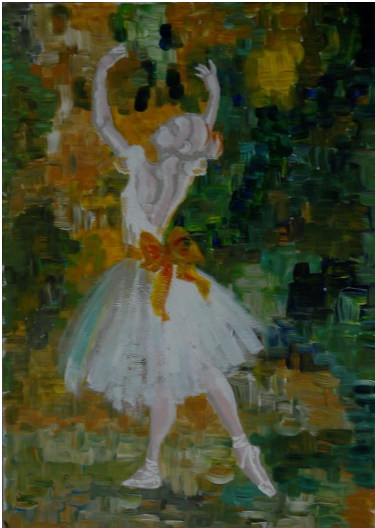
Slika 11, Rad

posebni efekti, pogotovo lasersko svjetlo i pozadina koja podsjeća na prelamanje svjetla i igru boja u dragim kamenjima kao što su rubin i smaragd.