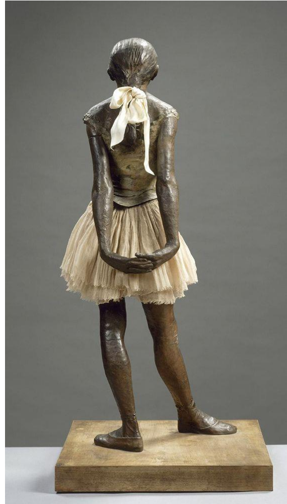
Slika 8, Degas, E., Mala četrnaestogodišnja plesačica , 1879., sa stražnje strane

Degas svoj uspjeh jedinstvenog kipara 19. stoljeća postigao zanemarujući očekivanja javnosti. Nije obraćao pozornost na pravila, stvarajući „kiparske fotografije bez ikakve pripreme“, koje su umjetnost namjerno lišavale njezine prateće pompe i ceremonije, pa ih stoga ne treba podcjenjivati u odnosu na Rodinove skulpture. (Growe: Degas, 2006.)