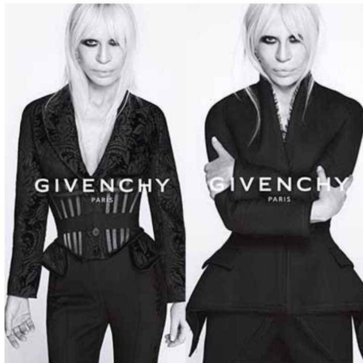
Slika 13 "Crno-bijele slike Donatelle za Givenchy" 2015. URL: https://www.look.co.uk/fashion/donatella-versace-is-the-new-face-of-givenchy-38694 (pristupljeno: 18.7.2020.)

iznenađenje za modne mode - Riccardo je vijest otkrio još u travnju, s tim da je modni paket s nestrpljenjem iščekivao fotografije. "Tako ponosan i počašćen što sam predstavio moju novu ultimativnu ikonu: Donatellu Versace", napisao je tada na Instagramu, uz crno-bijelu sliku para. To nije prvi put da Givenchy izaziva pomutnju - u svibnju je super zvijezda Beyoncé izazvala nagađanja da će pokrenuti kampanju za etiketu nakon što je 33-godišnjak primijećen na fotografiranju s Riccardom, odjeven od glave do pete u svojim dizajnom i poziranje za kameru na krovu u Brooklynu. Jedina stvar koju u modi ne volim je zapravo minimalizam - rekla je Donatella našalivši se na svoj račun jer joj mnogi modni kritičari spočitavaju 'pretjerani kič'. U svom kreiranju, Donatella je ostala verna prepoznatljivim stubovima Versace stila koje je njen brat utemeljio, te je stvarala odeću za žene koje se ne plaše da pokažu svoju jačinu ali i ženstvenost kroz senzualne i izazovne linije garderobe.