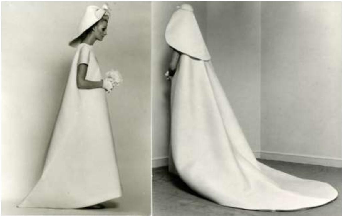
Sl.3. Balenciaga vjenčаница 1967.

zapravo je savršeni primjer konstrukcije s rukavima koji jednako lako traže svoju finalnu točku što je dalje moguće od tijela modela, noseći sami svoju težinu. Iako u drugom vremenu i prostoru, jedna za formalnu i druga za neformalnu prigodu, ideja ipak reže kroz sve slojeve značenja.