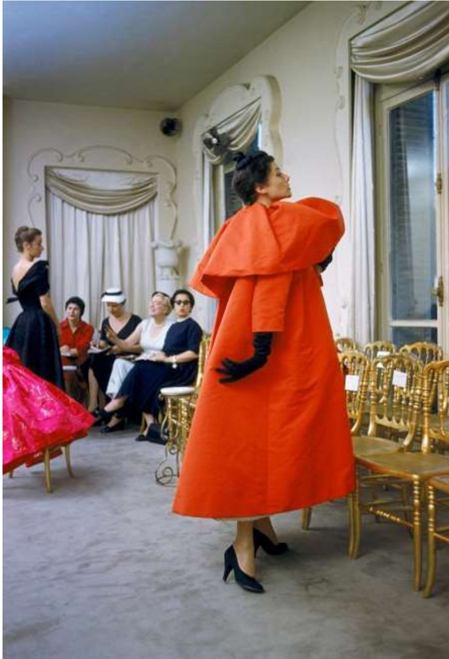
Sl.9. Balenciaga kaput, salonu Parizu 1954.

prikazivanja elegancije marginalnih struktura zapešća i gležnjeva. Yamamotova verzija (kao i većina kaputa u danj reviji) iz sezone jesen/zima 2014/15 (Sl.10), ostavlja frekvenciju iste siluete. Ono što kod Balenciage služi gotovo kao iščekivanje skidanja kako bi se razotkrila haljina ispod, kod Yamamota dijeluje gotovo kao zaštita od radijacije i elemenata.