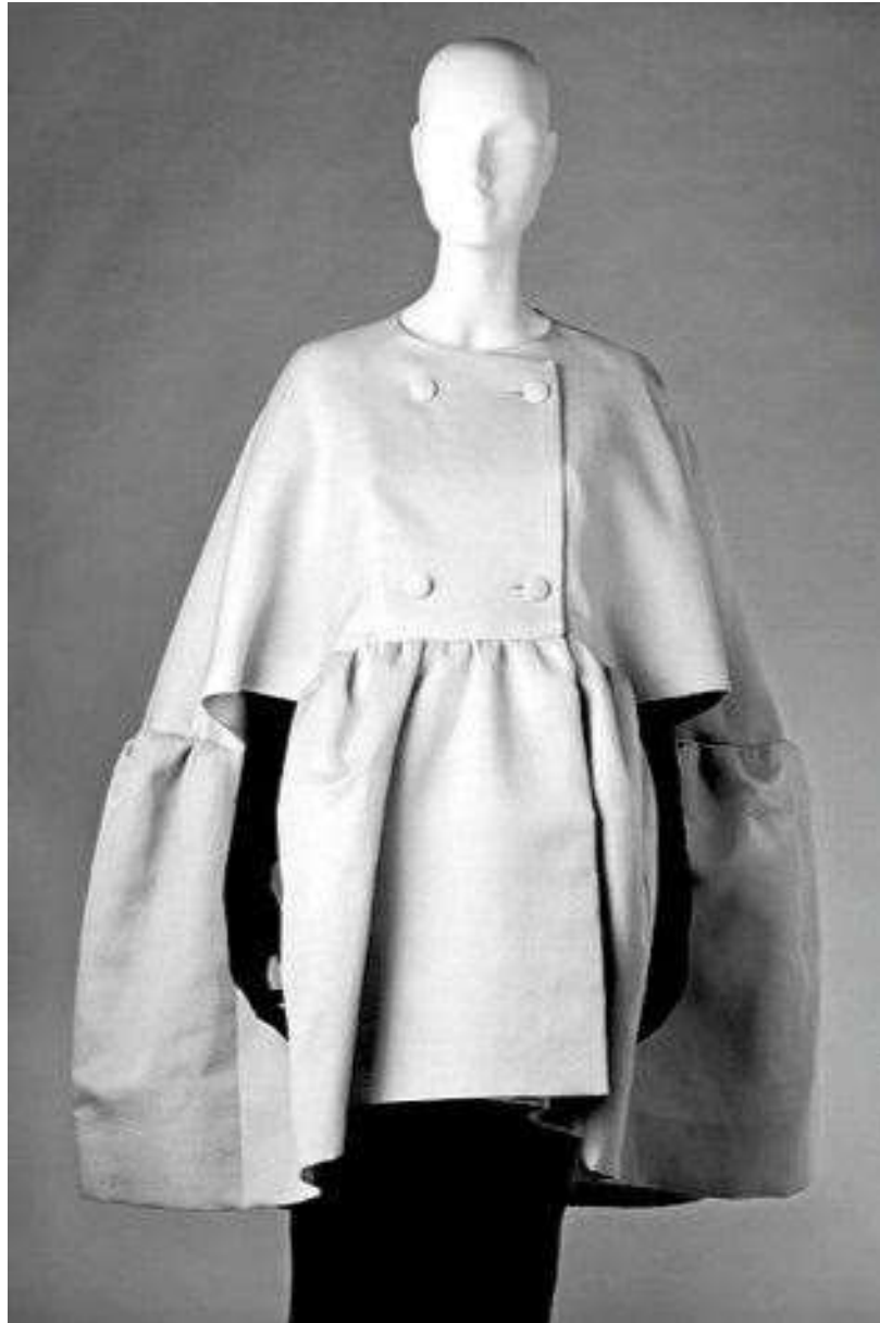
Sl.11 Cristòbal Balenciaga, 1963.

izrađena je u sivoj boji, identičnih linija i namijenjena je kao direktni citat a ne parafraza. U igri s idejom discipline kroja i krivulja rigidnih nabora Nicolas je na svoj model dodao i šešir koji nalikuje kacigi i čini se dodatno i u krućoj tkanini naglasio širenje donjeg dijela kaputa za apsolutno spektakularan volumen oko tijela modela u zvonolikoj odjevnoj skulpturi.