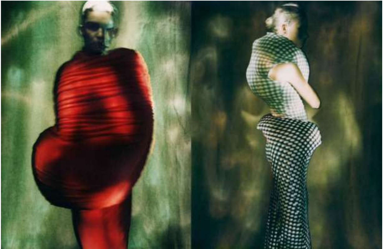
Sl.6 Rei Kawakubo for Comme des Garçons, “Body Meets Dress - Dress Meets Body,” ss 1997