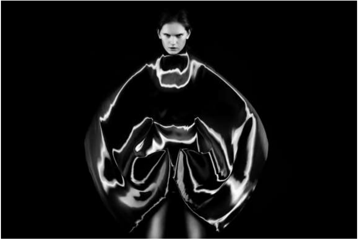
Sl.8 Iris Van Herpen, 'Micro', SS 2012