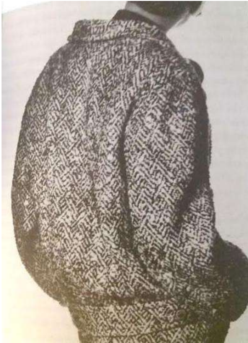
Sl.1. Arhivska snimka, Cristóbal Balenciaga

odjevnom predmetu, sasvim u skladu istočnjačkih tendencija relokacije pogleda, Balenciagin šapat alternativne siluete leđa amplificirao i poslao poruku poigravajući se zanemarenim volumenima oko tijela direktno u lice gotovo uvijek na en face koncentrirane mode Zapada. 59 (usporedi Sl.1 i Sl.2)