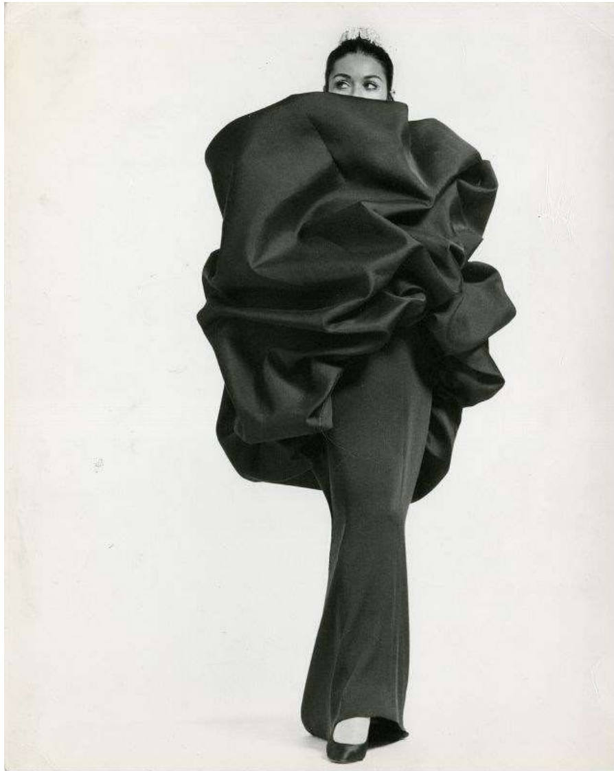
Sl.5 Arhivska fotografija, Cristobal Balenciaga, AW 1967

koncentrirani volumen "chou" haljine, koja iako ne slijedi jednaku siluetu, idejno bi se jednako lako mogla svojom neprimjernom „izraslinom“ unutar uvriježenih silueta definirati „tumorskom“ – kao što je haljine Kawakubo definirao prodavač u jednoj njujorškoj poslovnici. 63