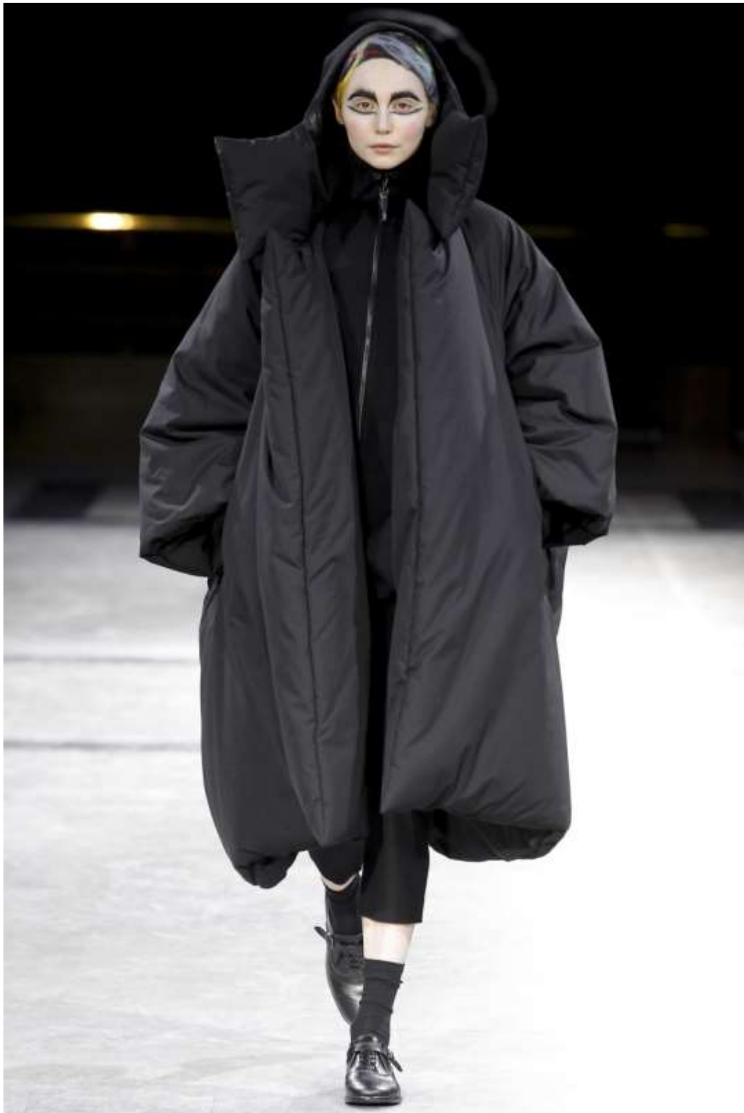
Sl.10 Yohji Yamamoto, Jesen/Zima 2014/15