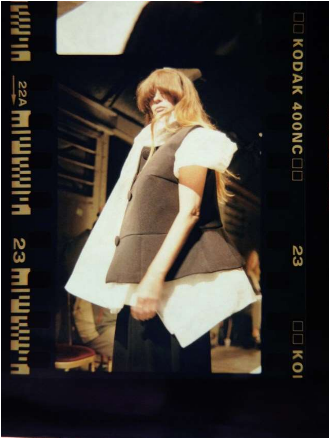
Sl.4. Maison Martin Margiela, AW 2000-01