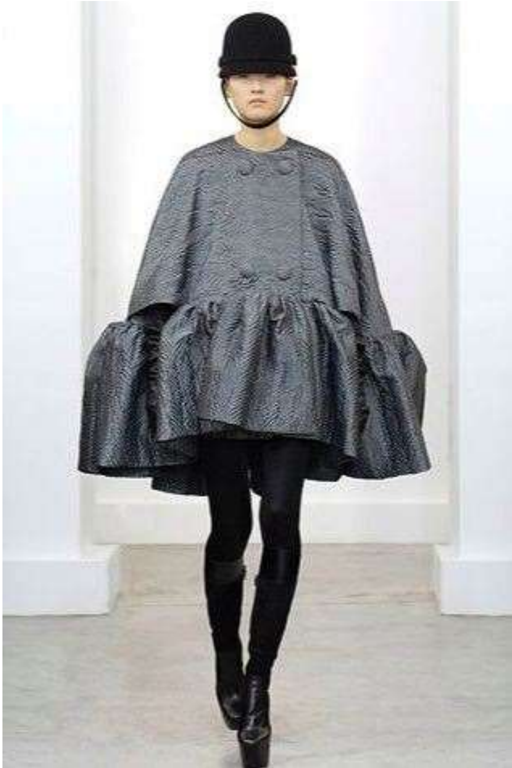
Sl.12 Nicolas Ghesquière Jesen/Zima 2006/07