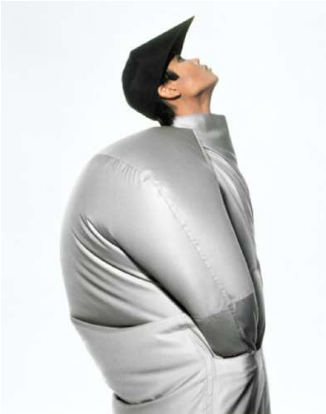
Sl.2 Issey Miyake