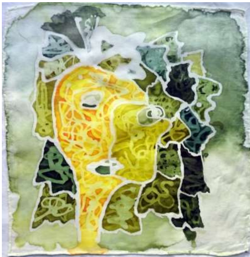
Slika 34: primjerak uzorkovane svile

Nakon što su odabrani predlošci, bilo je potrebno odlučiti koja tri predložka će ići na svilu manjih, a koja tri na svilu većih dimenzija. Kao najprikladniji za iscrtavanje na svilu manjeg formata odabrani su uzorci prikazani na slikama 17, 21 i 22. Prvi koji je iscrtan i oslikan je predložak prikazan na slici 17. Pri drugom zagrijavanju voska, dogodila se mala nesmotrenost, te je vosak pregrijan i kao takav nanesen na svilu, što se može vidjeti u 'kosi' portreta. Početna boja je žuta, iz koje su zatim izvedeni svi ostali tonovi. Na uzorku je trostruki nanos voska i boje, te je na taj način postignut željeni efekt, koji je bilo teško prikazati tehnikom kojom su nacrtani predlošci.