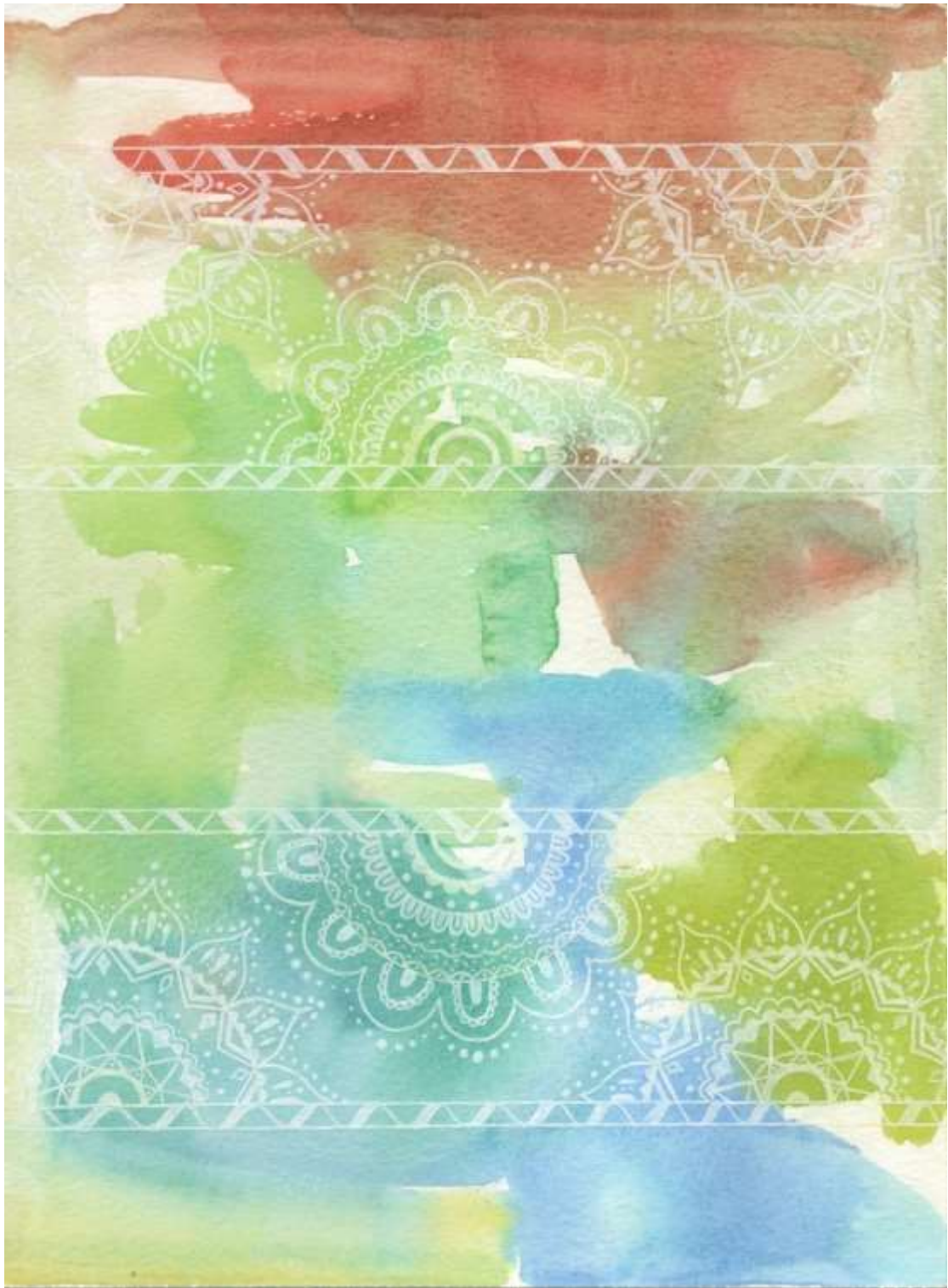
Slika 24: Likovni predložak 9