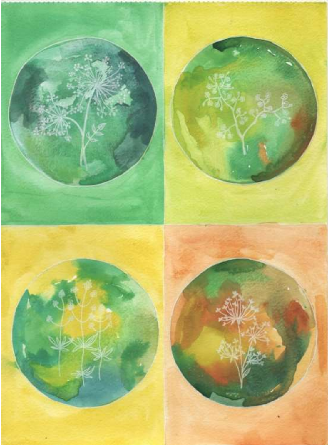
Slika 29: Likovni predložak 14