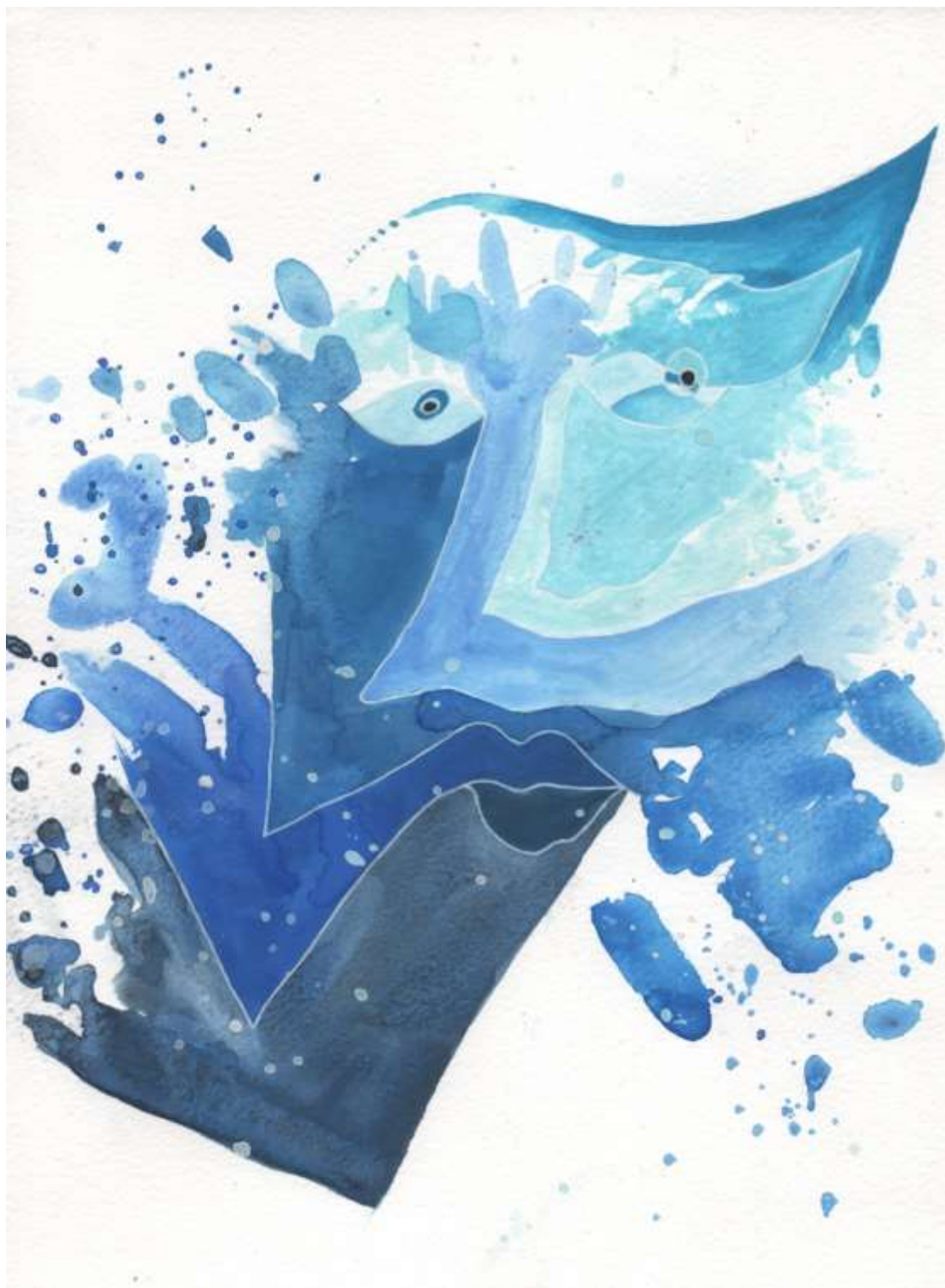
Slika 26: Likovni predložak 11