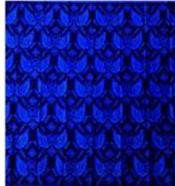
Slika 4: prikaz primjera sundaskog batika