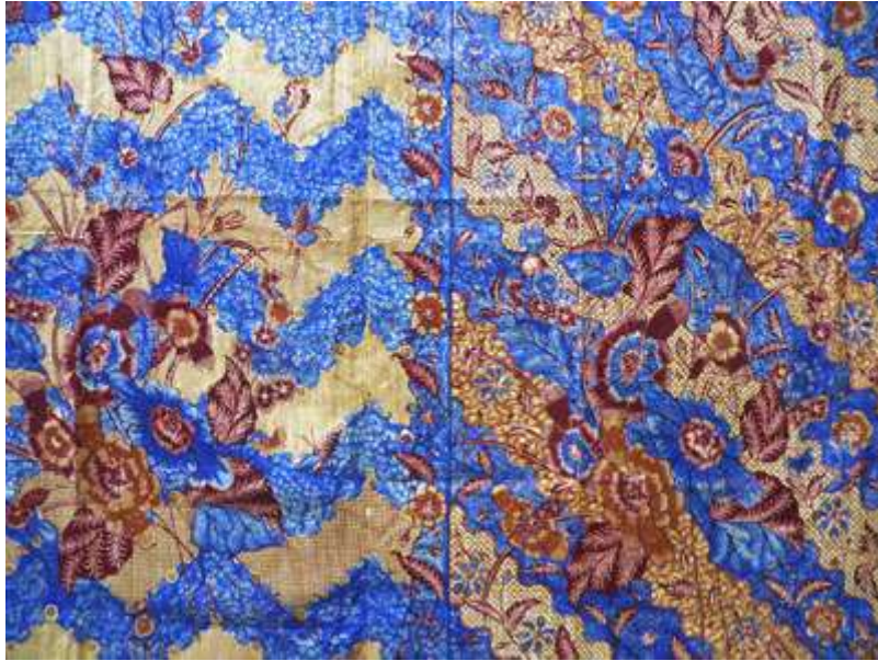
Slika 3: Batik TigaNegri

[ https://commons.wikimedia.org/wiki/File:Batik_Buketan_Pekalongan_Tulis_2.jpg ]