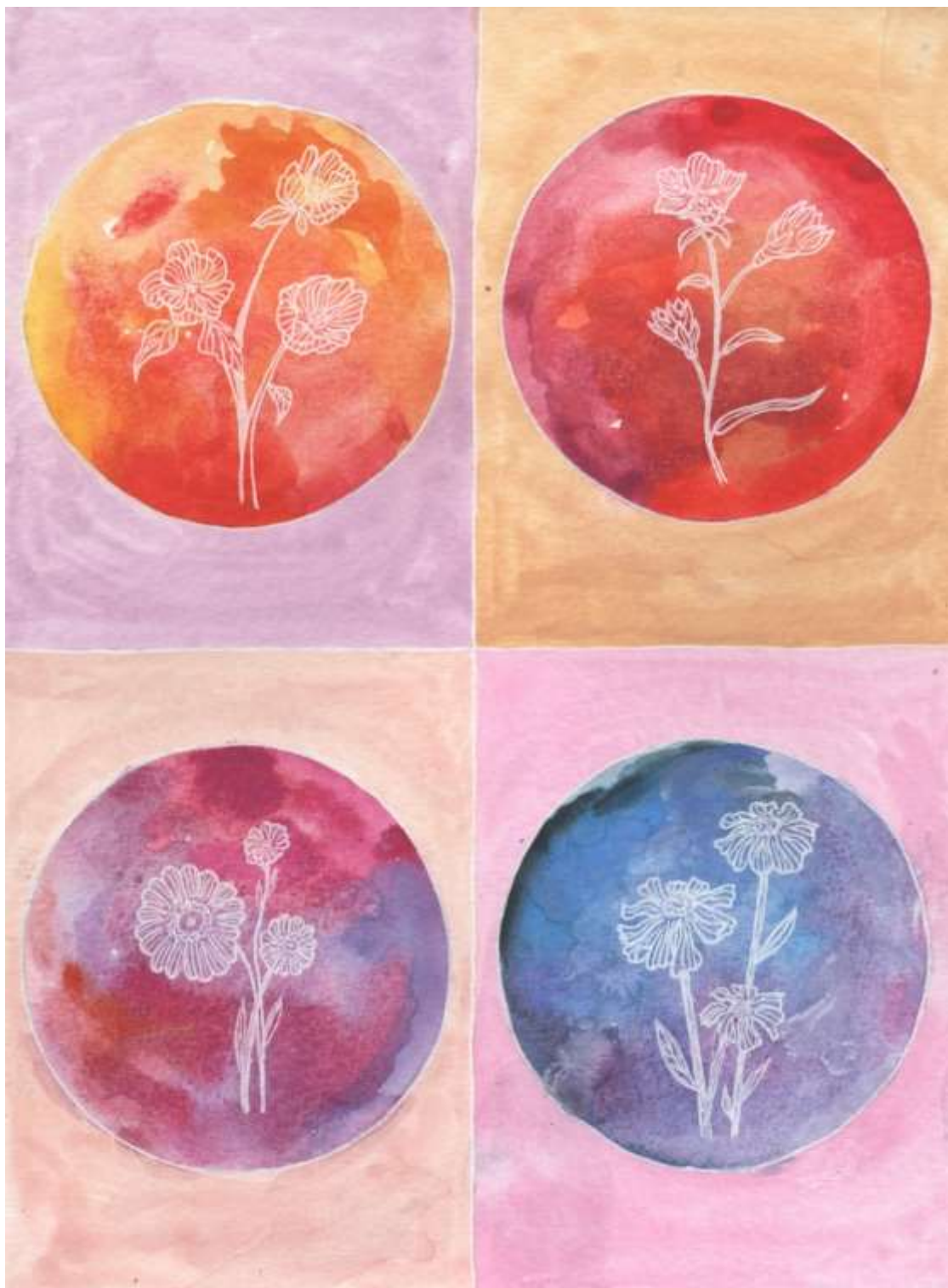
Slika 28: Likovni predložak 13