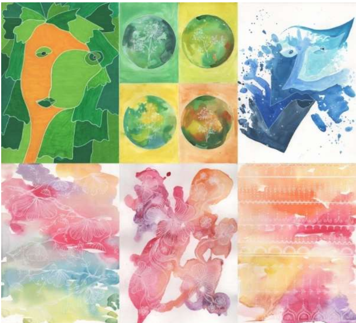
Slika 31: prikaz likovnih predložaka odabranih za realizaciju

Za realizaciju tehnike batika na svili odabrano je šest predložaka, prikazanih na slikama 17, 19, 21, 22, 26 i 29. Po dva iz portretne tematike, tri iz floralne i jedan inspiriran indijom. Uzorci portretne tematike jasni su u koloritu, jedan od njih obojan je nijansama žute i zelene, dok je drugi u tonovima plave. Portreti su defragmentirani, te je svaki dio jasno odvojen bijelom linijom. Kod floralnih uzoraka prisutan je cijeli spektar boja, na jednom od njih uz elemente geometrije, izmjenjuju se nijanse žute i zelene, drugi je u skali od žute do ljubičaste, dok je na trećem prisutna cijela paleta. Uzorak orijentalnih motiva je u spektru od žute do ljubičaste.