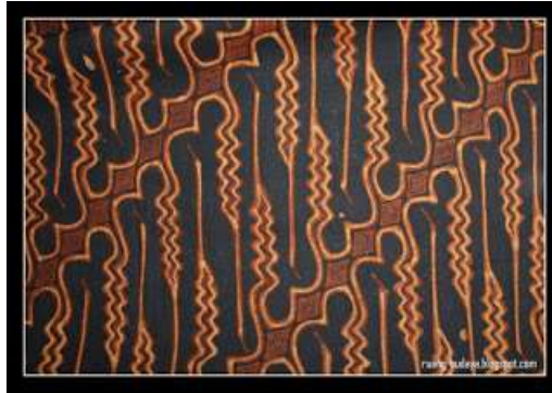
Slika 2: batik Solo

[ http://budayanusantara25.blogspot.hr/p/batik-solo.html ]