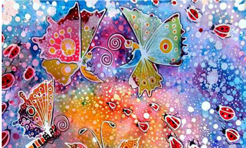
Slika 8: prikaz primjera batika iz Indije

U Indiji je donedavno batik bio korišten samo za haljine i odjeću krojenu po mjeri, ali se danas suvremeni batik primjenjuje na brojnim predmetima kao što su murali, zidne zavjese, slike, pokućstvo i marame. Uključuje živahne i svjetlije uzorke