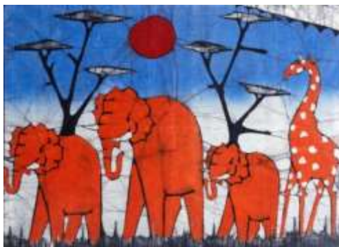
Slika 10: prikaz primjera afričkog batika

U Africi se oslikavanje tehnikom batika razlikuje od ostalih do sada spomenutih tehnika, jer ne koriste vosak. Umjesto voska, koriste pastu od škroba i blata, ovisno o regiji. Batik tehniku u Afriku prenesli su nizozemski trgovci iz Indonezije[2, 3, 4, 5].