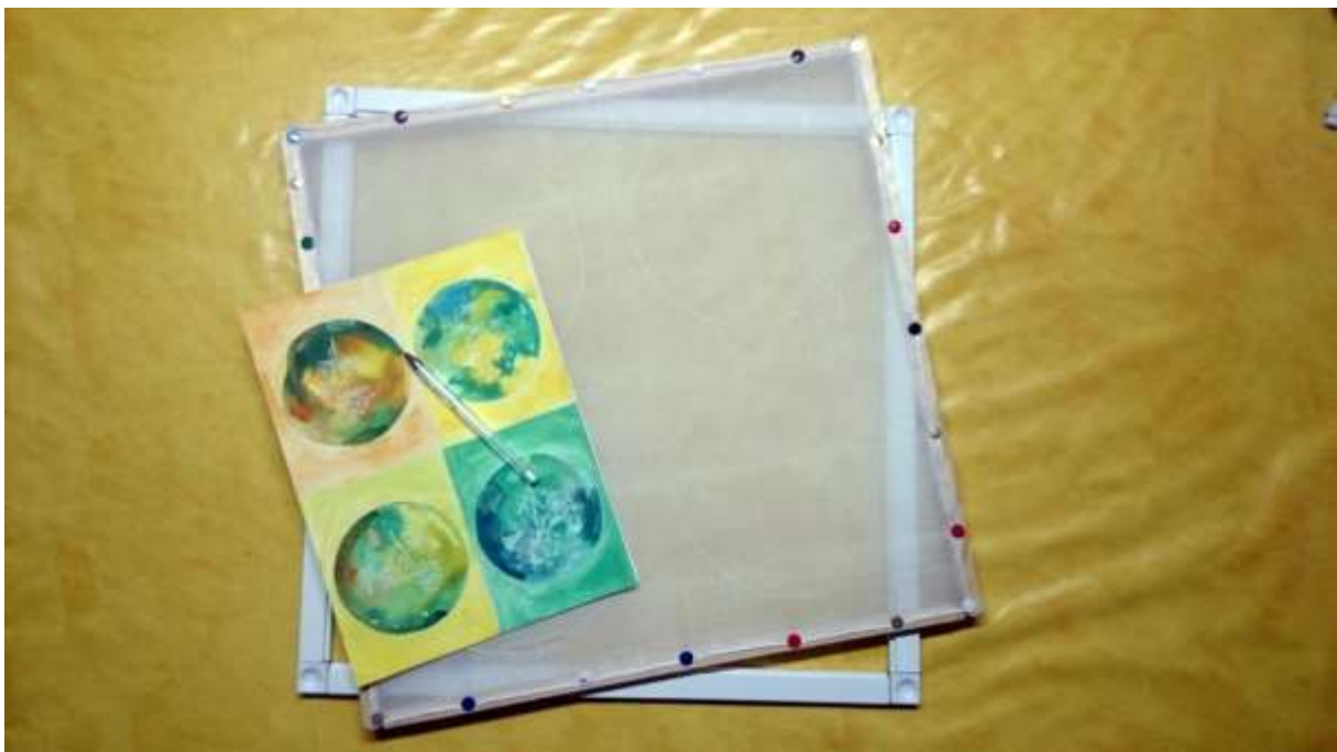
Slika 32: svila pripremljena za iscrtavanje voskom

Kako bi uzorkovanje svile tehnikom batika moglo biti do kraja uspješno provedeno, uz navedeni pribor u poglavlju 2. ( odlomak 2.6. ), potreban je i dodatni pribor koji se sastoji od sredstva za iscrtavanje uzorka prije voska, okvira, pribadača i poluge. Kao sredstvo za iscrtavanje uzorka na svili prije iscrtavanja voskom, odabrana je bijela penkala. S obzirom da su odabrane dvije dimenzije za uzorkovanje, 28 \times 28 \text{ cm} i 45 \times 45 \text{ cm} , bilo je potrebno izraditi i dva okvira identičnih vanjskih dimenzija. Kako se težilo k tome da se izbjegnu rupice na svili koje bi prouzrokovale pribadače uslijed napinjanja svile na okvire, uslijedio je pokušaj izrade okvira od aluminijskih letvica prilagođenih za izradu tzv. komarnika. Nakon trostrukog prekrajanja okvira većih dimenzija, uspješno su izrađena oba okvira tj. komarnika. Napinjanje svile u žljebove letvica i fiksiranje gumenom trakom, ispostavilo se kao dobar pokušaj u inovaciji napinjanja svile prije oslikavanja, no postoje segmenti koje treba doraditi, tj. sofisticirati. Također su izrađeni i drveni okviri, koji su na kraju i korišteni za oslikavanje svile. Bez spomenute poluge, vađenje plosnatih pribadača iz drvenih okvira bilo bi poprilično teško.