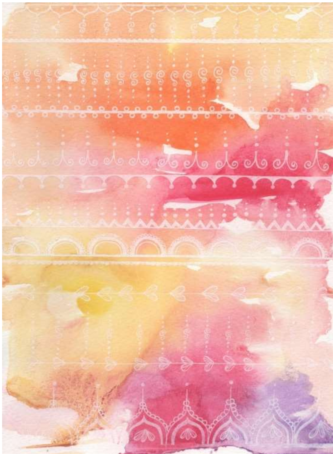
Slika 22: Likovni predložak 7