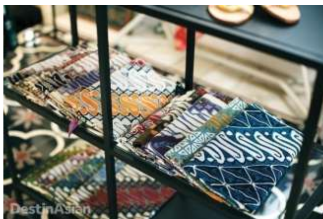
Slika 14: prikaz ručno bojanih batik Purana tkanina

Od tada, njen brend Purana prikupio je odanu klijentelu, od tinejdžerske do zrele dobi. 2015. godine lansira konfekcijsku kolekciju naziva PURANArtw , kojom želi dosegnuti kupce manje platežne moći pristupačnim cijenama, ali pri tome zadržavajući kvalitetu materijala i tradiciju uzorkovanja. Uz to što sama stvara i kreira uzorke i boje, brend Purana sklon je i eksperimentiranju s mješavinama materijala, pa tako koriste tajlandsku svilu, viskozu, ATBM tkaninu, organdi i Tencel[4].