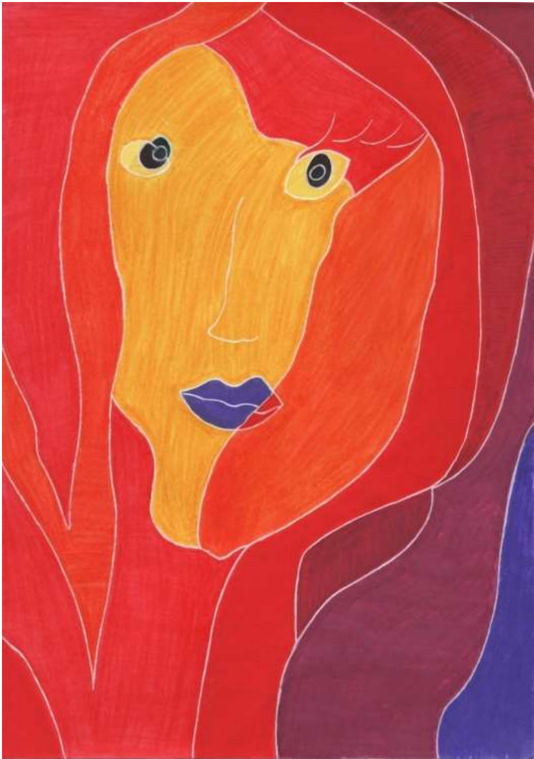
Slika 16: Likovni predložak 1