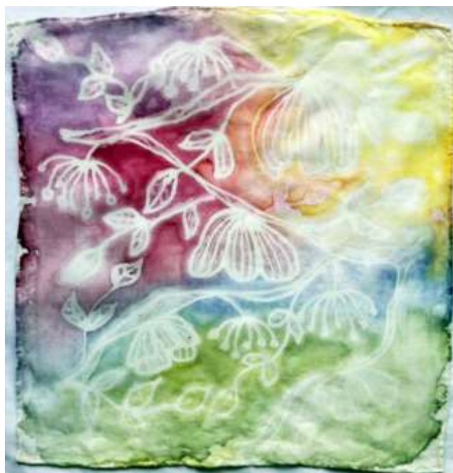
Slika 36: primjerak oslikane svile

Kao posljednji predložak odabran je predložak prikazan na slici 21, na kojem je isto tako dvostruki nanos voska i boje.