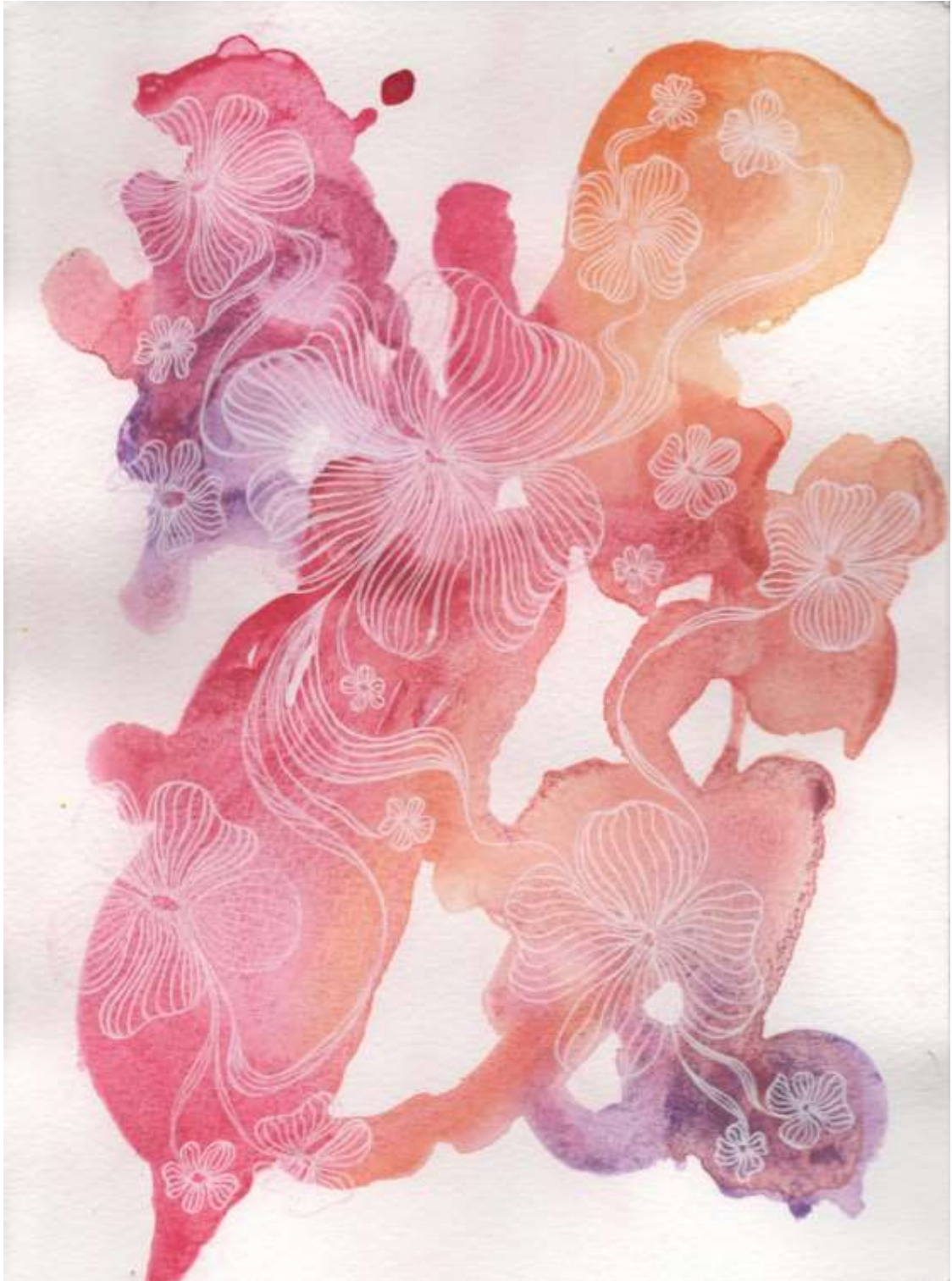
Slika 19: Likovni predložak 4