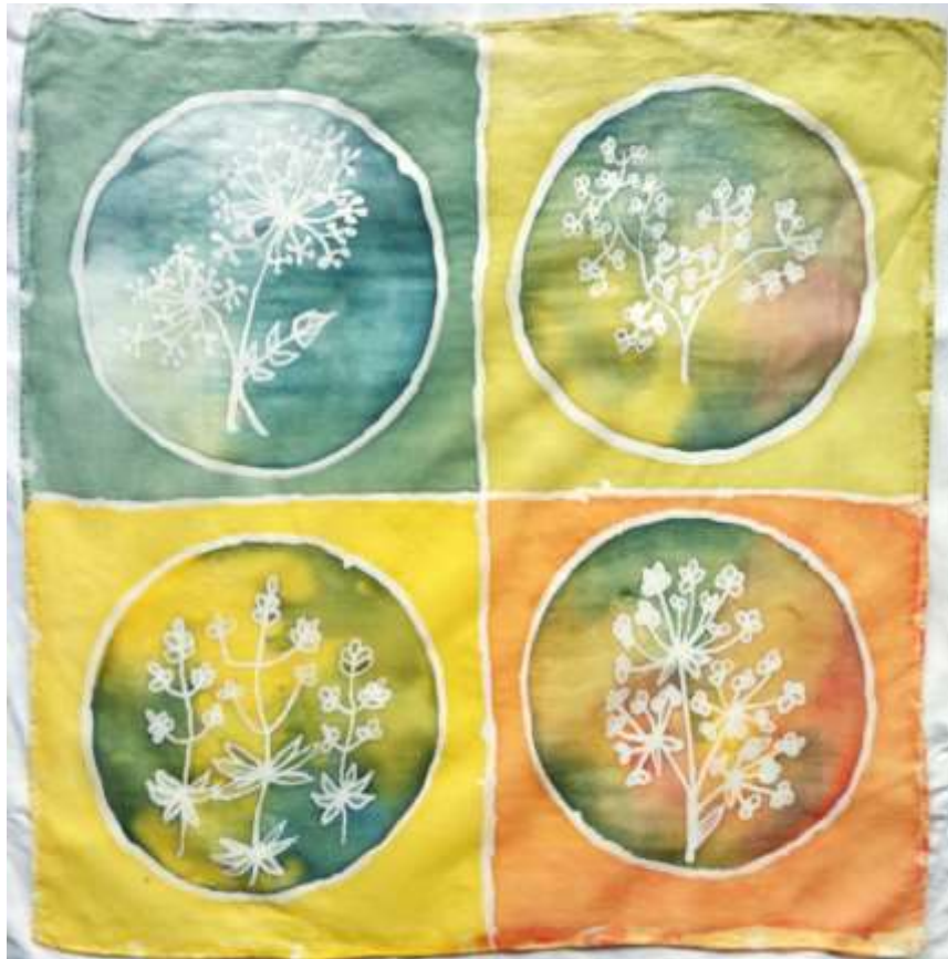
Slika 37: primjerak oslikane svile

Sva tri predloška u procesu uzorkovanja su prilagođena formatu i tehnici iscrtavanja, jer najfinije tanke linije voskom u ovom slučaju je bilo vrlo teško postići. Na svili formata 45x45 cm , najprije je oslikavan uzorak prikazan na slici 29. Nakon što su bijelim linijama, pa zatim voskom iscrtane konture uzorka, najprije su kvadratni dijelovi (bez kružnice) premazani sredstvom protiv razlijevanja boje kako bi se ostvario što ravnomjerniji nanos boje na tim područjima. Zatim su obojene kružnice s floralnim motivima. Nanos voska i boje je dvostruk.