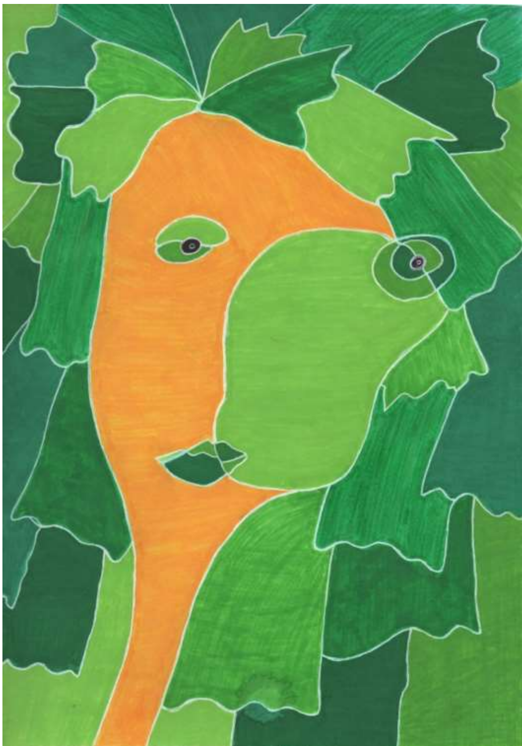
Slika 17: Likovni predložak 2