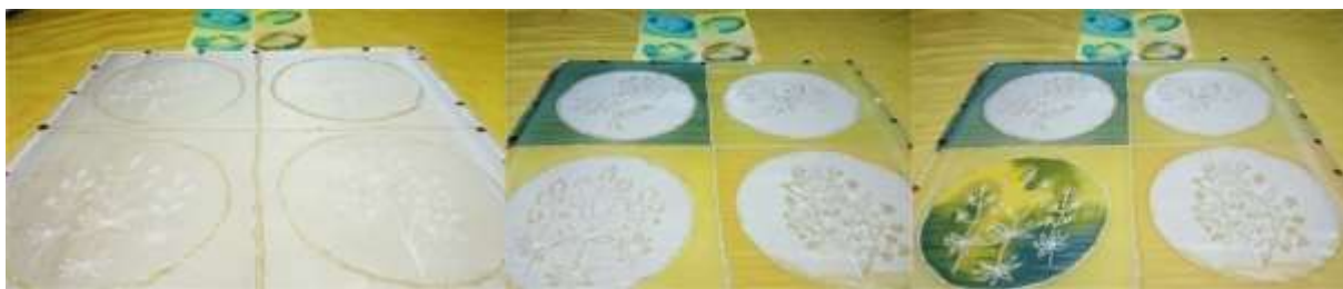
Slika 33: prikaz faza oslikavanja svile