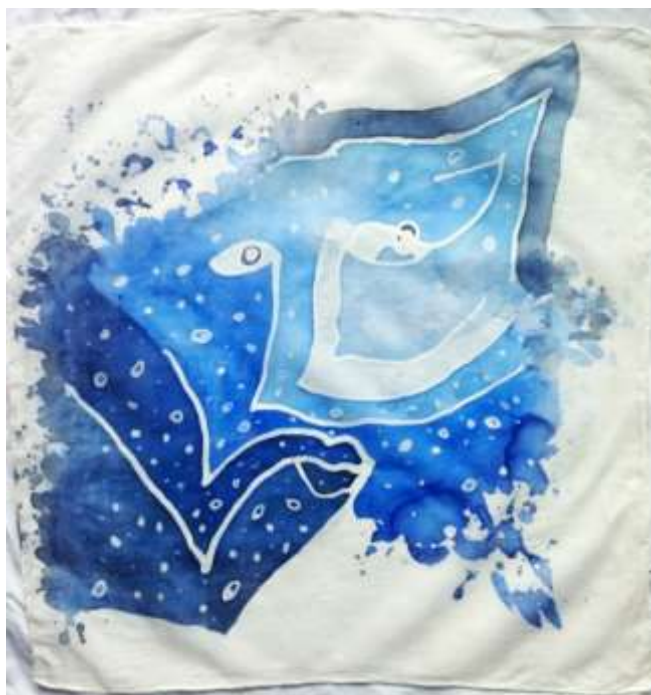
Slika 38: primjerak uzorkovane svile

Kod trećeg uzorka, sredstvo protiv razlijevanja boje nanesen je mjestimično, kako bi zadržao jasne konture. Nakon iscrtavanja voskom, prvi nanos boje se, unatoč sredstvu, ipak razlio po svili. Nakon sušenja ostale su vidljive konture spomenutog sredstva. Zatim je uslijedio još jedan nanos boje, kako bi vidljivost kontura od sredstva protiv razlijevanja bila što manja.