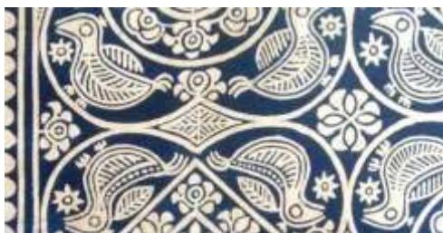
Slika 9: prikaz primjera kineskog batika

[ http://www.maisondexceptions.com/en/china-blue-the-batik-of-miao/ ]