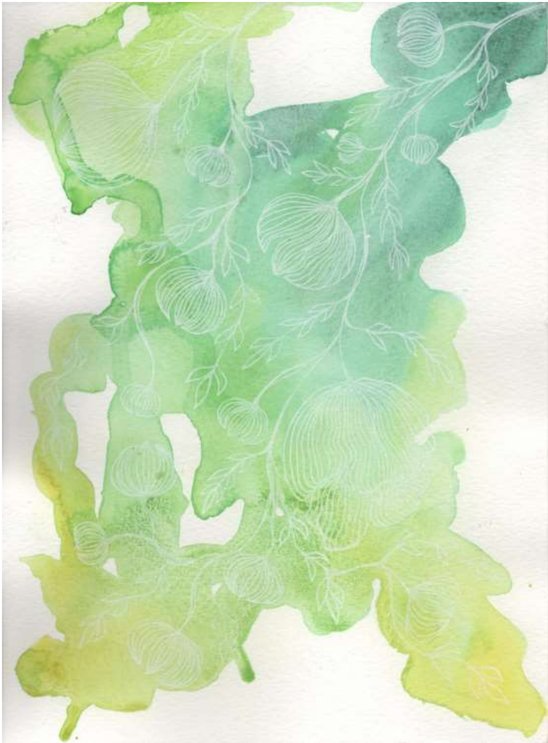
Slika 20: Likovni predložak 5