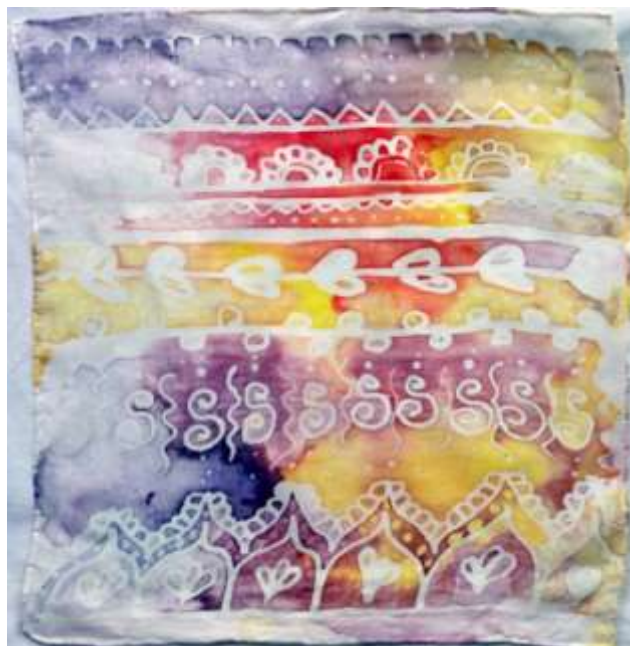
Slika 35: primjerak uzorkovane svile

Drugi uzorak koji je iscrtavan je uzorak orijentalnih motiva prikazan na slici 22, na kojem je dvostruki nanos voska i boje.