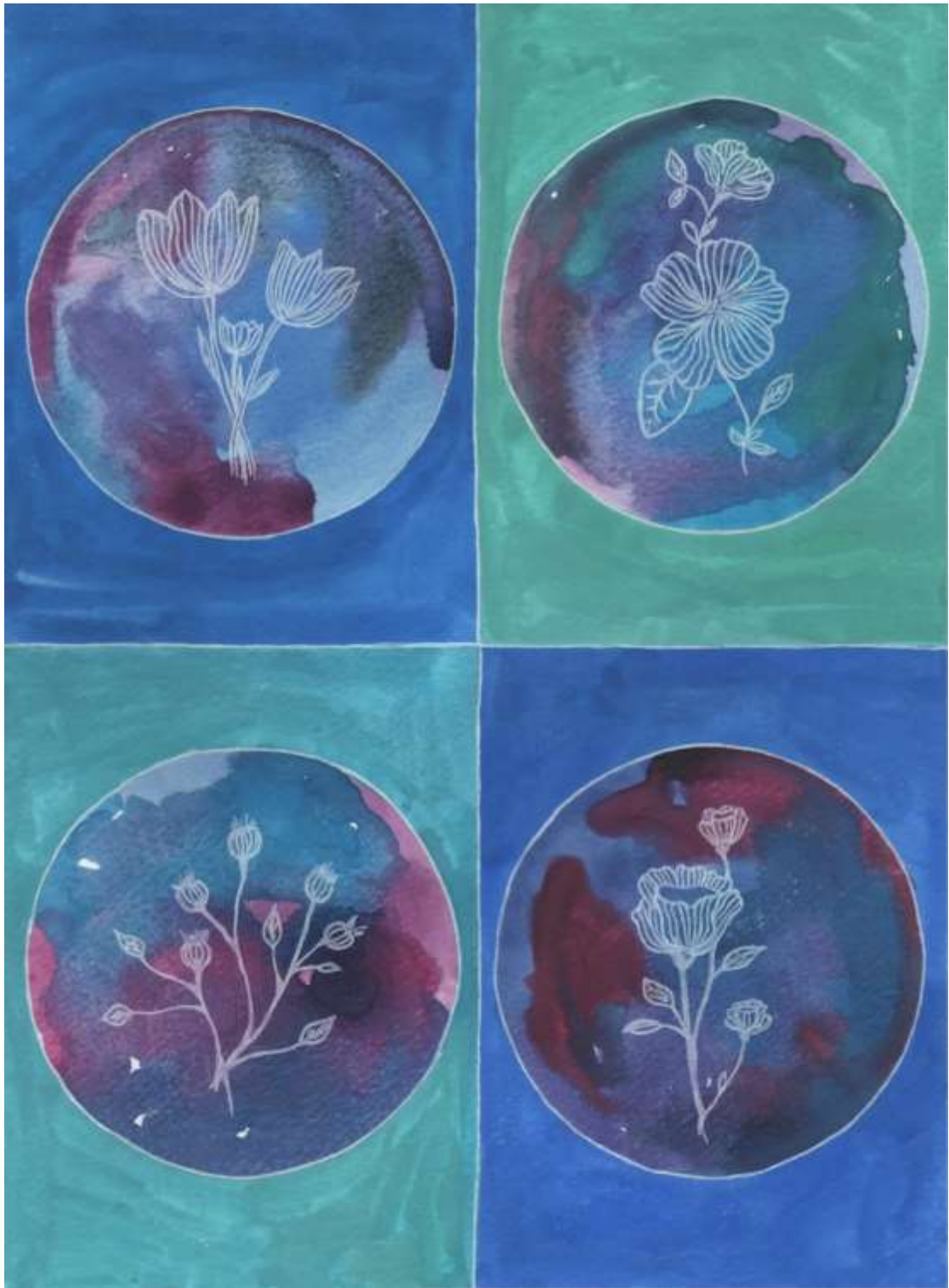
Slika 30: Likovni predložak 15