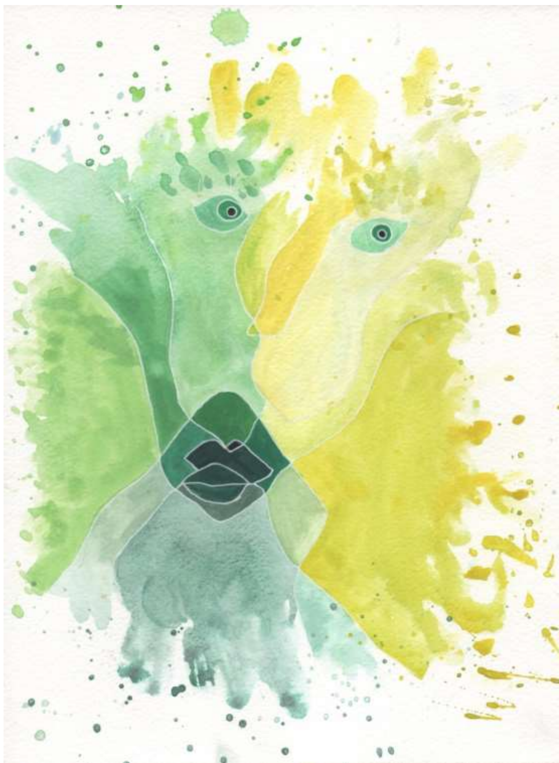
Slika 25: Likovni predložak 10