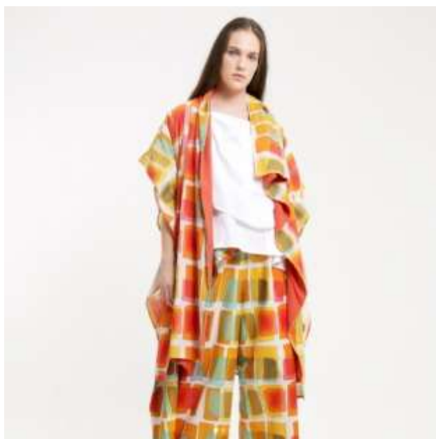
Slika 15: prikaz dijela DotsyBitsy kolekcije, Purana

[ https://www.instagram.com/p/BVm0FD-FE-c/?taken-by=puranaindonesia ]