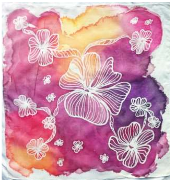
Slika 39: primjerak uzorkovane svile

Kod trećeg uzorka, sredstvo protiv razlijevanja boje nanesen je mjestimično, kako bi zadržao jasne konture. Nakon iscrtavanja voskom, prvi nanos boje se, unatoč sredstvu, ipak razlio po svili. Nakon sušenja ostale su vidljive konture spomenutog sredstva. Zatim je uslijedio još jedan nanos boje, kako bi vidljivost kontura od sredstva protiv razlijevanja bila što manja.