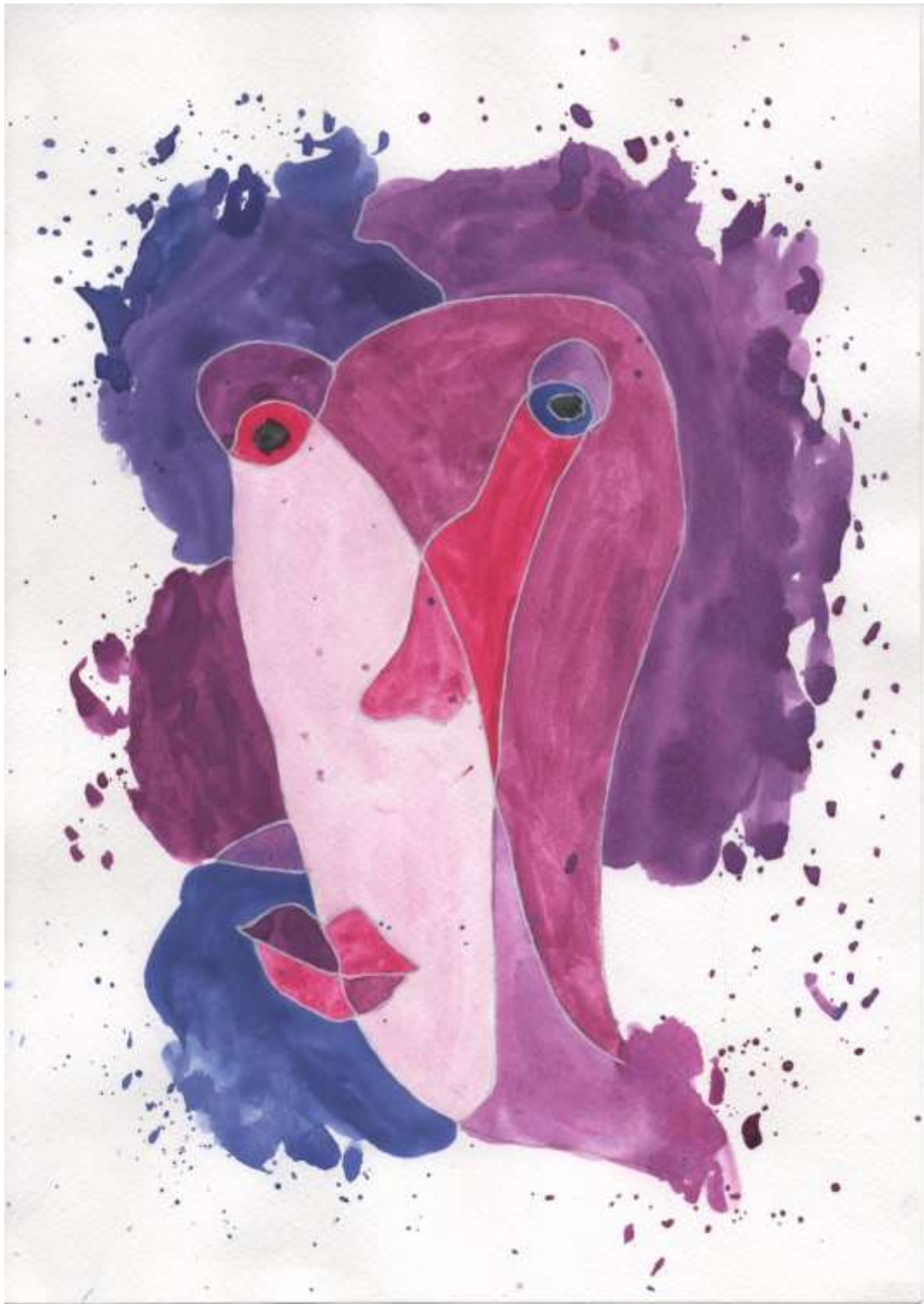
Slika 27: Likovni predložak 12