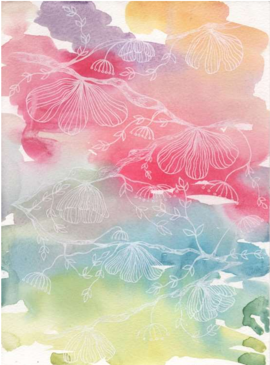
Slika 21: Likovni predložak 6