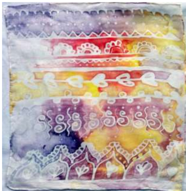
Slika 35: primjerak uzorkovane svile

Drugi uzorak koji je iscrtavan je uzorak orijentalnih motiva prikazan na slici 22, na kojem je dvostruki nanos voska i boje.