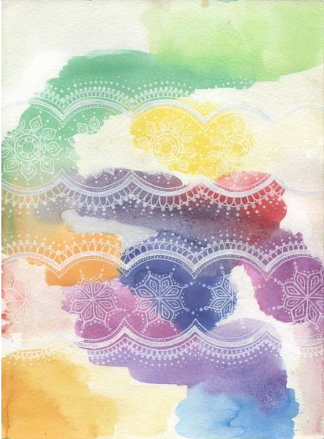
Slika 23: Likovni predložak 8