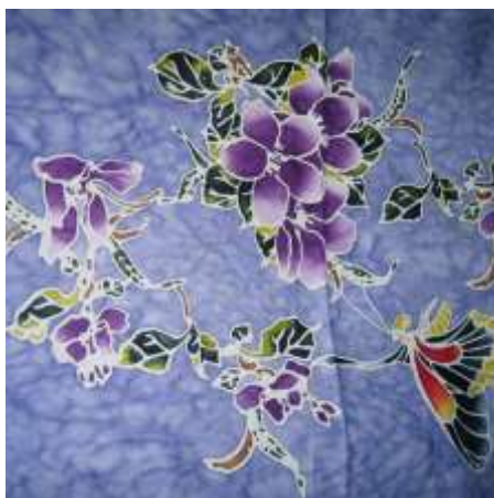
Slika 7: prikaz primjerka batika s Malezije

Batik se u malezijskim analima spominje u 17. stoljeću i povezan je s legendom o Malacca kralju koji je želio da mu se dopremi 140 komada tkanine oslikanih batik tehnikom floralnih motiva iz Indije. Metoda izrade batika na Maleziji razlikuje se od one s Jave i Indonezije općenito. Uzorci su veći i jednostavniji, s tek ponekim detaljnim uzorcima iscrtanim tjantingom . Koriste kistove za nanošenje boje na tkaninu, a boje su svjetlije i puno življe od dubokih i tamnih tonova javanskog batika. Malezijski batik često prikazuje biljne i floralne motive, kako bi se izbjeglo tumačenje ljudskih i životinjskih slika kao idolopoklonstva, u skladu s lokalnim islamskim doktrinama. Međutim, motiv leptira je izuzetak [2, 3, 4, 5].