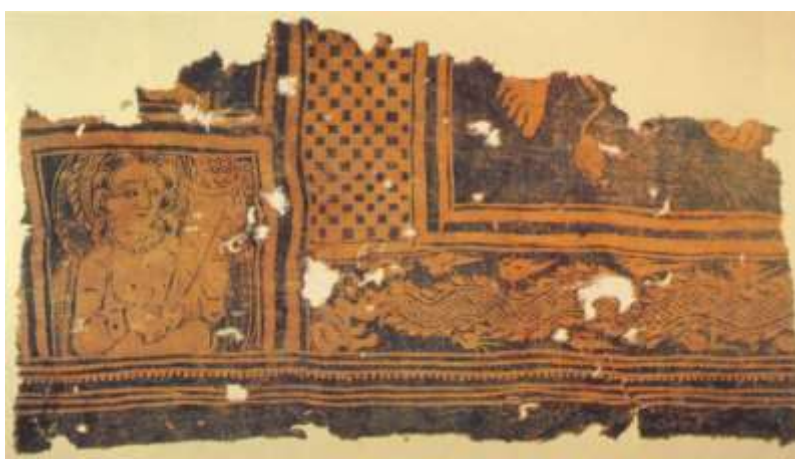
Slika 1: prikaz tkanine oslikane tehnikom batika iz Nyia, Kina

Tehnika batika je drevna tehnika oslikavanja, što nam potvrđuju i nalazi iz drevnog Egipta iz 4. St. Pr. Kr. Lanenu tkaninu oslikanu tehnikom batika (lan je uranjan u vosak, zatim je vosak iglama odstranjen) koristili su za omatanje mumija. Ostali nalazi upućuju na Aziju, točnije na Kinu i doba vladavine dinastije Tang (618 – 907 po. Kr.), a u Indiji i Japanu za vrijeme Nara (645 – 794 po. Kr.). U Africi su se batik tehnikom koristilo pleme Yoruba u Nigeriji, i Soninke i Wolofin u Senegal, no oni su umjesto pčelinjeg voska koristili škrob biljke Cassava ili rižinu pastu [2, 3].