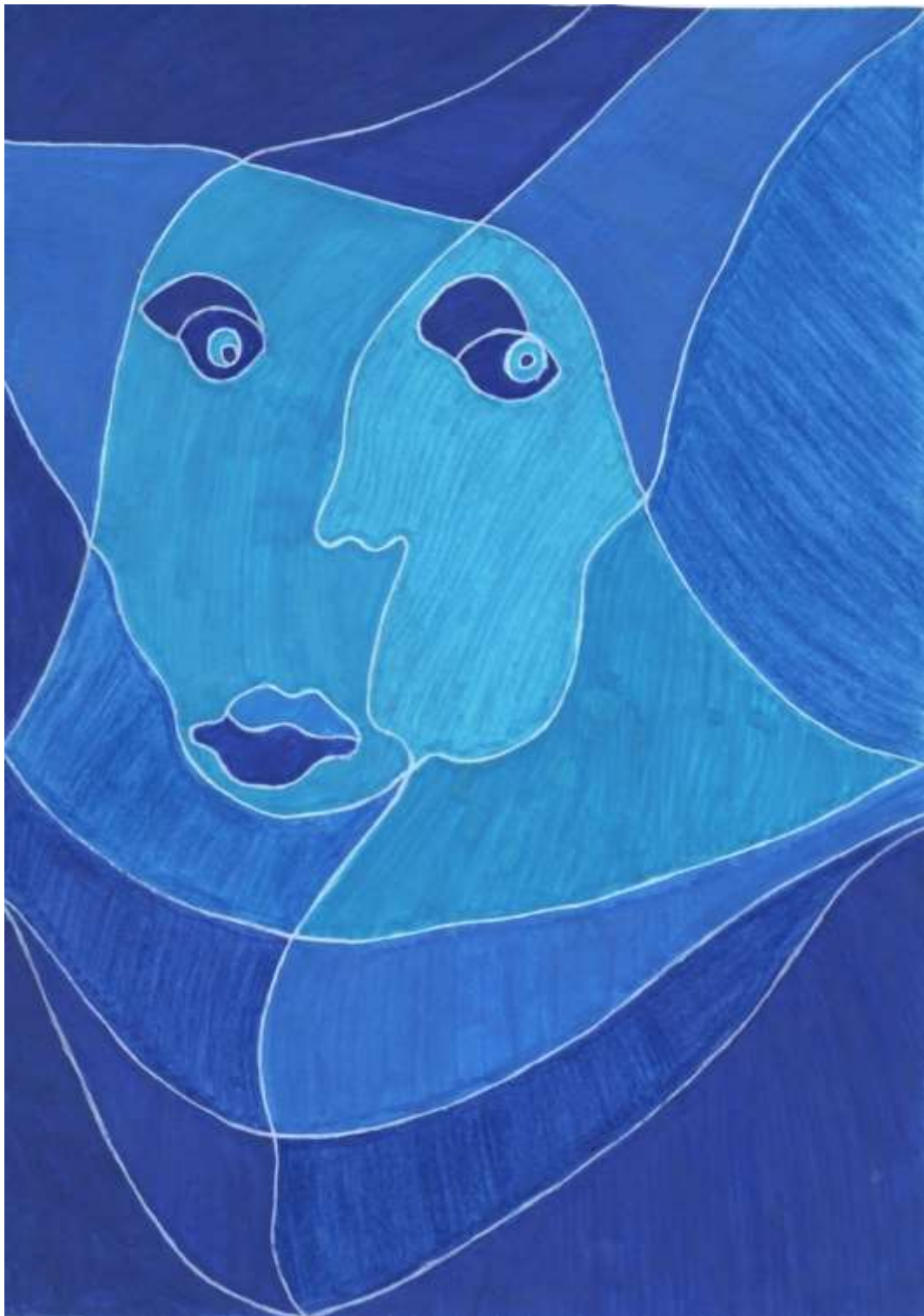
Slika 18: Likovni predložak 3