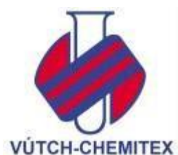
Slika 31 Vútch- Chemitex u Žilini im mnogo aktivnosti

Vútch- Chemitex u Žilini (Slovačka) djeluje na tržištu kao tehnički specijalizirana ustanova već 40 godina. Njihove aktivnosti uključuju istraživanje, razvoj i inovacije tekstilnih materijala sa širokim rasponom aplikacija; istraživanje i razvoj u području tekstilnih završnih i površinskih tretmana tekstilnih i netekstilnih materijala; razvoj i inovacije strojeva i opreme za tekstilnu tehnologiju, tekstilna dorada, testiranje i postrojenja za otpadne vode; ocjenjivanje sukladnosti osobne zaštitne opreme u skladu sa smjernicama Europske unije; ispitivanje obojenja, fizikalno- mehaničkih svojstava i karakteristika tekstilnih materijala, analiza sadržaja kemijskih tvari i/ili dodataka u tekstilnim materijalima i ocjenu njihove zdravstvene ispravnosti; i procjena okolišnih parametara tekstila i kompozitnih materijala, analize industrijskih otpada.