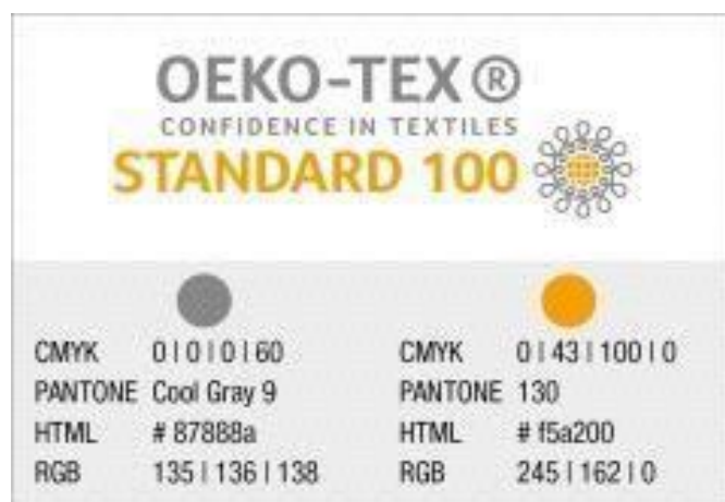
Slika 6 Boje pri dizajniranju oznake [1]

Ako zbog posebnih razloga, oznaka može biti samo u dvije boje, oznaka se smije reproducirati dvobojno uz dodatno odobrenje od ispitivačkog instituta. U slučaju da se ispis se vrši u sivim nijansama sljedeće vrijednosti moraju se koristiti: