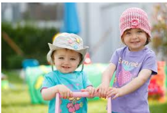
Slika 1 Tekstil za bebe i djecu do treće godine

Tekstil i igračke od tekstila za bebe i djecu do 3 godine starosti npr. donje rublje, kombinezoni, posteljina, mekane igračke i sl.