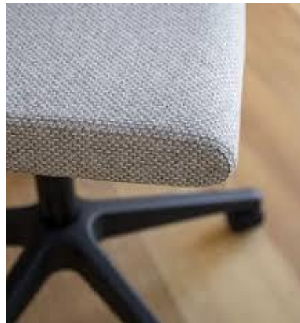
Slika 4 Tekstil za dekorativne svrhe

Materijali za pokrivanje u dekorativne svrhe poput stolnjaka, zavjesa, ali i tekstilne zidne i podne obloge (tapete, tepisi itd.).