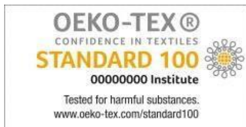
Slika 5 OEKO-TEX® etiketa [1]

Pri dizajniranju oznake moraju se koristiti sljedeće boje: