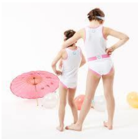
Slika 2 Tekstilna površina u dodiru s kožom

Tekstil čija je površina, kada se koristi kako je zamišljeno, većim dijelom u dodiru sa kožom npr. donje rublje, posteljina, košulje, bluže, frotir (ručnici) i sl.