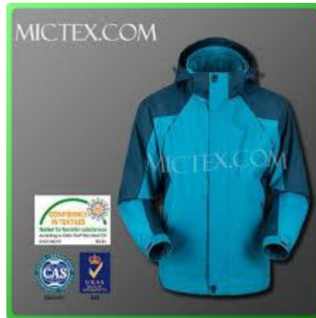
Slika 3 Mali dio tekstilne površine u dodiru s kožom

Tekstili, čija je površina, kada se koriste kako je zamišljeno, malim dijelom njihove površine u direktnom dodiru s kožom npr. jakne, kaputi i sl.