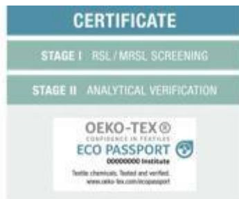
Slika 11 Certifikat Eco passporta [1]

Proizvodi koji prolaze zahtjeve oba procesa dobivaju Eco Passport certifikaciju te se unose u Oeko-TEX vodič za kupnju koji je središnji izvor prethodno ovjerenih predmeta i materijala.