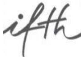
Slika 21 Logo Francuskog IFTH-a

marketinški odraz, obuka, podrška, dizajn proizvoda, označavanje i certifikacija, karakterizacija, tehničko savjetovanje, izrada prototipova, poboljšanje performansa proizvoda. 180 ljudi sa jedinstvenim uvjerenjem: održivi tekstil za sutra.