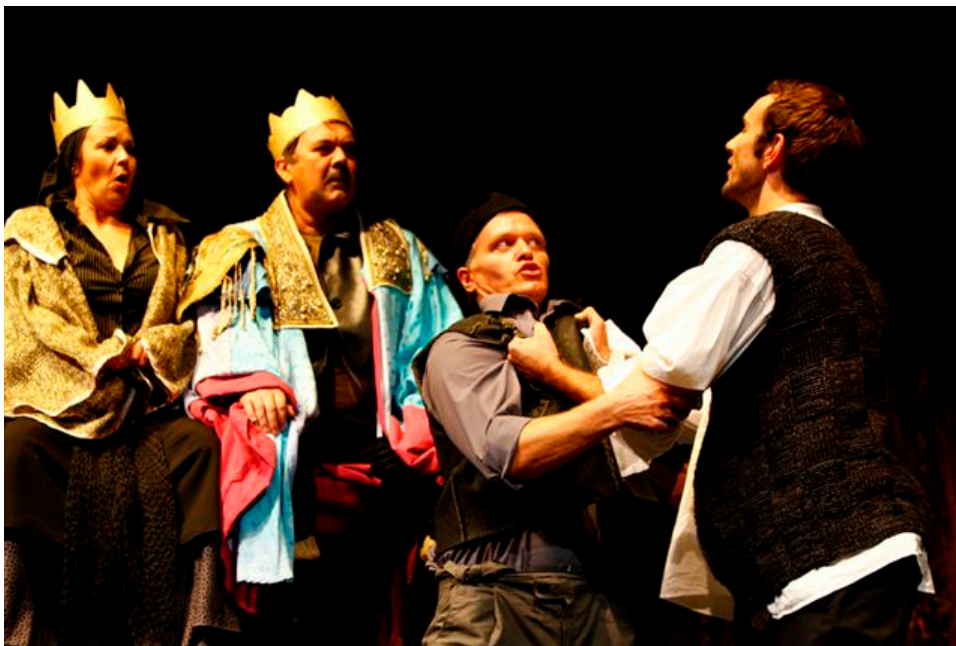
Slika 24. Prizor iz predstave, Kralj, Kraljica gledaju Jocu i Mačka kako se tuku