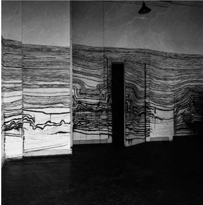
Slika 4. "Hamburška linija" , 1959.