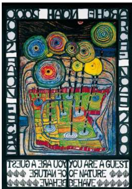
Slika 5. Hundertwasser plakati: "Noina arka 2000 - ti si gost prirode, ponašaj se tako" , 1980.