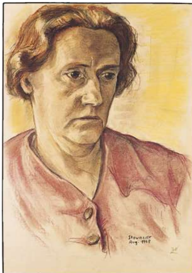
Slika 1., F. Hundertwasser , Portret moje majke , 62x43 cm , Beč , 1948.

i uljem. "Hamburška linija" bila je jedan od glavnih pokazatelja Hundertwasserovog stajališta u društvu, gdje se kritizira obrazovanje kao takvo, stanje umjetnosti i arhitekture. Tu vidimo da kroz studente širi svoj prezir koji ima prema ravnim linijama. Iskazuje svoje neotuđivo pravo na apsolutnu slobodu poetičkog izražavanja.