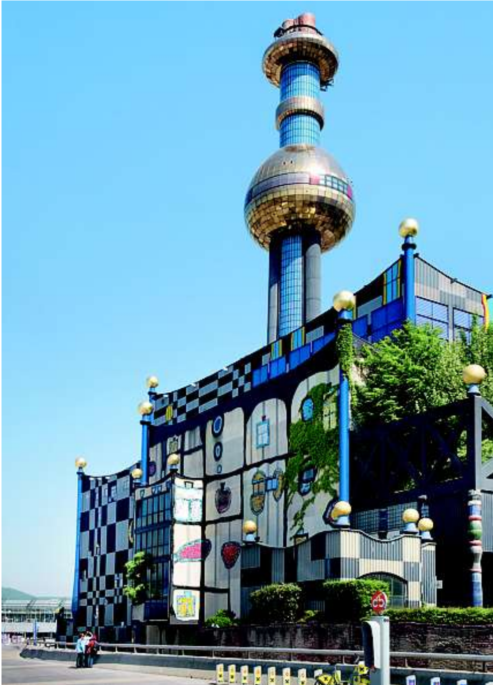
Slika 7. , F. Hundertwasser , Spittelau, Gradska toplana, Beč , 1988.-92.