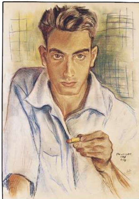
Slika 2. , autoportret, pastel na papiru 62x 43 cm, Beč , 1948.

Slikarstvo je Hundertwasserov početak, to je nešto što se pojavljuje na početku njegovog života. Iz toga se on razvija kao umjetnik i kao ime. Slikarstvo je kao neko njegovo prvo i originalno lice. Lako možemo uočiti njegov napredak i promjene. Kako se oko njega mijenjala okolina tako se mijenjao i on (slika 2.). Njegov odnos prema slikarstvu bio je sličan odnosu prema nekoj religiji, te se zbog toga prema tome i odnosio kao prema nečemu uzvišenom. Svoje je radove spremao i uvijek nosio posvuda sa sobom, baš kao što neki ljudi nose vjerska obilježja. Tada počinje i razdoblje preziranja ravne linije koju smo već prije spominjali. Te njegova poznata spirala koju prvi put stavlja na papir i tu ona postaje glavni motiv i Hundertwasserov središnji element. Pojavljuje se kao slikar 1950 - te godine u vrijeme kada Beč prati avangardu koja je bila pod utjecajem tašizma u kojemu se Hundertwasser ne može pronaći. On to smatra kao čisti psihološki automatizam. Iako se ne može oduprijeti automatizmu i dalje se ne pronalazi u njemu, stoga daje odgovor na svoje protivljenje, a to je transautomatizam.