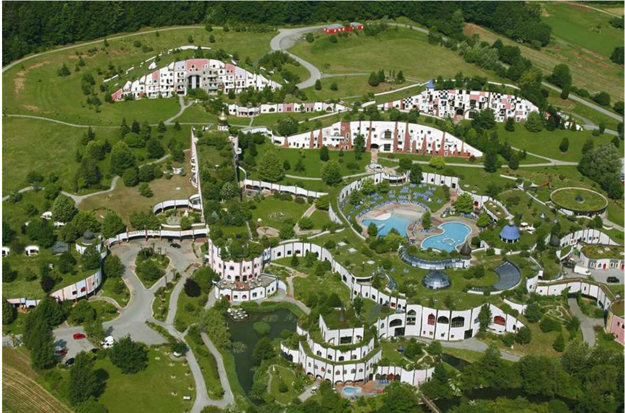
Slika 9. , Gorje Rolling, naselje toplica, Blumau, Štajerska , 1990.-97.