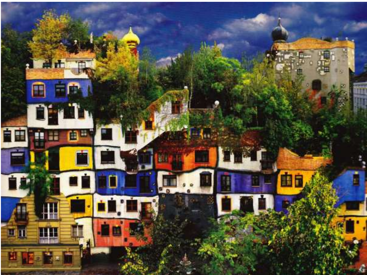
Slika 8. , F.Hundertwasser, Hundertwasserhaus , Beč , 1990.-91.

Gradska skupština bez obzira na izmjenjivanje gradonačelnika želi nastaviti suradnju sa Hundertwasserom. Jedan od tih primjera je i Hundertwasserhaus ( slika 8.), stambena zgrada koja je uređena po umjetnikovim principima, jarke boje, različiti prozori te zeleni krovovi. Hundertwasserhaus je primjer koji nam pokazuje da je simbioza između prirode i stanara zgrade moguća. Stanari prihvaćaju Hundertwasserova stajališta i odlučuju ići ruku pod ruku sa prirodom. To je jedan od najpoznatijih primjera koje možemo pronaći od njegovih arhitektonskih dijela kraj spalionice smeća. Slijedeći primjer koji možemo pronaći u Beču je KunsthausWien .