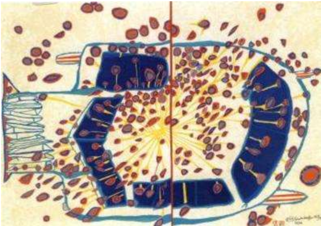
Slika 3. F. Hundertwasser ,automobil sa crvenim kapima kiše, 65x85 cm, Beč ,1953.

Transautomatizam je Hundertwasserova teorija koja se suprotstavlja tadašnjem automatizmu. Ona se pojavljuje kao kritika na sve teorije do tada, te kao takva ne biva prihvaćena od strane društva. Razlog tome je što tvrde da se u njoj radi o nepismenosti u percepciji i afirmaciji potrebe uplitanja javnosti u umjetnost. Prvi primjeri transautomatizma i njegovog individualnog gledanja na umjetnost dolaze još od Marcela Duchampa i njegovog stajališta da je umjetnost u oku promatrača. U ovom slučaju oko promatrača nije oko posjetioca nego umjetnika kao pojedinca. Činjenica koliko će djelo biti cijenjeno i dalje je u oku promatrača. Njegove slike su bile spore i vegetativne te su rasle sa vremenom. Krile su mnoštvo kodiranih poruka, formi i formula. ( slika 3. )