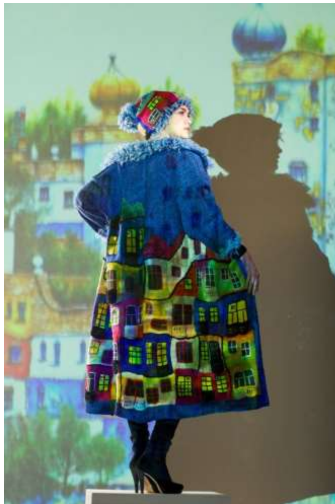
Slika 12. , Plavi Hundertwasserov štrikani mantil

Osobno smatram da bez obzira na pažnju i poštovanje koje uživa Hundertwasser to nije dovoljno. On zaslužuje puno više. Za primjer moramo spomenuti njegovu samostalnu izradu odjeće. Njegov stil je jedinstven i kao takav teško ga je kopirati bez da smo spremni prihvatiti kritike koje on sa sobom donosi. Te kritike bi trebale biti pokretač za mlade dizajnere kao što sam ja, jer on je bio zadovoljan svojim ja i nije mario toliko što drugi misle o njemu. Imao je sam svoj stil i znao ga je nositi. Na primjer njegove zgužvane košulje. Tko bi danas nosio zgužvanu košulju? Nitko, iako su svi svjesni da se košulja zgužva u sekundi. Tu opet pronalazim inspiraciju za kolekciju. Malo povećana košulja, dužih rukava, duboko plave boje, zgužvana. Zašto ne? Moda je tu da bi se njome poigrali, baš kao djeca koju u nama budi Hundertwasser svojim likovima.