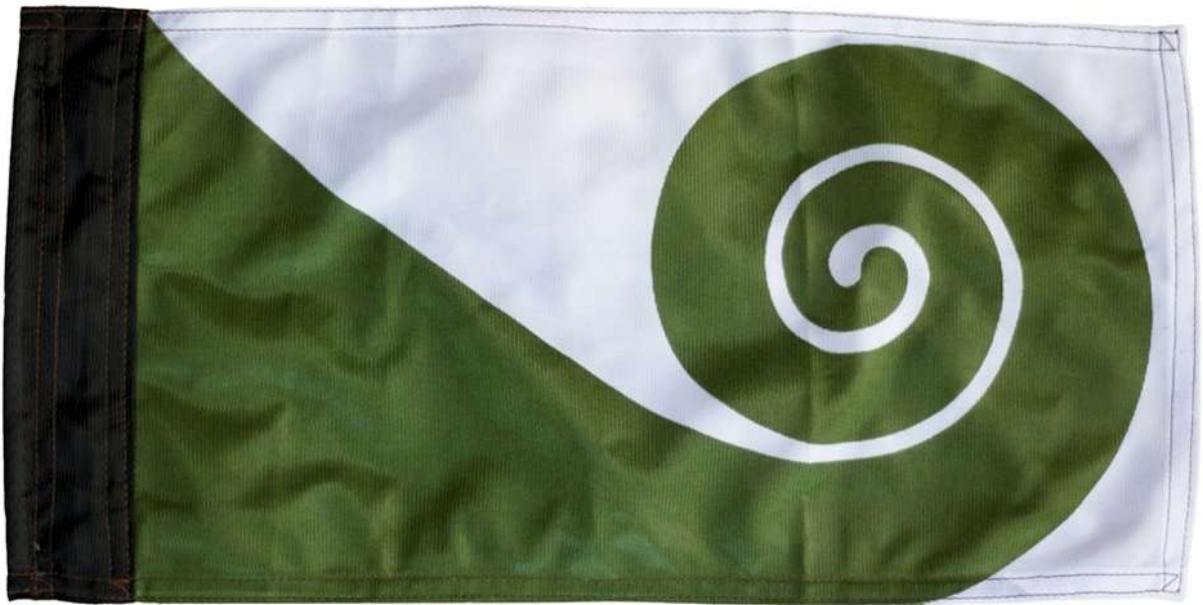
Slika 11., zastava Koru za Novi Zeland , 1983.