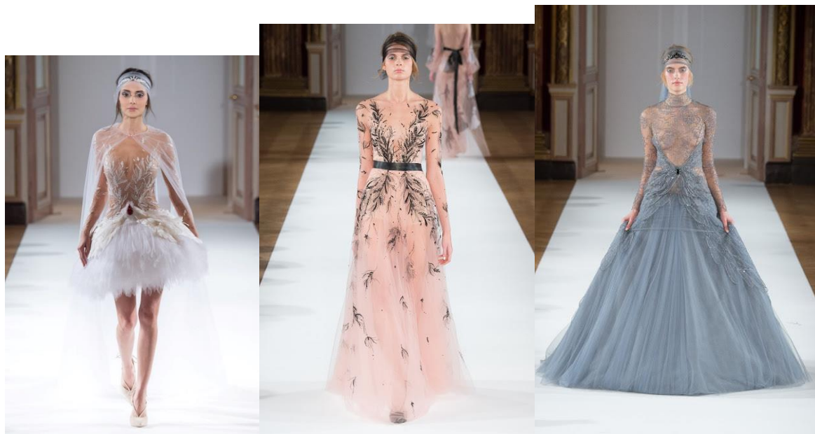
(sl.25,26,27) Y. Yanina, Rusija, proljeće/ljeto 2016.

(Internet izvor; https://zaychishkastyle.com/2016/02/26/yulia-yanina-ss2016/ )