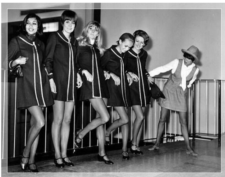
Sl. 11. Prikaz „Epidemije“ mini suknje.