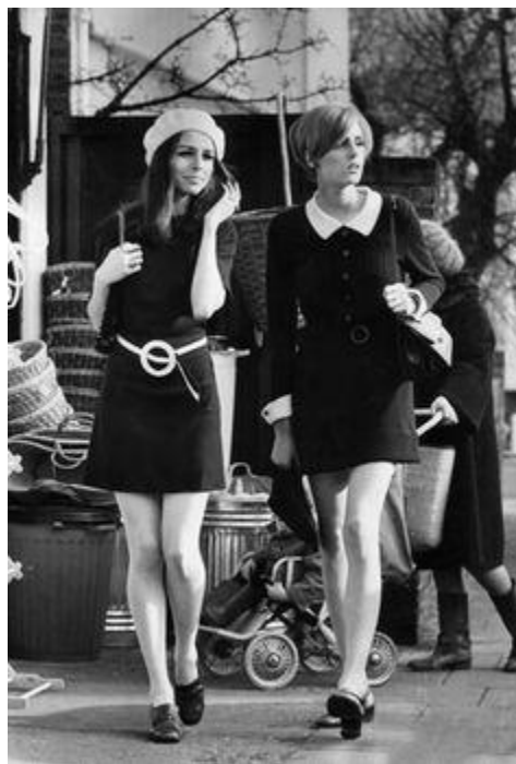
Sl. 1. " poljuljane" londonske ulice novim modnim trendom, 1967. godina

Tih godina došlo je do oslobođenja žena, pa je tako i moda postala slobodnija. Došlo je do pojave „mini“ suknje koju su prvotno nosile hrabrije žene, no potom su ih pomno slijedile ostale pripadnice nježnijeg spola. Za pojavu mini suknje i „vrućih“ hlačica zaslužno je veliko ime modne scene šezdesetih godina, a to je dakako Mary Quant. Mary Quant je britanska dizajnerica koju su modni kritičari proglasili inovatoricom u rangu Coco Chanel i Christiana Diora.