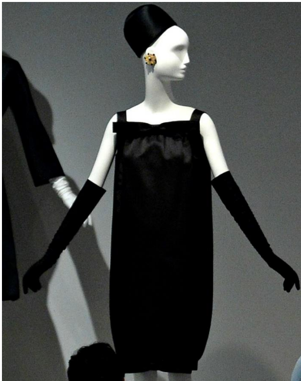
Sl. 6. Givenchy: „vrećasta haljina“

Sa samo 24 godine otvorio je vlastitu modnu kuću, te ubrzo doživio veliki uspjeh. Ubrzo je našao svoju muzu, koja je obilježila njegov život, kako privatno tako i poslovno- Audrey Hepburn. Audrey je mlada glumica, upoznala je dizajnera na probi kostima za film „Sabrina“ koji je sam Hubert dizajnirao. Kasnije, Audrey je postala ambasadorica njegove modne kuće, te je nosila kreacije na filmu i privatno. U istom razdoblju upoznao je i novog mentora Balenciagu, Španjolskog dizajnera koji ga je poticao da istražuje svoju kreativnost. Nedugo prije početka 60-tih, Givenchy je predstavio takozvanu „vrećastu“ haljinu, široki model, bez naglašenog struka, koji je žene oslobodio iz „okova“ strukiranih i vrlo neudobnih haljina.