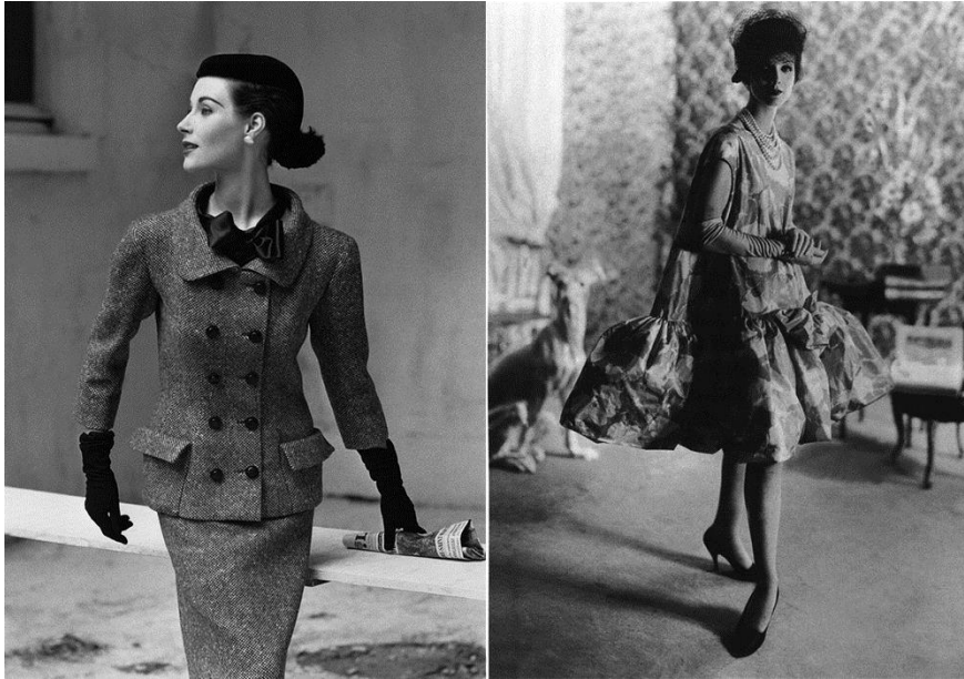
Sl.8. Balenciaga: „Ozbiljnost modela, savršen kroj“