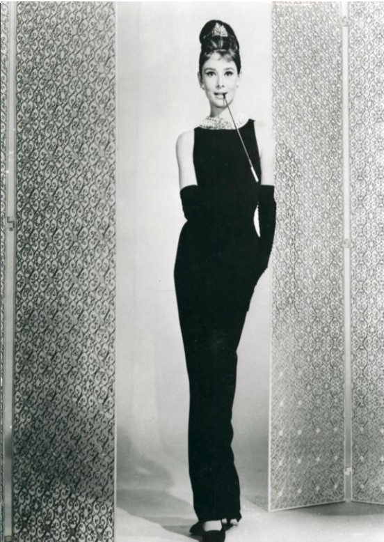
Sl. 7. Givenchy: „Audrey Hepburn u legendarnoj crnoj haljini“