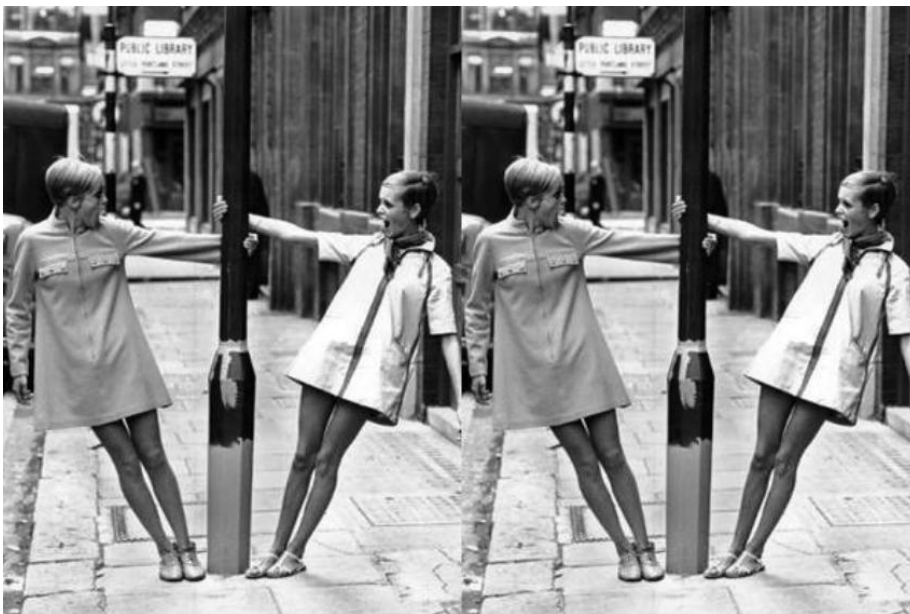
Sl. 2. twiggy micro-mini haljina, po svojoj figuri je popularizirala ovaj izgled.

Sa samo 16 godina postala je jedno od najpoznatijih lica tih godina. Mogli bismo reći da je prvi pravi teenage model u povijesti modne industrije. Njezina karijera je išla paralelno s onom „majke minica“ dizajnerice Mary Quant, pa su jedna drugoj bile inspiracija i promotorica, izazvavši pravu revoluciju u svijetu mode.