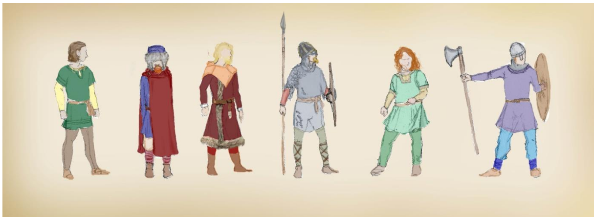
Slika 6: primjeri muškog odijevanja nordijskih plemena

Viking. Igle koje su koristili za pridržavanje varirale su od jednostavnih izrađenih od kostiju i drva do ornamentiranih zlatnih. Jedan od češćih oblika broševa je bio penannularni 84 broš koji je obilato ukrašavan. Obuća im je bila kožne cipele ili čizme. Muškarci su nosili remenje ili su komadom užeta vezali tunike u visini struka. Remenje vikinške ere je bilo kožno i puno uže od remenja koji nastaju kasnije, pronađene kopče indiciraju kako su najširi remeni bili 2 cm. Kopče, metalni završetak remena i sam remen se dekorirao. Na remenu se mogao nositi nož, neko drugo manje oružje ili torba zbog nepostojećih džepova, u torbi su se mogli naći predmeti poput češlja, čistača noktiju, komada tkanine za brisanje ruku, srebrnih kovanica i razni komadi korišteni za igre.