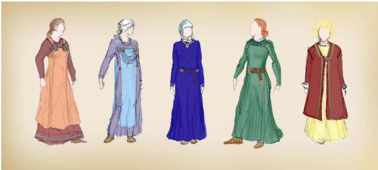
Slika 5: primjeri ženskog odijevanja nordijskih plemena

zlata. U toj škrinji je bio nož. Već spomuta škrinja može biti komad nakita koje arheolozi zovu konkavni broš. Konkavni broševi su pronađeni u različitim dijelovima Europe gdje su se Vikinzi nastanili, uključujući Englesku, Irsku, Rusiju i Island. Ti pronalasci ukazuju kako je moguća prisutnost vikinških žena na ekspedicijama. 72 Istraživanje pokazuje kako su danske žene u to doba preferirale jednostavne donje haljine dok su Šveđanke nosile karirane. Također se govori kako je donja haljina bila nabrana u vratu i takav ovratnik se pričvršćivao brošem. Žene koje su prve došle za svojim muškarcima u Englesku nosile su naizgled plisirane, najvjerojatnije gusto nabrane lanene donje haljine kratkih rukava.