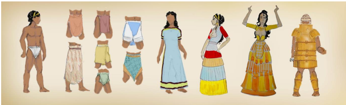
Slika 1: primjeri odijevanja mikenske i minojske kulture

grudi s velikim ukrasnim vezanjem na leđima dok kraj ukrašen resama visi do struka. 22 Suknja je stožastog oblika načinjena ili od mnogostrukih nabranih komada tkanine ili od jednog komada. Freske prikazuju kako su se nabrani komadi tkanine našivali na temeljnu suknju, od tri komada do sedam ili devet svaka tkanina seže upravo toliko kako bi sakrila šav one ispod. Suknje su bojane i ukrašene raznolikim geometrijskim ornamentima uzorka koji se ponavlja. Preko suknje se nosio komad tkanine elipsoidnog oblika a dulji krajevi tkanine padaju naprijed i straga poput pregače, on je također bogato ukrašen. U iznimno uskom struku suknju pridržava ili preko jakne nadodaje kao ukras deblji široki pojas koji skriva spoj ovih odjevnih predmeta. Na glavi se nosi visoki šešir ili turban, šešir je naizgled konstruiran od komada okrugle ili ovalne tkanine koji se stezao po želji nositeljice stvarajući oblik koji joj najviše odgovara. Korištenje fibula ili igala nije vidljivo na niti jednom prikazu, na kipićima zmijske božice i njene svećenice pronađene u Knosu vidljivo je vezanje jakne sprijeda trakama ali nikakve druge indikacije spajanja tkanina nije vidljiva. Oblik odjevnih predmeta se izgledao dobivao krojenjem i sposobnim šivanjem.