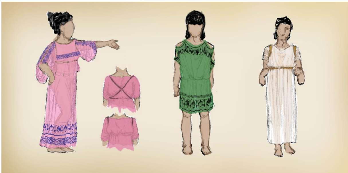
Slika 3: primjeri jonskog stila odijevanja

Teško je razlučiti u ženskom odijevanju, osim postojanjem rukava, točnu crtu razlike između dorskog i jonskog stila. Prikazi žena s hitonom pune dužine ali bez preklopa i rukava liče na dorski peplos ali predstavljaju put do krajnje inačice jonskog hitona. Jonski hiton zbog tolikog viška tkanine se u jednom momentu počinje koristiti složenijim sustavom vezanja. Trake od kože ili užeta vezale su se preko prsa u obliku slova X i u području ramena kako im višak tkanine ne bi smetao u svakodnevicu. U nekim slučajevima apoptigma je vidljiva samo preko prsa; takav specifičan način odijevanja kakav voli prikazivati Brigos 42 a i drugi umjetnici jest hiton s preklopom gdje je rukav pripijen uz ruku. Na bazni cilindrični oblik se spajaju ili šivaju pravokutni komadi tkanine kojima se pak broševima spajaju rubovi po duljinu.