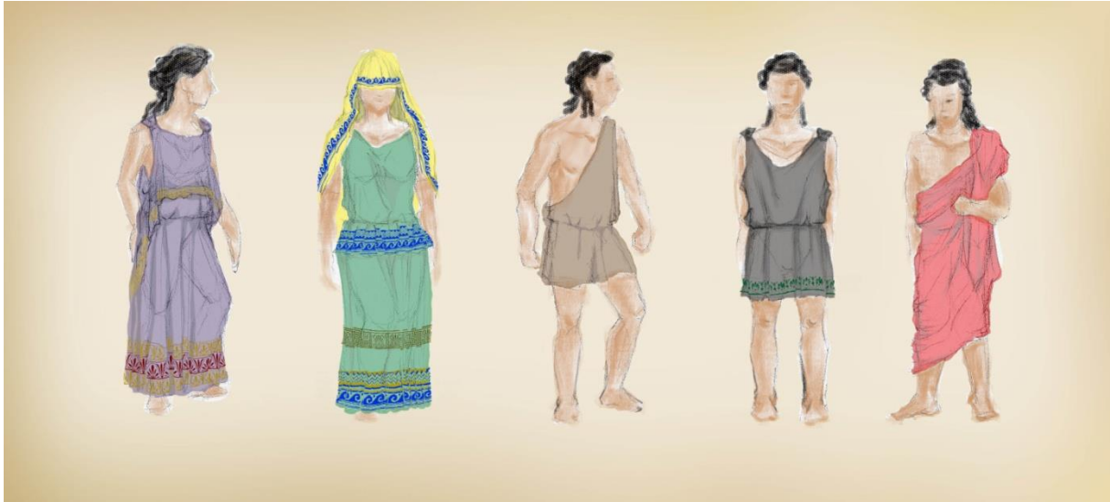
Slika 2: primjeri dorskog stila odijevanja

omotavajući tijelo i osiguravajući ga na području ramena iglama. Ovaj odjevni predmet se inače prikazuje šivan cijelom dužinom dok ima slučajeva gdje je šivan samo od struka do stopala, ponekad je otvoren dok ga jedino pojas drži spojenim. Prikaz takvog oblika nespojenog ženskog hitona ne možemo vidjeti prije petog stoljeća i katkad je prikazan bez pojasa. 34