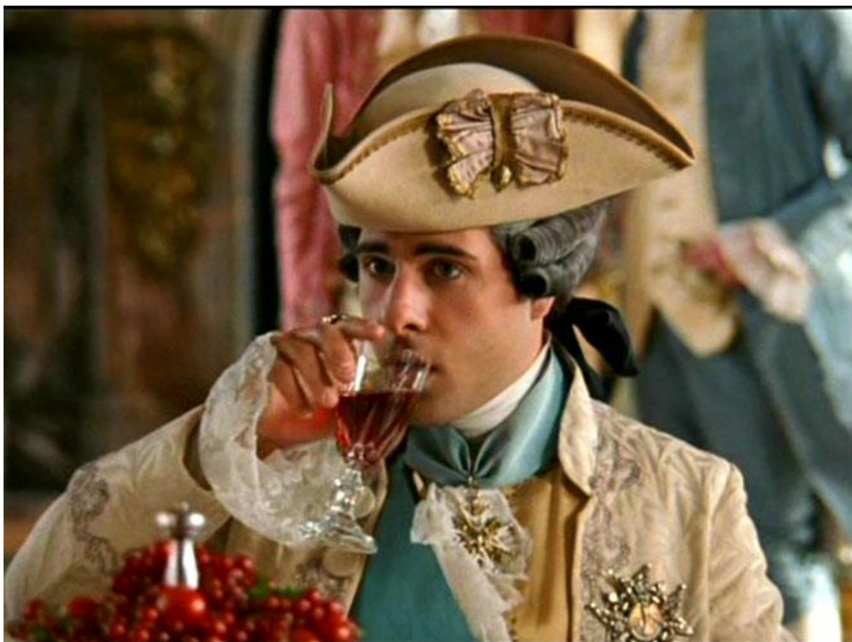
Slika 9. Scena iz filma „Marija Antoaneta“ na kojoj je vidljiva raskošna muška muda visokih slojeva društva 18. st. 14

Kraljica Marija Antoaneta na neki je način najreprezentativniji predstavnik mode tog vremena s obzirom na raskalašenost, dvorske intrige te lascivne zabave koje su joj se pripisivale i po kojima je ostala upamćena u povijesti. Posebno su za to doba karakteristična neobična oglavlja. Na taj način kroz formu na vidjelo izlazi umjetnička kreativna vještina koja manifestira ideju, stvaralaštvo, a osmišljeno oglavlje u sebi sadrži priču, tj. performans ili kompoziciju.