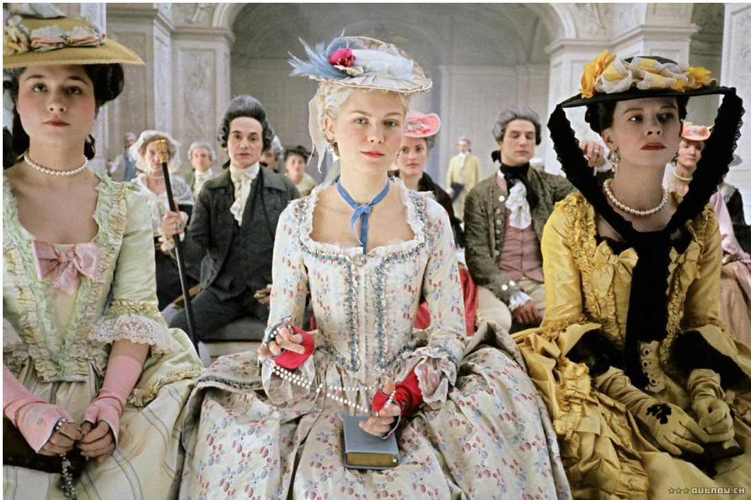
Slika 3. Kostimografija iz suvremenog filma inspirirana rokoko razdobljem 4

Odjeća iz 17. stoljeća u vremenu rokoka imala je određene opće karakteristike i obilježja. To su ponajprije izobilje nabora, podignuti okovratnici, stroga ekstravagancija, korištenje pastelnih boja, što je sve skupa stilski bilo vrlo upečatljivo. Bilo je rašireno i nošenje nakita i različitih ukrasa koji su odjeći davali dodatnu razinu ekstravagancije. U svakom slučaju moda u rokoku bila je podređena vanjskoj prezentaciji, a potpuno je zanemarena udobnost i praktičnost. Tako su se primjerice koristili steznici s ugrađenim šipkama od kosti, tvrdi prsluci koji drže tijelo čvrstim i uspravnim, krinoline (nizovi obruča ispod suknje) i slično. Među ženama su posebno bile popularne duboko izrezane haljine koje naglašavaju poprsje (otkriveno ili s prozirnom tkaninom).