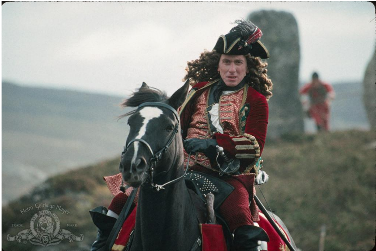
Slika 7. Filmski lik s početka 18. stoljeća u povijesnome filmu „Rob Roy“ 9

U filmu „Casanova“ (2005) koji je baziran na izmišljenoj radnji temeljenoj pak na autentičnom povijesnom liku 10 , odjeća kasnog baroka ima zavodnički, čak i erotski aspekt te pridonosi uvjerljivosti glavnog lika koji ima gotovu magijsku moć kad je u pitanju zavođenje žena. Ona u ovom primjeru dodatno naglašava ionako visoko izraženu senzualnost te romantičnu atmosferu, a koja je u suglasju s očekivanjima gledatelja.