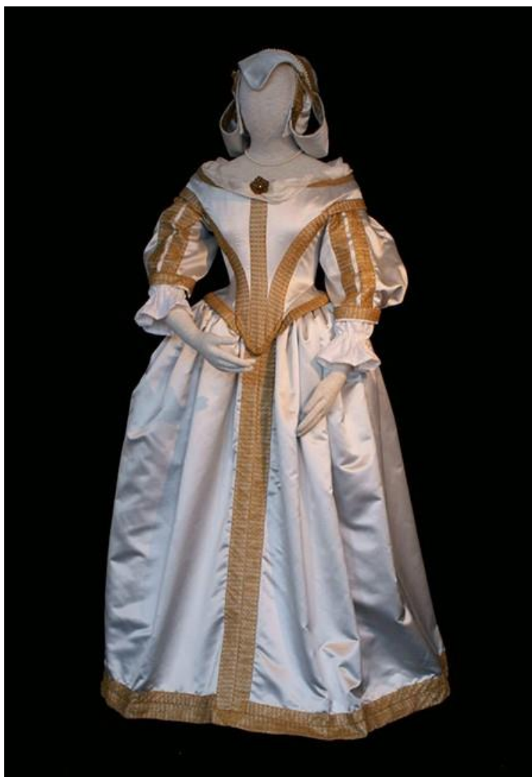
Slika 6. Barokna haljina žene iz srednjeg staleža, rano 18. st., Nizozemska 7

Krutost ženske odjeće iz prijašnjih trendova popušta, ali nema prenaplašene dinamike kao na muškoj odjeći. Ženska odjeća je vrlo slojevita i sastoji se od nekoliko dijelova. Prvi dio naziva se secret i predstavlja donju košulju. Drugi dio zove se frivol i to je raskošna gornja suknja uz brokat ili baršun. Korzet je pak samostalan gornji dio izrađen od istog materijala kao i suknja. Modest je gornja haljina od crnog satena. Vratni izrez bio je uokviren plohom čipkastog ovratnika nazubljenog ruba, a rukavi su bili veliki, nabrani te stisnuti u zapešću. Kao nakit često su se koristili biseri kao dijelovi ogrlica, naušnica itd.