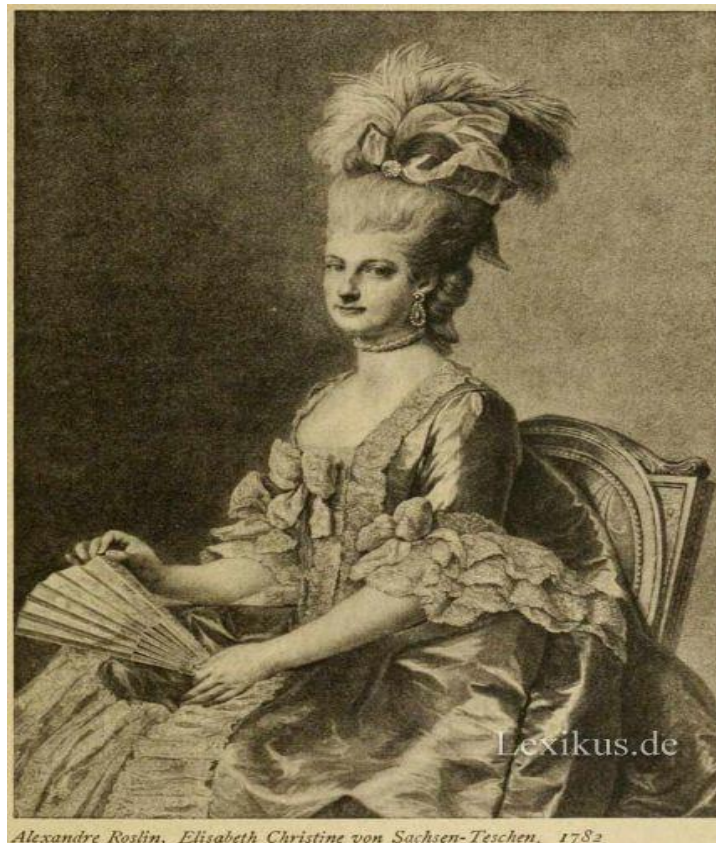
Slika 4: Elisabeth Christine (1715. – 1797.), kraljica Prusije 5

Odjeća rokokoja bila je sekularna adaptacija baroka iz 18. stoljeća u kojoj su dominirale vedre i razigrane teme. Ostali elementi koji pripadaju stilu rokokoja su brojne krivulje i masovna upotreba dekoracija te blijede, pastelne boje. Raskošne i bogate kreacije odnosno dinamični i fantastični oblici izraženi su teksturama u obliku listova, školjki ili plamenih jezika u asimetričnim strukturama, te kitnjastim i prekinutim krivuljama ostvaruju efekt pitoresknog, znatiželjnog i kapricioznog kroz jedinstvenu, homogenu cjelinu. Paleta boja u rokoku je mekša i bljeđa u odnosu na jake primarne boje i mračne tonalitete tipične za barok.