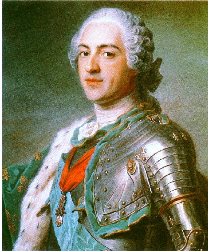
Slika 1. Francuski kralj Luj XV. (1710. – 1774) 1

U slikarstvu francuskog rokoka naglašeno se prikazuje težnja za bijegom u prirodu, pa tako Watteau 2 na svojoj najpoznatijoj slici Ukrcavanje za Kiteru (1717.) prikazuje veselo društvo u otmjenoj odjeći kako se padinom spušta do obale mora odakle polaze do hrama božice ljubavi Afrodite na otoku Kythere; izlet očito posvećen zabavi i ljubavi. Watteau je dočarao raskošne boje kasne jeseni, sunce je na zalazu, a i skupina silazi u udaljenu, neizvjesnu i maglovitu dubinu. Slikar, kao prorok, simbolično prikazuje sudbinu visokog feudalnog društva u najvećem obilju i trenucima zanosa.