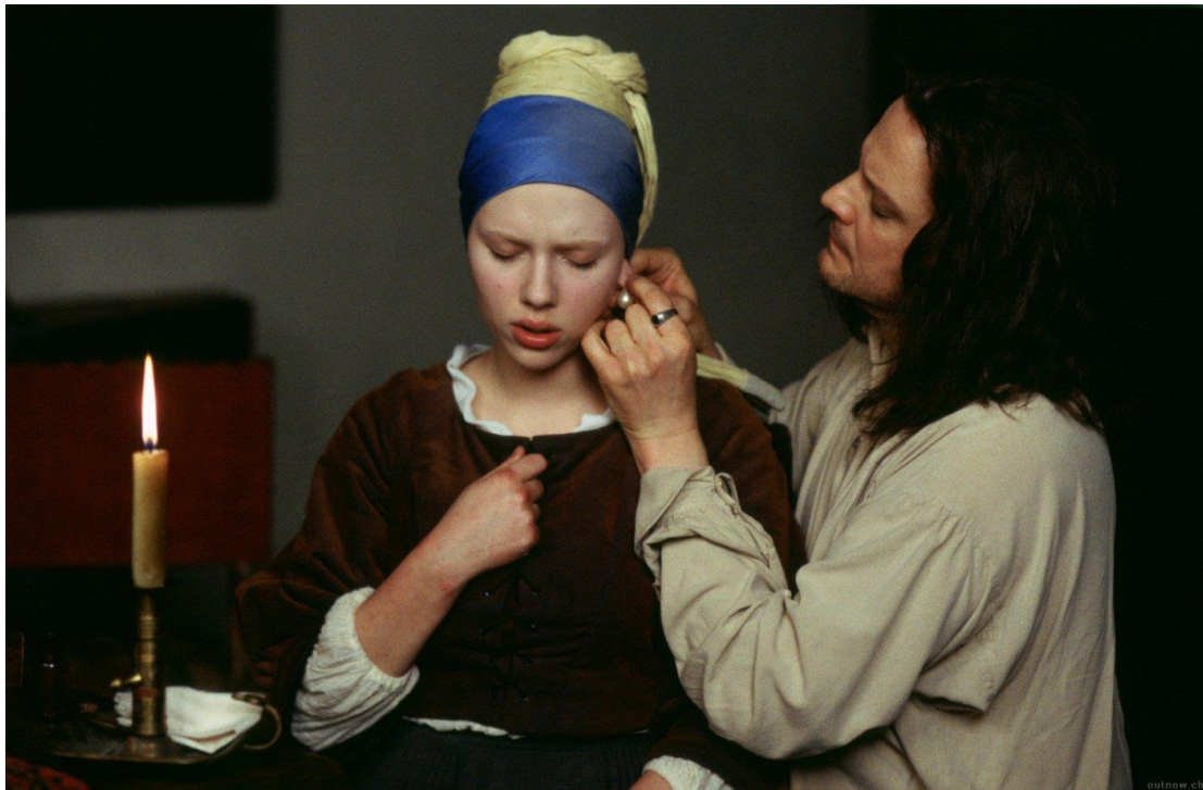
Slika 12. Scena iz filma „Djevojka s bisernom naušnicom“ 17

Naravno, kostimografija je ovdje bila bitna i u prikazu svih drugih likova koji se pojavljuju u filmu, pogotovo samog slikara koji ponajčešće nosi svijetlu košulju od laganog materijala koja je na neki način sukladna njegovom oslobođenom umjetničkom patosu.