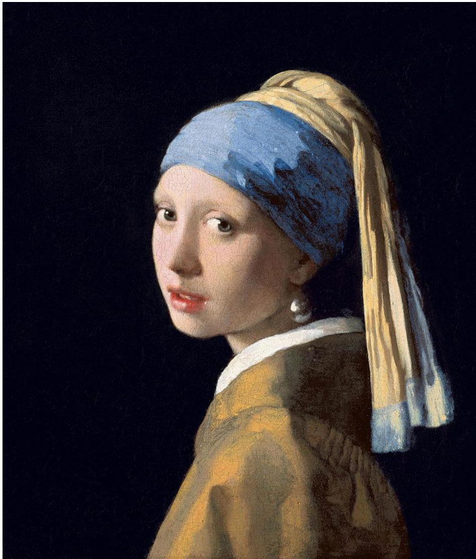
Slika 11. Originalna slika „Djevojka s bisernom naušnicom“ 16

Slika nije subjekt radnje, već objekt ili krajnji proizvod jedne uspješne suradnje i platonskog odnosa. Naravno, posve je moguće da je riječ i o nikad javno obznanjenoj ljubavi između spomenutog likovnog umjetnika s kraja 17. stoljeća i njegove neobično umjetnički senzibilizirane kućne pomoćnice, koja mu kasnije postaje i prava desna ruka – pomoćnica u njegovim slikarskim pothvatima oduševljavajući ga svojim vrlo zanimljivim i bistrim opažanjima. Ona je postala glavni model za financijski presudnu narudžbu Vermeerovog mecena, Van Ruijvena.