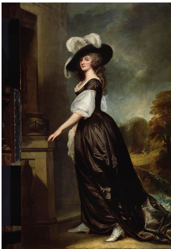
Slika 5. Dama u rokoko odjeći te s tada karakterističnim oglavljem 6

Vodeća zemlja u modi oglavlja u 18. st. je Francuska. Bilo je to vrijeme općeg modnog ludovanja, a najpoznatiji stil oglavlja bio je „ De Fontanges “ - glava ukrašena tzv. lyrom od kose u kombinaciji s okomito postavljenim čipkastim velom. Takvo ukrašavanje često je proizvodilo različite konstrukcije ogromnih dimenzija pa je sve izgledalo kao prava scena („ poufs “). Odijevanje sa stilom i moda postali su smisao života mnogih dama, ali i muškaraca. Za pojavljivanje na dvoru žene su morale nositi le grand habit de cour odnosno dvorsku haljinu. Ukrasi su uključivali čipku, vrpce, mašne, vez, perle, šljokice, a ponekad i drago kamenje. Stil rokokoja uživa u asimetriji što ostavlja neuravnotežene elemente radi efekta kontrasta; sve je besprijekorno integrirano u tečnost suprotstavljenih oblika i "rocaillea" koji je izum rokokoja.