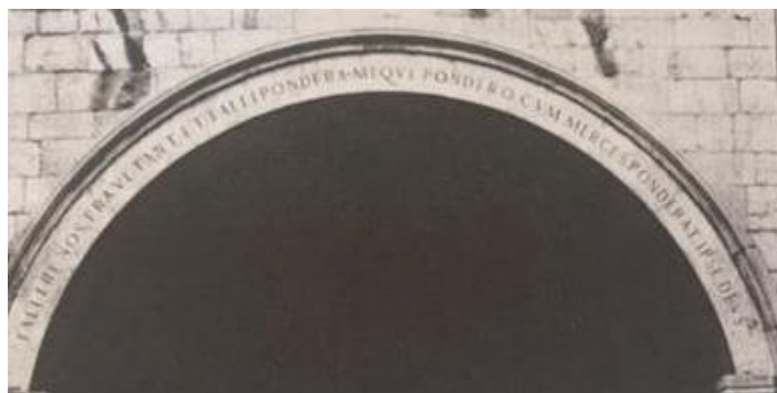
SLIKA 3 Natpis na zidu palače Sponza- Falletre nostra vetant et falli pondera meque pondero dum marces ponderat ipse Deus – Naši uetzi ne dopuštaju da varamo, niti da budeo prevareni, i dok ja važem robu, sam Bog važe mene

Trgovinom i pomorstvom sticali su Dubrovčani sredstva za svoj život i opstanak: politika Dubrovnika prema mnogim državama nužno je morala biti oportunistička, jer je malo koja država onoliko ovisila o stranom svijetu koliko Dubrovačka Republika. More je razvijalo u njima smijelost, ustrajnost i dalekovidnost, te su bili odvažni pomorci, dobro trgovci i spretni državnici. U borbi s orirodom i sa stranim svijetom Dubrovčani su ulagali sve svoje energije i pokazivali nevjerovatne društvene sposobnosti. U Republici je vladao red i javna sigurnost bila je zagarantirana. Dubrovački arhiv nam pokazuje da nitko od Slovena, osim Čeha, nije imao toliko smisla za administraciju kao Dubrovnik. 2