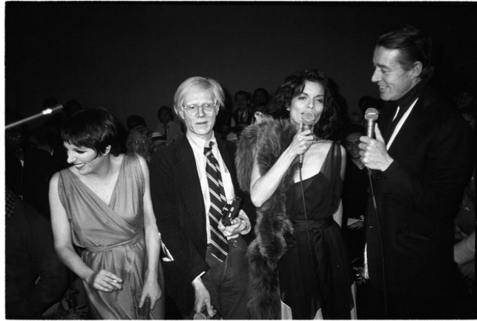
Sl.2. Liza Minnelli, Andy Warhol, Bianca Jagger i Halston, Studio 54, 1978.

donosila na temelju odjevne kombinacije te fizičkog izgleda osobe. Neke od poznatih osoba koje su zalazile u taj klub su: Andy Warhol, Grace Jones, David Bowie, Divine i Klaus Naomi.