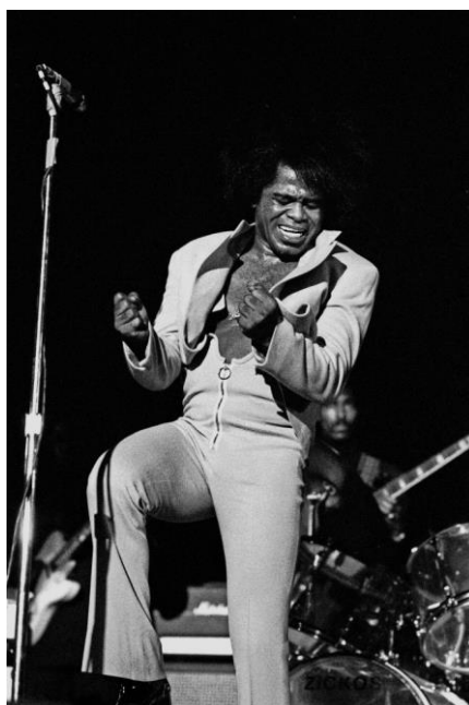
Sl.6. James Brown, 1973.

Funk i soul stil je proizveden iz R&B glazbe 33 krajem šezdesetih godina 20 stoljeća nakon što su umjem plesnim ritmovima te neobičnim odjevnim kombinacijama. Začetnikom ovog glazbenog pravca smatra se James Brown. On je bio i modna ikona ovog stila. Noseći svilene košulje, odijelo s trapez hlačama i veliki, gusti zlatni lanac obilježio je mušku modu funka . Osim toga, modu su obilježavali radosni, kreativni, svestrani, prirodni i privlačni odjevni predmeti koji su privlačili poglede mnogih. Svaki pripadnik ovog stila u ormaru je imao uske kratke hlače, visoke potpetice, muškarci su imali cipele, Trapez hlače, odijela, svilene košulje, te su muškarci voljeli nositi nakit poput Jamesovog zlatnog lanca. Odjevni predmeti su često bili u jakim i veselim bojama, baš kao i sama muzika.