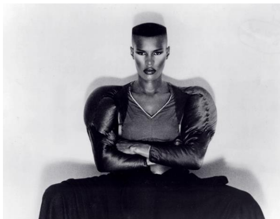
Sl.11. Grace Jones, 1975.

Kada govorimo o Grace Jones, možemo slobodno reći da je ona tip osobe koju ili volite ili ne volite. Zbog svoje hedonističke prirode i njezine sposobnosti da započne zabavu je postala ikona ovog desetljeća. Poznato je da je bila jedna od najčešćih gostiju koji su dolazili u poznati Studio 54. Bila je poznata po svojoj smionoj dječjačkoj frizuri te zavodljivom ali ujedno i zastrašujućem stilu. Uvijek je predstavljala svoj stil sa sigurnošću-i to je ono što je trebalo da ju svi zavole.