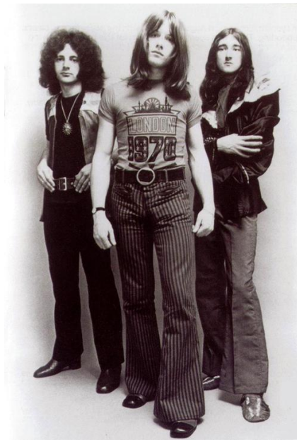
Sl.4. Band Atomic Rooster, pripadnici progresivnog rocka, 1971.

Pripadnici ovog stila su često miješali traper s kazališnim glamurom koji je uključivao rekvizite poput mača i čarobnjačkih šešira. Kada bi se ovaj stil morao definirati to ne bi bilo moguće. Doista je skup svih stilova polazeći od bajkovitih pravaca pa sve do zastrašujućeg izgleda. Na ovu vrstu glazbe najviše su utjecali : Kanas, Pink Floyd, Rush, Electric Light Orchestra, Emerson, Queen i Grand Railroad.