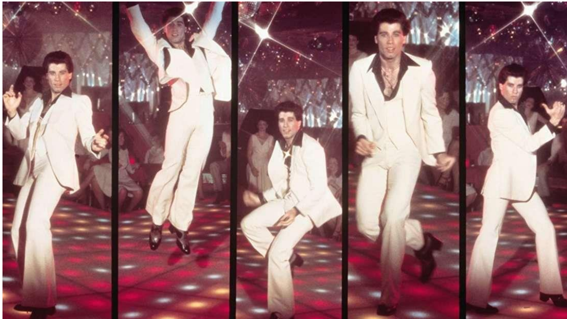
Sl.7. John Travolta- „ Groznica subotnje večeri “ 1977.

mladi su mogli vidjeti ženstvenost koju je pokazala Olivia Newton-John i muškost koju je predstavio John Travolta s kožnim jaknama i hlačama. Kada govorimo o modi filmske scene koja je utjecala na društvenu populaciju, nikako ne smijemo izostaviti film „ Groznica subotnje večeri “ (1977.) gdje je glumac John Travolta obilježio modu filmske scene noseći popularno bijelo odijelo. Taj film je dakako povezan za Disco razdobljem sedamdesetih. Svi ti filmovi su bili inspiracija za društvo. Neki su se pronašli u otmjenim stilovima, neki u ležernim. Dakako su pomogli izgraditi individualni stil pojedinca.