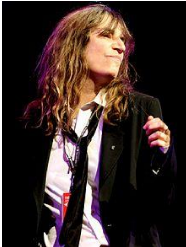
Sl.9. Patti Smith,1978.

Patti Smith je američka kantautorica , pjesnikinja i likovna umjetnica koja je promovirala androgeni stil. To bi značilo da je na sebe samo običnu bijelu majicu i pustinjske čizme te bi se čak zaboravila počestljati po nekoliko dana. Smith ima povišeni stil. Nije imala novaca, ali je imala viziju. Istina je glavni razlog zašto je proglašena modnom ikonom. Jednostavno rečeno, ona je govorila da onaj tko nosi odjeću, onaj koji bi održavao istinu o tome tko je on i tko se nada da će biti, te osobe koje bi slijedile trendove ili bi prikrile nesigurnost u umjetnošću. Sve što joj je važno u modi jest da upotrijebi svoju odjeću da kaže istinu. Zagovarala se za to da se ljudi prvo moraju upitati da moraju saznati tko su doista, tek onda bi se mogli obući na taj način. Njezin stil je najviše istaknut na naslovnici njezinog albuma Horses , gdje nosi svježu bijelu otkopčanu košulju, s crnim vrpčama oko vrata poput labavo zavezane kravate, te ima crnu jaknu koju je samo prebacila preko ramena. Kosa joj je divlja, i bez šminke je.