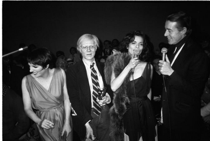
Sl.2. Liza Minnelli, Andy Warhol, Bianca Jagger i Halston, Studio 54, 1978.