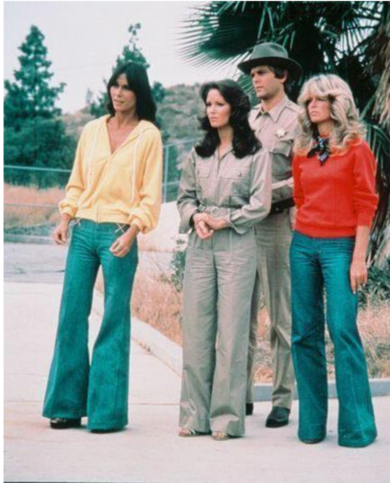
Sl.1. Moda sedamdesetih godina,1970.