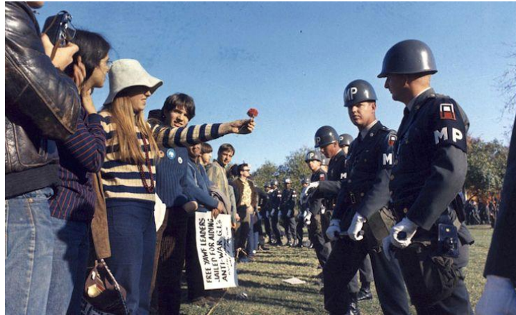
Sl.3. Flower Power,1967.

Baš kao što je i hippie pokret stvorio vlastite stilove u glazbi i modni, tako je i punk. Ali umjesto mira i ljubavi, punk je stvorio namjerno agresivan, konfrontacijski stil, korištenjem vizualnih oprema sadomazohizma.. Kao i pripadnici ranijih subkulturalnih pokreta, pripadnici punka su bili mladi ljudi koji su predstavljali buntovništvo. Razlog tome nije bilo teško pronaći. Oni su zadržavali svoje najveće žaljenje zbog starenja rockera i veterana iz 1968 .godine. Punk je bio namjerno buntovni stil te je i odjeća bila takva. Bila je poderana, probijena sigurnosnim iglama ukrašena svastikama, pornografskim slikama i lancima. Čak su i vlastito tijelo ukrašavali nakitom tako da su bušili razne dijelove tijela te su imali razne neobične frizure. Punk stil je u početku bio prikazan užasom. Ipak unutar nekog vremena, postao je utjecaj na međunarodnu modu. Već spomenuti dizajneri Vivienne Westwood i Malcom McLaren su izrazito bili zaduženi za modu ovog stila. Punk je glavni primjer novog brutalizma koji je obilježio cijeli modni sustav tijekom kasnih sedamdesetih godina. Važno je međutim naglasiti da zlokobno podrhtavanje nasilja i seksualna „ perverzija “ nije bila ograničena na subkulturne stilove.