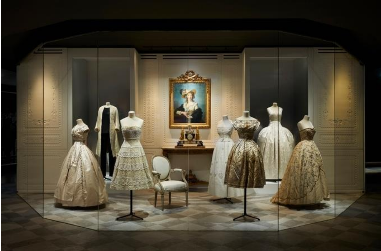
Slika 15:Kreacije Christiana Diora izložene u ambijentu kojim su inspirirane, https://www.gloria.hr/moda/inspiracija/kreator-iz-kuce-snova-christian-dior/6572127/ (10.11.2018.)