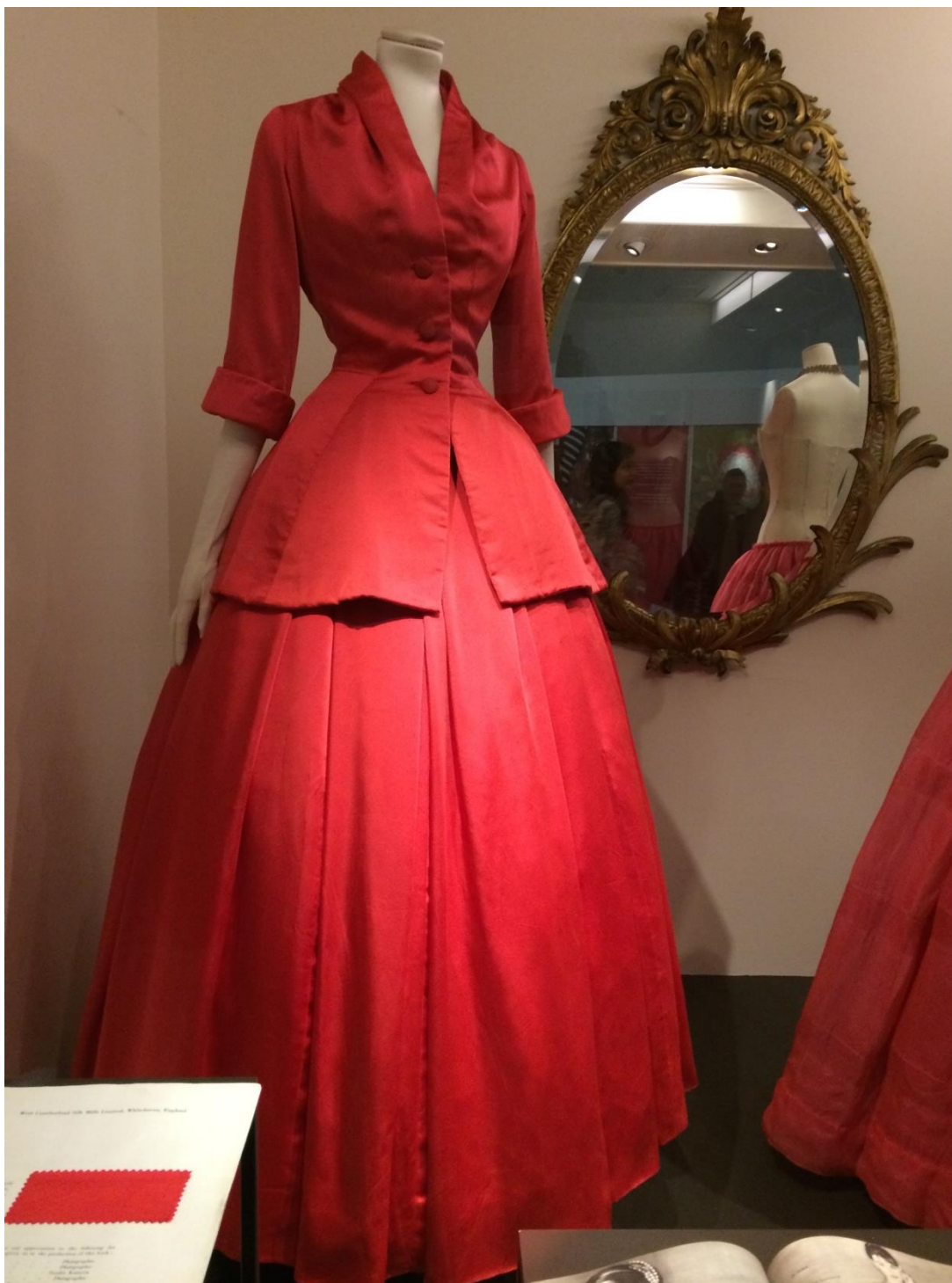
Slika 19:Haljina Zemire, Christian Dior, 1954-55., pohranjena u muzeju Viktorije i Alberta, https://assignmentforjs.wordpress.com/2015/05/07/christian-dior-zemire/ (10.11.2018.)