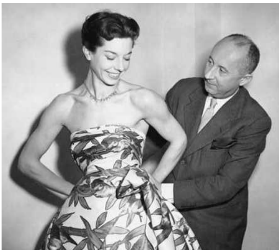
Slika 12:Christian Dior i model