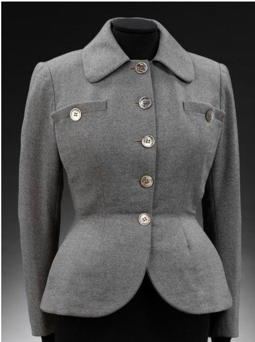
Slika 17: New Look jakna, Christian Dior, 1947-48., pohranjena u muzeju Viktorije i Alberta, https://www.pinterest.com/pin/264516178085611218/ , (10.11.2018.)

Siva jakna od vunenog flanela, strukirana, s jednostrukim kopčanjem i detaljem dvostrukih džepova. Na prednjoj strani jakne preobražavaju se u džepove na prsima. Također ima zaobljeni ovratnik i zaobljeni peplum.