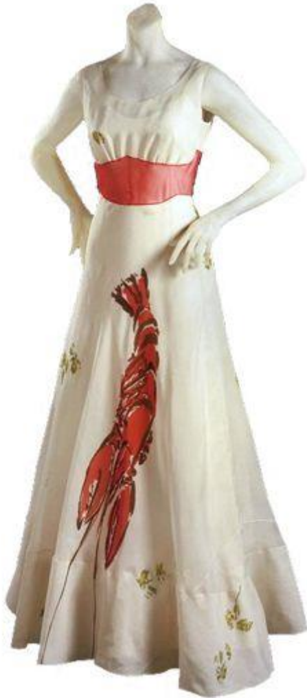
Slika 7: Jastog haljina, 02.1937., pohranjena je u muzeju za umjetnost u Philadelphiji, Elsa Schiaparelli http://emad.pgsri.hr/rad/suradnja-dalija-i-else-schiaparelli/ (10.11.2018.)

Jastog haljina ( Lobster Dress ) je jednostavna, bijela, večernja haljina sa motivom jastoga. Dalijevo motiva koji je imao običaj ubacivati u svoja djela, proizvode. Njegovu sliku za Schiaparelli Satche, vodeći dizajner preslikao je na svilu. 15