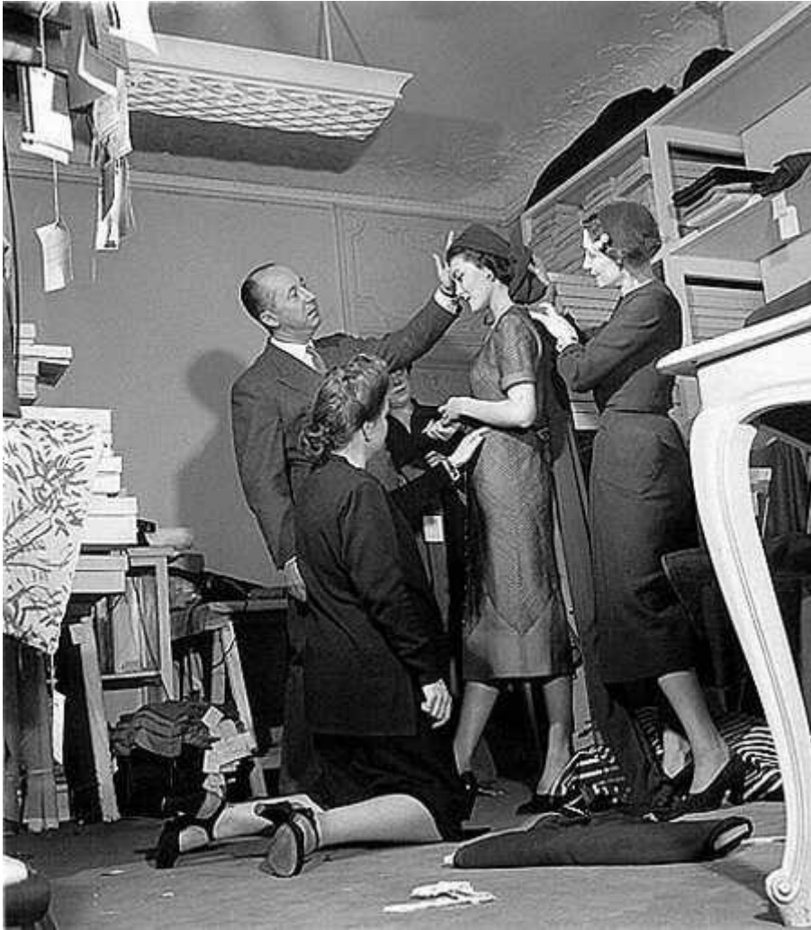
Slika 10: Christian Dior u poslu, http://www.modamo.info/index.php/moda/style-fix/3480-christian-dior-pria-iza-modne-legende (10.11.2018.)