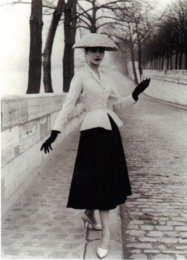
Slika 16: Bar odijelo, Christian Dior, 1947., pohranjeno u muzeju Viktorije i Alberta, http://fashionhistory.wikia.com/wiki/File:New-look-collection-bar-suit-by-christian-dior-in-paris-1947-spring-summer.jpg , (10.11.2018.)