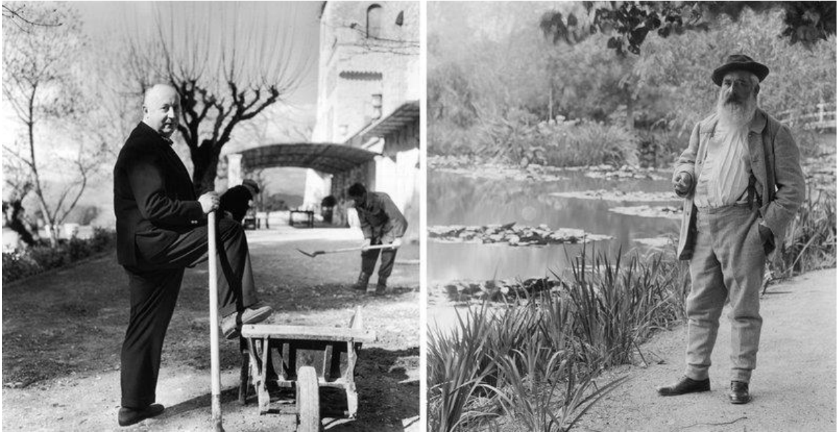
Slika 13: Christina Dior u svojem vrtu La ColleNoile (lijevo), Claude Monet (desno) https://www.npr.org/2013/09/19/223735567/exhibit-explores-how-diors-designs-echo-impressionist-paintings?t=1538930802703 (10.11.2018.)