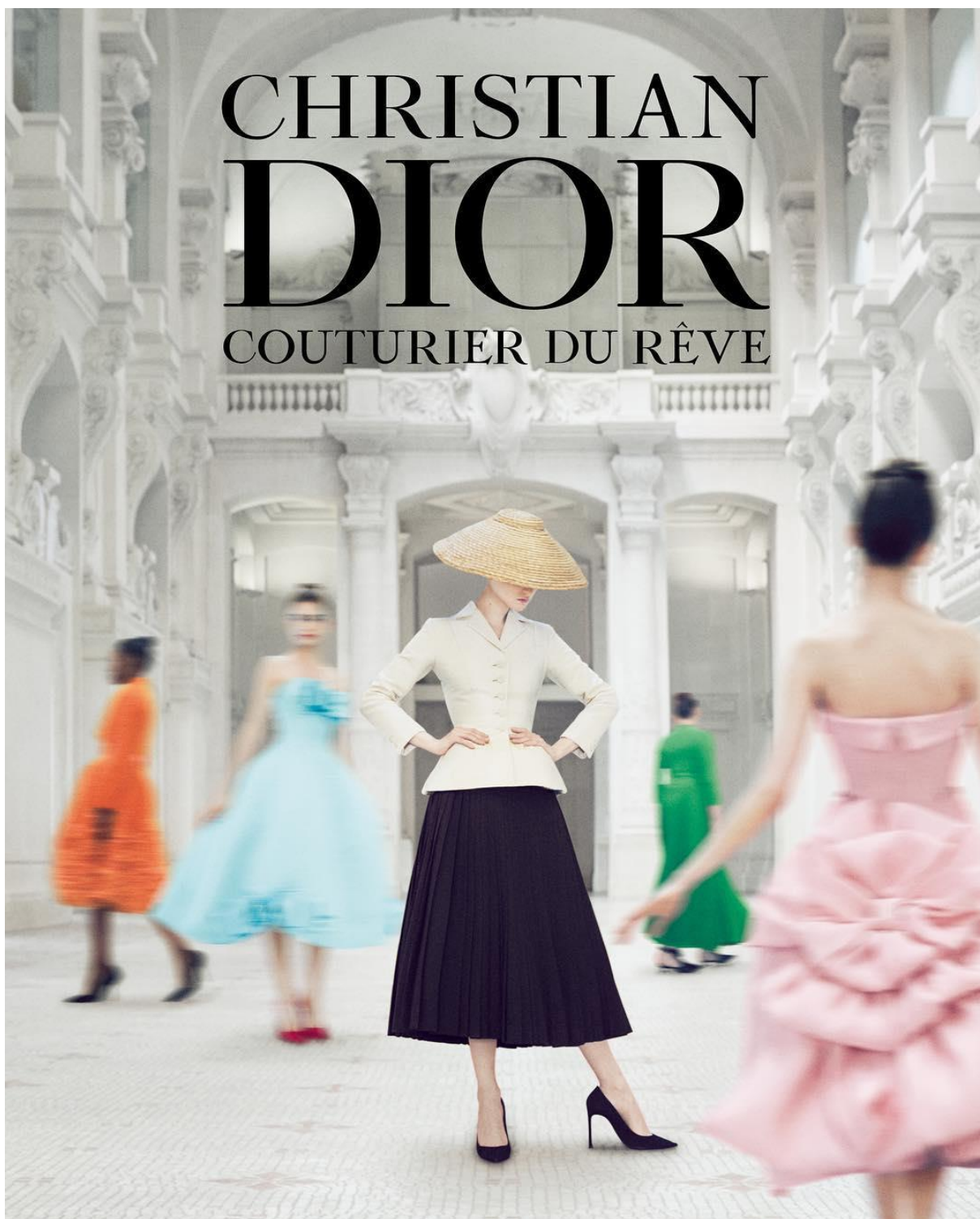
Slika 14: Bar odijelo, http://www.journal.hr/moda/dior-izlozba-pariz/ (10.11.2018.)