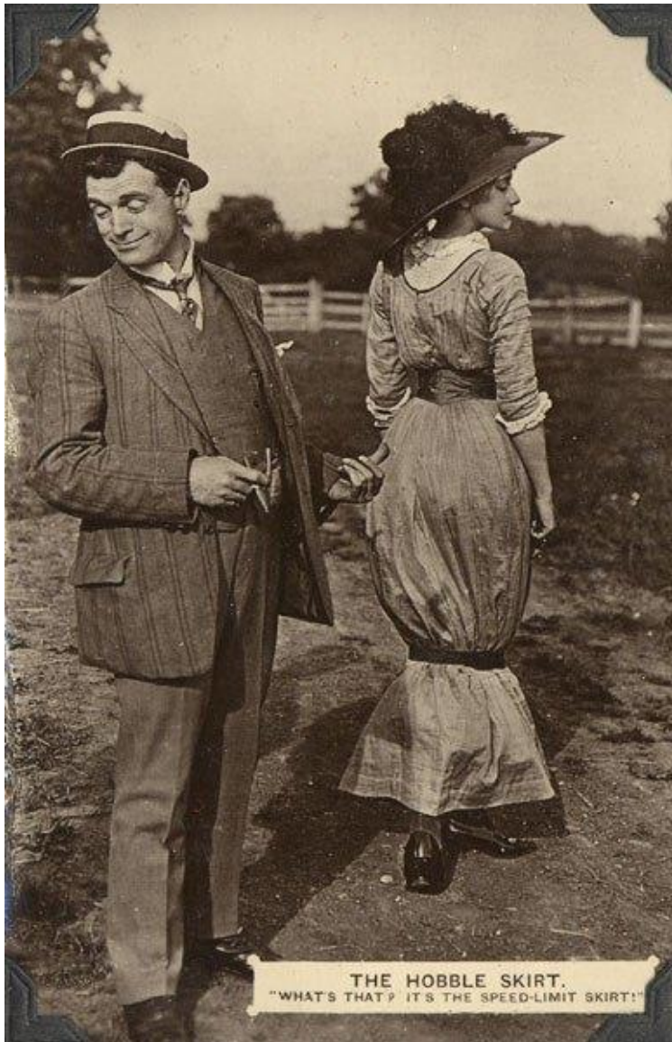
Slika 5: Hobble suknja, Paul Poiret, 1908., pohranjena u Metropolitan muzeju, https://myfashionillustrations.wordpress.com/2015/04/25/paul-poiret-a-fashion-designer-you-should-know/ (10.11.2018.)