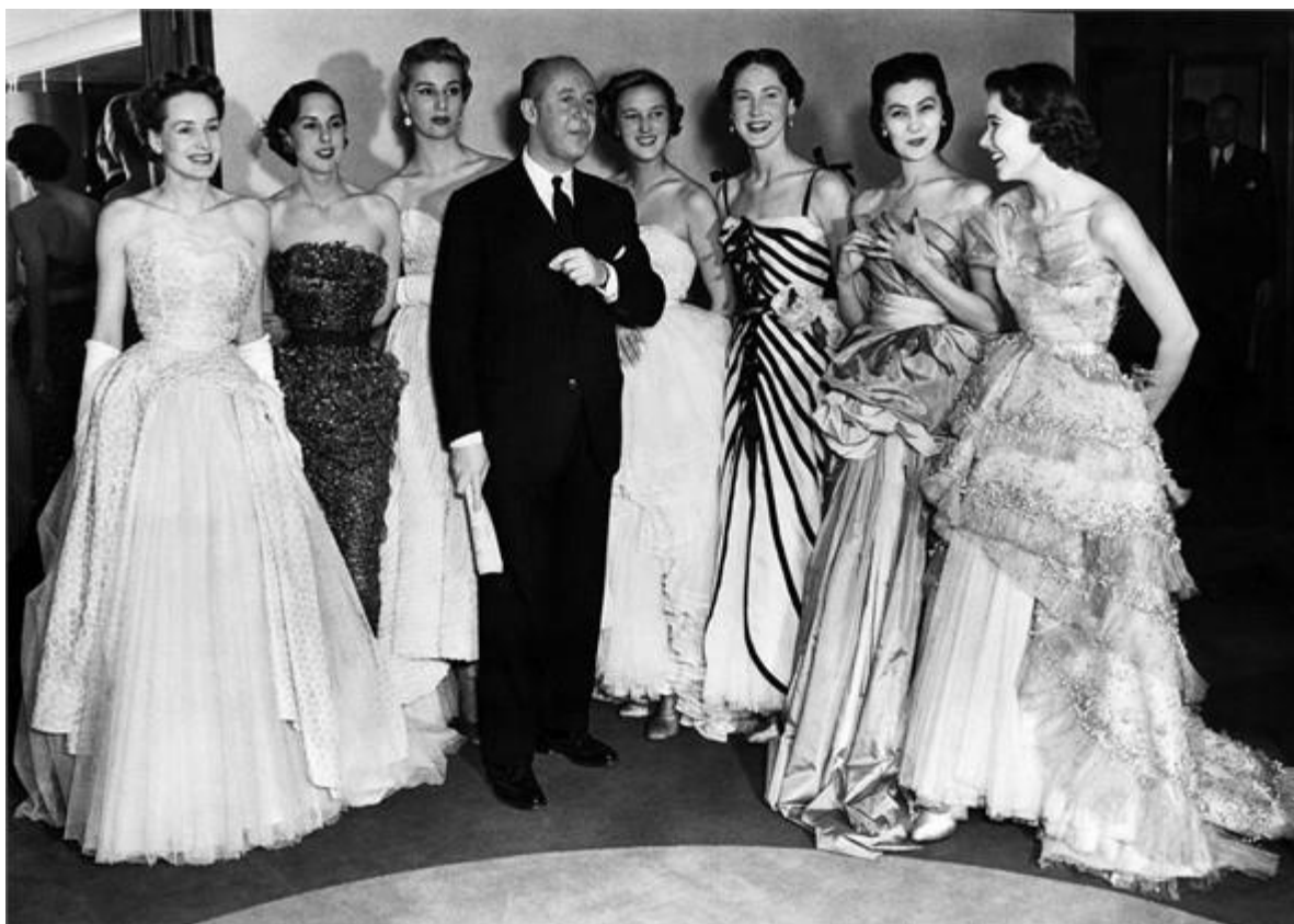
Slika 11:Christian Dior s modelima, http://www.modamo.info/index.php/moda/style-fix/3480-christian-dior-pria-iza-modne-legende (10.11.2018.)