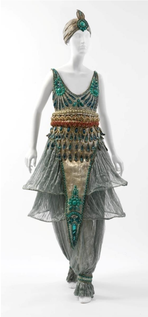
Slika 4: Elegantna kostim haljina, Paul Poiret, 1911., pohranjena u Metropolitan muzeju, https://myfashionillustrations.wordpress.com/2015/04/25/paul-poiret-a-fashion-designer-you-should-know/ (10.11.2018.)

U cjelokupnoj povijesti mode 20. stoljeća kolege su iznimno cijenile opus Paula Poireta, ističući ga kao umjetnika koji je prokrčio put suvremenoj modi. Iako s njim počinje svaka modna enciklopedija, njegovo je ime s godinama izbljedjelo u kolektivnom pamćenju. Tek u posljednje vrijeme nekako se budi uspomena na njega: kreatori mu u svojim kolekcijama počinju ispisivati posvete te ga iznova otkrivaju publici. 11