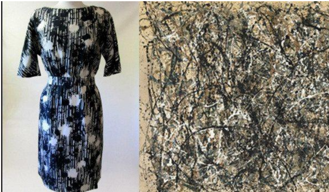
Slika 3:Haljina inspirirana Pollockovim dijelom http://www.ziher.hr/pogledajte-kako-moderna-umjetnost-inspirira-modu/ (10.11.2018.)

Američki slikar Jackson Pollock svojim je apstraktnim ekspresionizmom izvršio važan utjecaj na slikarstvo 20. stoljeća. Za vrijeme slikarske karijere, koju je rano skončao u automobilskoj nesreći uzrokovanoj alkoholom, Pollock je postepeno prelazio na sve apstraktniji i apstraktniji izraz. Potpuno apstraktni prikaz i doživljaj svijeta u kapljicama boje razlivene i poprskane kistom na platnu zanimljiv je i modnim kreatorima. Osim na slikarskom platnu, Pollockova tehnika je dobro primjenjiva i na modnom tekstilu. 9