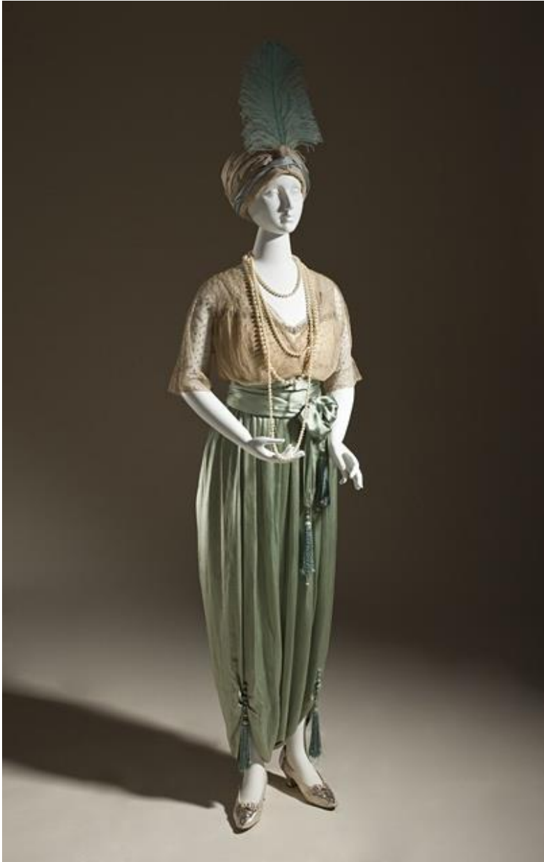
Slika 6: Kostim, Paul Poiret, 1911., pohranjeno u Metropolitan muzeju, https://myfashionillustrations.wordpress.com/2015/04/25/paul-poiret-a-fashion-designer-you-should-know/ (10.11.2018.)