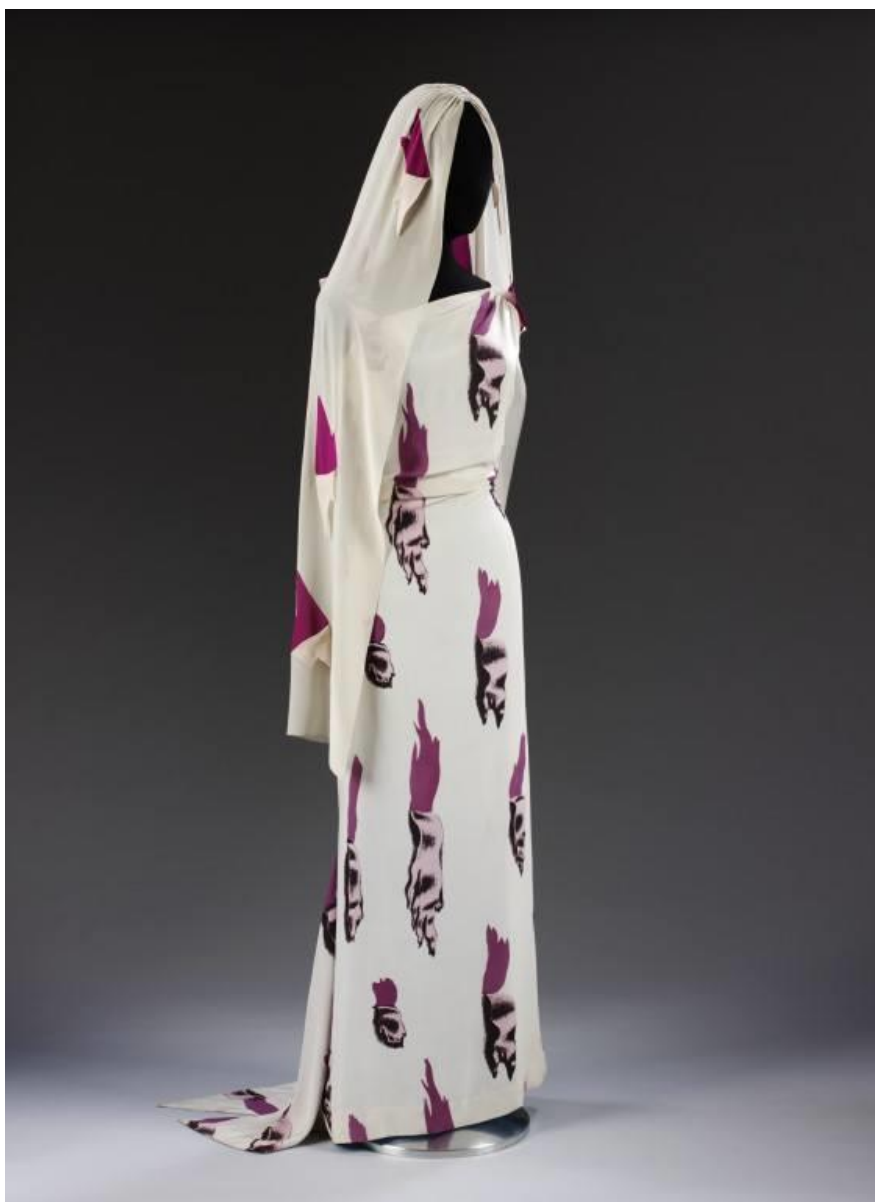
Slika 8: Haljina suza, Elsa Schiaparelli, 03.1938., pohranjena je u Dali muzeju na Floridi, http://emad.pgsri.hr/rad/suradnja-dalija-i-else-schiaparelli/ (10.11.2018.)

Haljina suza ( Tears Dress ) je bijela, večernja haljina koja ima veo dugačak do butina i motive koji daju iluziju životinjskog mesa. Suze su namijenjene da predstavljaju krzno, a sama haljina je napravljena od životinjskog krzna okrenutog iznutra. 16