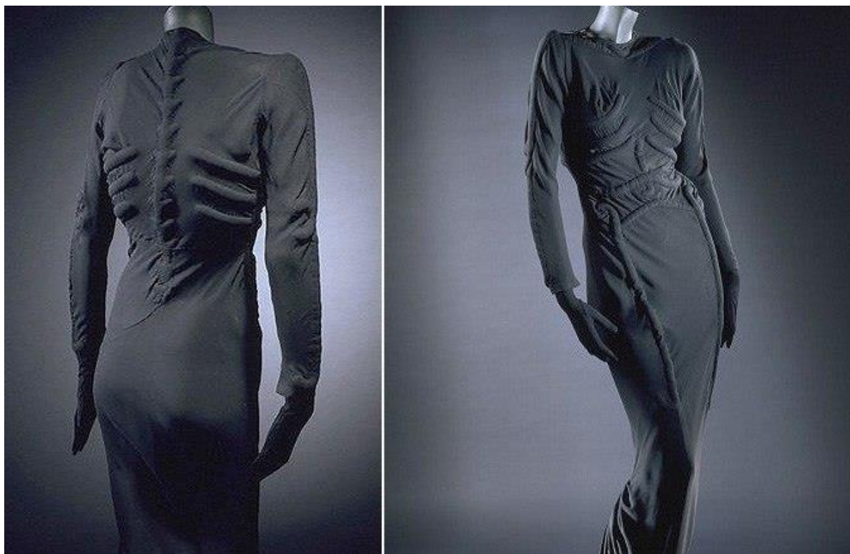
Slika 9. Haljina kostur, Elsa Schiaparelli, 1938., Muzej Victorije i Alberta, London, http://emad.pgsri.hr/rad/suradnja-dalija-i-else-schiaparelli/ (10.11.2018.)

Haljina kostur ( Skeleton Dress ) je potpuno crna haljina napravljena od krepa i ima rebra, kičmu i bedrene kosti urađene metodom Tapunto prošivanja (koje daje proizvodu određene slojeve). To je haljina koja je vjerojatno izazvala najviše nelagode i nezadovoljstva kod publike. 17