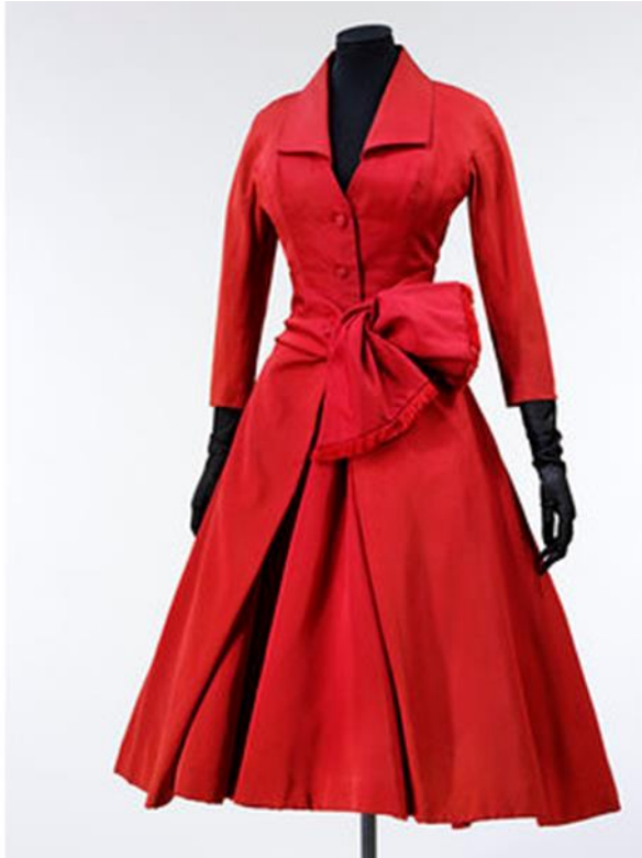
Slika 20: . Haljina Ecarlate, Christian Dior, 1955., pohranjena u muzeju Viktorije i Alberta, http://collections.vam.ac.uk/item/O139936/ecarlate-scarlet-cocktail-dress-dior-christian/ (10.11.2018.)