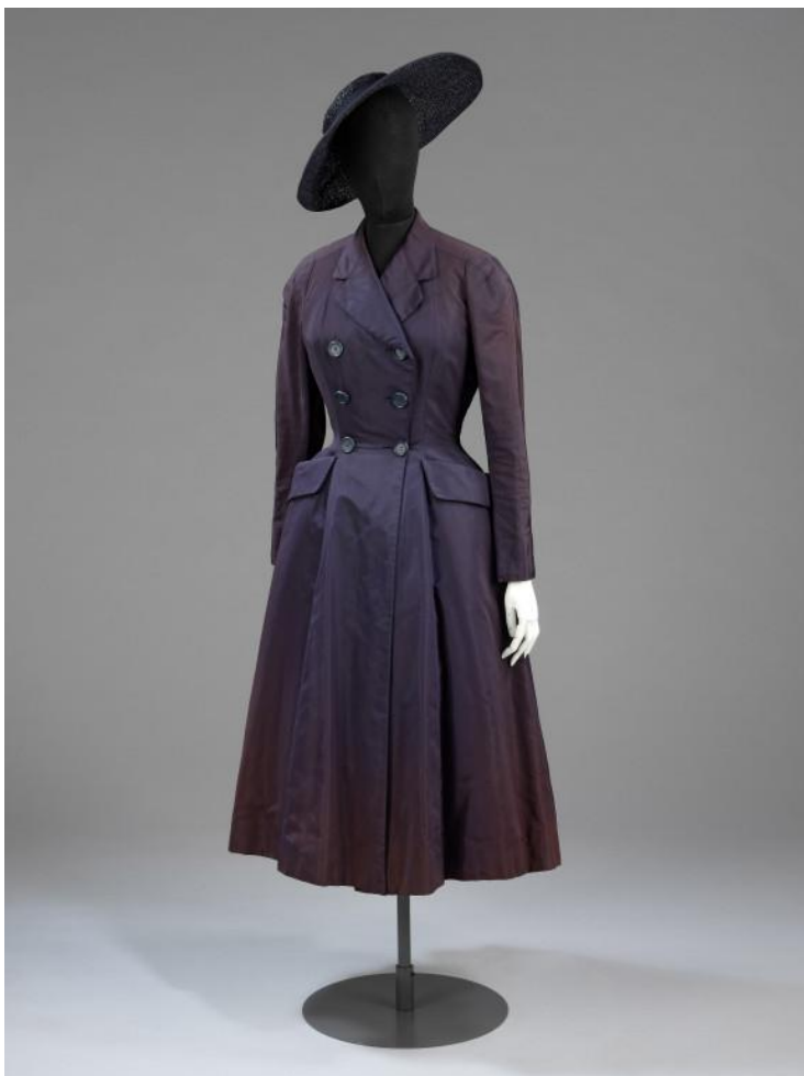
Slika 18: New Look kaput, Christian Dior, 1947-48., pohranjeno u muzeju Viktorije i Alberta, http://collections.vam.ac.uk/item/O139972/new-look-coat-dior-christian/ , (10.11.2018.)

Količina tkanine koja je potrebna za izradu New Look odjevnog predmeta je uglavnom 15 metara za vunenu dnevnu haljinu, 25 metara za kratku haljinu od tafta. Kolekcija je u tajnosti predstavljena princezi Margaret u francuskom veleposlanstvu u Londonu. Unatoč pokušajima odbora za trgovinu da ga potisnu, New Look je bio nezaustavljiv.