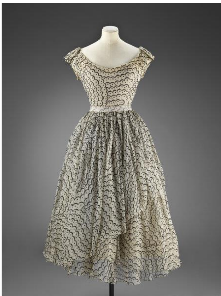
Slika 22: Haljina iz linije Tulipan, Christian Dior, 1953., pohranjeno u muzeju Viktorije i Alberta http://collections.vam.ac.uk/item/O34656/la-ligne-tulipe-evening-dress-dior-christian/ , (10.11.2018.)