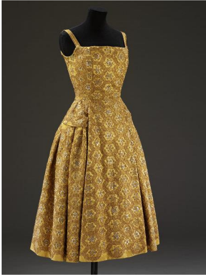
Slika 21: Haljina iz linije H, Christian Dior, 1954-55., pohranjena u muzeju Viktorije i Alberta, http://collections.vam.ac.uk/item/O117697/la-ligne-h-evening-ensemble-dior-christian/ , (10.11.2018)