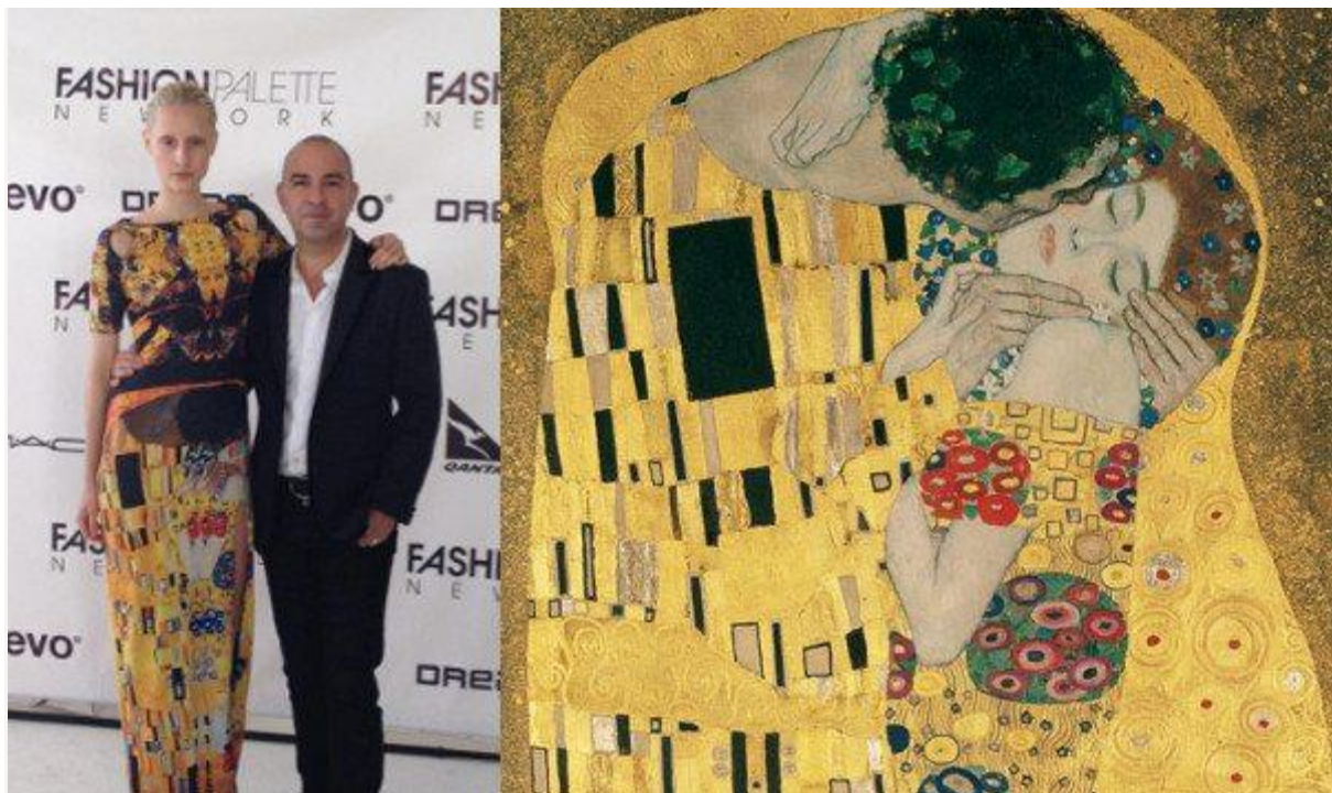
Slika 2: Haljina inspirirana Klimtovim dijelom „Poljubac“ http://www.ziher.hr/pogledajte-kako-moderna-umjetnost-inspirira-modu (10.11.2018.)

Gustav Klimt slavni je pripadnik austrijske secesije ili kako je Francuzi nazivaju Art Nouveau pravca u umjetnosti i dizajnu. Inspiriranost prirodom glavno je obilježje ovog pravca koji se u engleskom govornom području naziva Modern Style , a iz kojega se kasnije razvio i Art Deco . Najpoznatije Klimtovo djelo zasigurno je Poljubac. Osim inspiracije mrtvom prirodom, Poljubac je ogledni primjerak druge autorove opsesije – glavni predmet njegovih radova jest žensko tijelo, često prožeto elegantnom erotikom. Elegantna erotika je dobar opis i za haljinu inspiriranu njegovim radom. 8