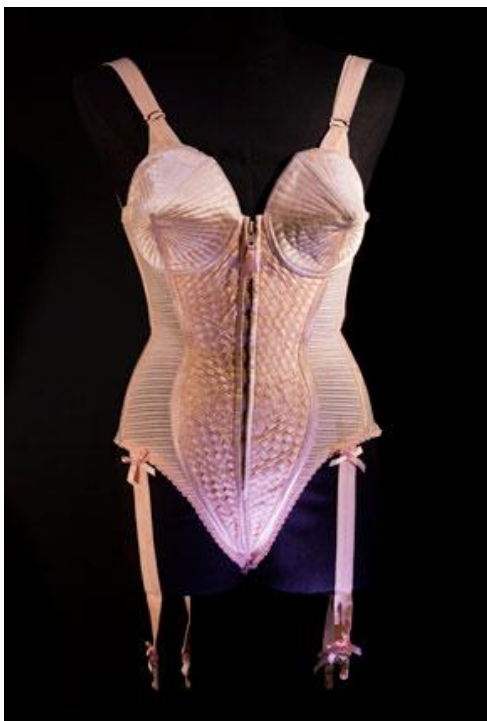
Sl.1. Jean Paul Gaultier, 1990. Korzet s podvezicama kojeg je Madonna nosila na svojoj turneji

Worth je "oslobodio" kreatora od uloge obrtnika, koji je bio podčinjen željama kupaca. Otvorivši svoju modnu kuću u Parizu 1857. godine bio je prvi stvarni "modni kralj". Sam bi birao materijale, razvijao dizajn te stvarao vlastiti odjevni predmet. Uz njega su modni kreatori počeli "potpisivati" svoje kreacije stavljajući oznaku na odjevni predmet, baš kao što su to činili i umjetnici. Ali "umjetnička sloboda" kreatora je bila poprilično ograničena s obzirom da su oni morali odgovarati estetskim referencijama kupaca koji nisu željeli platiti odjeću koju na kraju ne bi mogli nositi, što je značilo da kreacije nisu smjele previše odskakati od stila koji je vladao u određeno vrijeme. Ipak se Worth borio da kreatori budu priznati kao punopravni umjetnici. Paul Poiret je u još većim razmjerima poveo borbu modnih kreatora kako bi bili priznati kao umjetnici. 1913. godine je izjavio: "Ja sam umjetnik, a ne krojač". On je prvi počeo kreacijama davati nazive i imena, poput "Magyar" i "Byzants", umjesto brojeva koji su se prije koristili. Modni kreatori nikad nisu zadobili priznanje punopravnih umjetnika, ali za tim još uvijek teže. Strategija je bila da se preokrenu unutarnje i vanjske razlike, što je Gaultier napravio kreirajući svoj čuveni korzet koji se nosi na odjeću, a Helmut Lang je kreirao haljine s naramenicama.