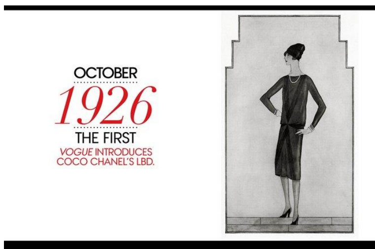
Sl.4. Coco Chanel, "Mala crna haljina", Američki Vogue, 19

ujedno i osnivača pravca, Pabla Picassa, pokazuju kako ekstravagantni oblici ili boje dizajnerove odjeće vode k slikovnom prikazu umjetnika. No, vratimo li se na modu 1920-ih godina, to je bila moda koja je odbacila ornament, te prihvatila čiste oblike i koja je bila primjer čistog modernističkog etosa. Coco Chanel je učinila velik preokret radeći žensku odjeću koja je bila koncipirana prema muškoj. To je bio zahvat koji je bio u skladu s načelnim trendom vremena prema jednostavnim oblicima. Doduše, Chanel nije bila jedina koja je kreirala odjeću jednostavnih oblika te crpila ideje iz muške odjeće, ali je ona to uspjela prisvojiti kao svoj stil, bez obzira što su mnogi drugi dizajneri radili sličnu odjeću.