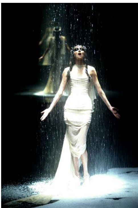
Sl. 10. Alexander McQueen, The Golden Shower, 1998

laboratoriju. (Svendsen, 2004; 120). To je prije svega bio performance , ali zato estetski gledajući, jedna vrlo uspješna revija. Tema je također bila vrlo popularna, jer se lik "serijskog ubojice" obrađivao u mnogim filmovima. Kritičari su komentirali kako se McQueen previše trudio da to bude umjetnost, a ne klasična modna revija, što bi zapravo i trebala biti. McQueen je, pak, govorio kako mu je reakcija publike najbitnija, te kako više voli vidjeti da revija nekom izaziva mučninu nego osjećaj ugone. To je čisti dokaz prisustva duha avangardne umjetnosti.