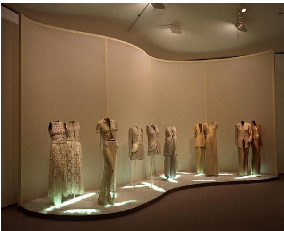
Sl. 3. Giorgio Armani, Guggenheim, 2000.

Godine 1983. Metropolitan Museum je u svojem odjelu za kostime održao izložbu Yvesa Saint Laurenta, te je nakon toga nastalo more izložbi o umjetnosti i modi. Versace je 1997. godine imao izložbu u Metropolitan Museum of Art, dok je 2000. godine Guggenheim u New Yorku postigao svoj najveći uspjeh kod publike Armanijevom izložbom koja je nakon toga otputovala u Bilbao, Berlin, London, Rim i Las Vegas. Giorgio Armani je na otvaranju izjavio kako je ponosan što je izabran da "staje uz bok djelima najutjecajnijih umjetnika 20. stoljeća".