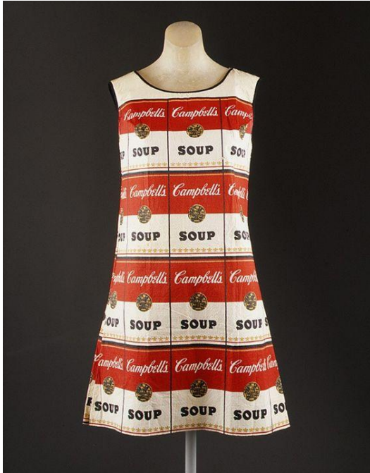
Sl. 7. Andy Warhol, "Tomato soup dress" , 1966./1967.