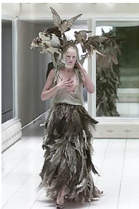
Sl. 11. Alexander McQueen, spring/summer 2011.

ljudima kako bi trebali izgledati. Promatrači su objektivirali sami sebe. No, to se sve preokrenulo kada je revija započela, budući da je kutija bila izrađena tako da modeli koji su bili unutra nisu mogli vidjeti publiku, nego samo vlastitu sliku u ogledalu. Publika je sad mogla promatrati modele, a da sama nije bila viđena, te tako gledajući bila prisutna na peep showu. To je primjer mode koja je posve jednaka s umjetnošću, ali kod takve umjetnosti moda ne dolazi u prvi plan.