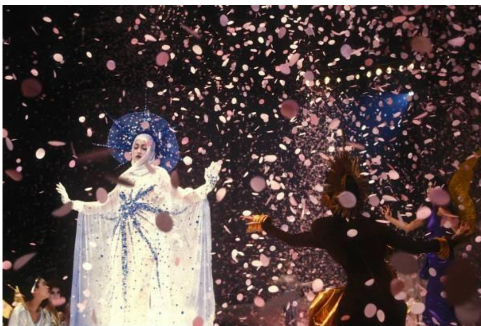
Sl. 9. Thierry Mugler, "The Winter of the Angels", 1984.

ga u šumsku oazu. Standard za maštovite revije je postavljen 1984./1985. godine kada je Thierry Mugler prikazao svoju kolekciju za jesen/zimu iste godine. Thierry Mugler je želio rekonstruirati djevičansko rođenje na modnoj pisti punoj opatica, a finalni dio revije je bio kada je model sišao s neba u oblaku dima uz puno ružičastih konfeta. Mnogi su Muglera kritizirali da je njegova odjeća u potpunosti zasjenjena, ali su ubrzo nakon toga spektakularne revije, baš poput njegove, postale pravilo a ne iznimka.