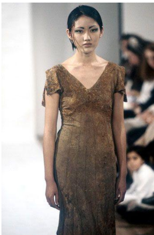
Sl.2. Hussein Chalayan, "The Tangent Flows", 1994

Modni dizajneri počeli su raditi kolekcije koje nisu bile nosive, dok im revije nisu izgledale kao revije već kao modni show. Revije Husseina Chalayana su izgledale upravo tako. 1994. godine Hussein Chalayan je imao reviju na kojoj je odjeća bila praćena tekstom koji govori o nastanku kolekcije. Govori o tome kako je neko vrijeme bila zakopana u zemlji prije nego li je prikazana javnosti na modnoj pisti. Chalayan je, s pravom, govorio kako bi njegove kreacije bolje odgovarale zidu neke galerije nego ljudskom tijelu.