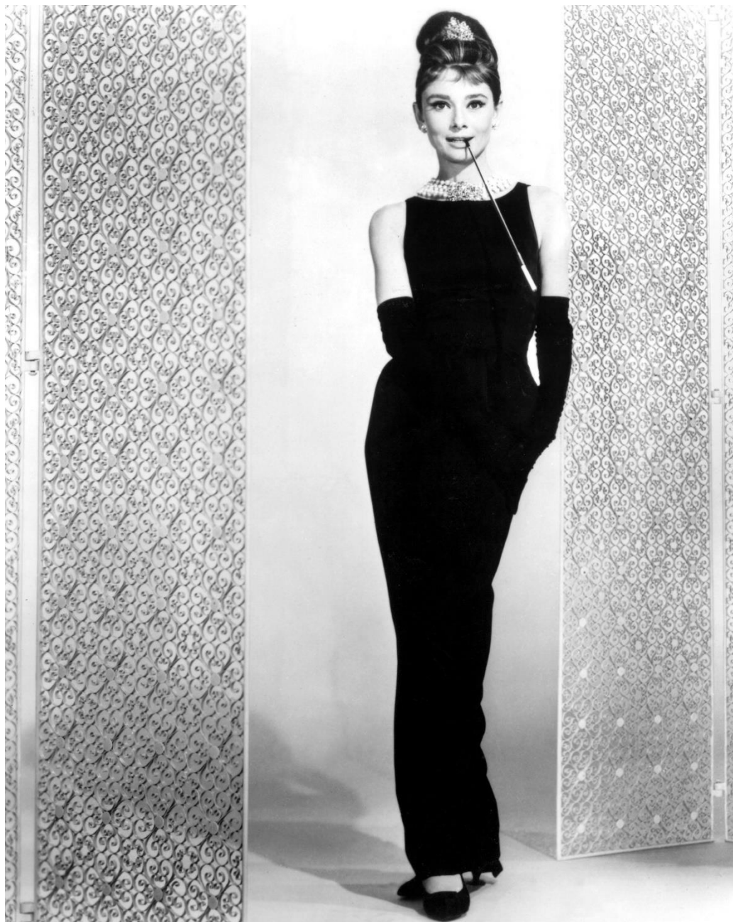
Slika 2 Audrey Hepburn u elegantnoj crnoj haljini u kombinaciji sa njenim omiljenim modnim dodacima- biserima

Audrey Hepburn preminula je 1993. godine u Švicarskoj nakon što se uspostavilo da boluje od rijetke vrste raka slijepog crijeva koji se, nakon operacije nastavio širiti, a ona je odbijala kemoterapiju.