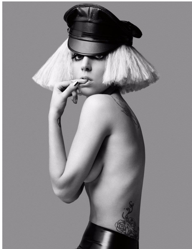
Slika 6 Lady Gaga na jednom od svojih zanimljivijih snimanja

Stefani Joanne Angelina Germanotta rođena je 28. ožujka, 1986 godine u New Yorku, otac joj ima internetsku tvrtku, majka je asistent telekomunikacija, a mlađa sestra studira na modnom fakultetu Parsons. Od malena pokazuje zanimanje za modu gledajući majku kako se sprema za izlaske, a sa 4 godine naučila je svirati klavir bez čitanja nota. Pohađala je privatnu katoličku školu u kojoj su pravila odjevanja bila vrlo stroga, no uredno ih je poštovala. Već u školaskim danima isticala se kao glumica, pjevačica i plesačica u mjuziklima, a često se znala previše uživjeti u ulogu. Bila je jedina sedamnaestogojšnjakinja koja je uspjela upisati prestižnu školu umjetnosti, a odustala je nakon što je shvatila da to nije za nju. Nakon što je napustila elitni roditeljski dom, preselila se u mali siromašni stančić u Brooklynu gdje se počela drogirati, sa izjavom da želi znati kako se osjećaju njeni idoli koji se drogiraju. Radila je kao konobarica, striptizeta i go-go plesačica, nakon što ju otac, zaprepašten njenim poslom, prestaje financirati, to ostaje njen način zarade. Otac također prestaje razgovarati s njom, a ostaje slomljena jer joj je udaljenost od oca bila strašna.