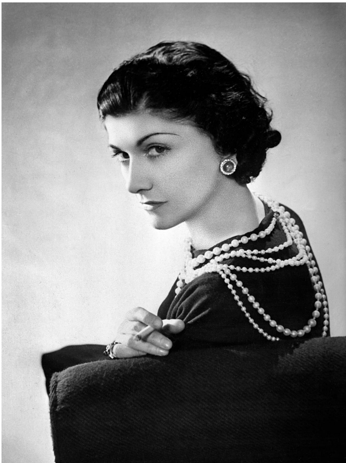
Slika 3 Coco Chanel u elegantnom izdanju sa bisernom ogrlicom

Gabrielle je umrla na pragu devedeste godine života, spremajući oproštaju kolekciju. Na njenog grobu su isklesane glave lavova koje označuju njen horoskopski znak.