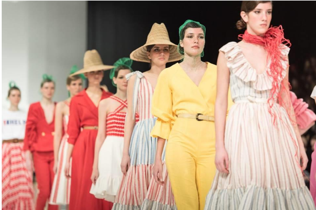
Sl. 26. Kraj defilea Twins kolekcije Slavonski safari, proljeće/ljeto 2018. godine

U procesu stvaranja i kreiranju svake kolekcije dizajner mora biti svjestan odgovornosti oblikovatelja jer osim ekonomske koristi dizajner mora biti svjestan i svoje uloge kulturnog radnika. Dizajn preobražava kulturu života i kulturu rada. Oblikujući pojedini odjevni predmet dizajner za brend oblikuje i skalu vrijednosti, stavove, mišljenja i ponašanja kako proizvođača tako i potrošača. Uskladiti kvalitetu, izgled i upotrebljivost proizvoda je najteži zadatak svakom dizajneru.