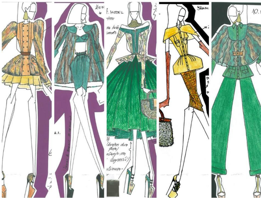
Sl. 11. Modni crteži brenda Twins za kolekciju jesen/zima 2012. godine

Princip i pristup rada na kolekcijama razlikuje kod svakog dizajnera i ne postoje točne upute koje garantiraju uspjeh ili kvalitetu kolekcije. Za Twinse rad na svakoj kolekciji počinje od ideje. U lipanjskom izdanju časopisa Ljepota i Zdravlje Twinsi o kreativnom procesu stvaranja navode: „Svoju ideju prenosimo na papir, provodimo tjedne istražujući temu kojom se inspiriramo i na kraju radimo layout kolaž od skica, modnih ilustracija, crteža, inspirativnih citata iz literature koja je povezana s tematikom inspiracije, filmova, glazbe, tkanina i svega što smatramo esencijalnim kako bi jednim pogledom na tu umnu mapu shvatili koja je inspiracija kolekcije.“