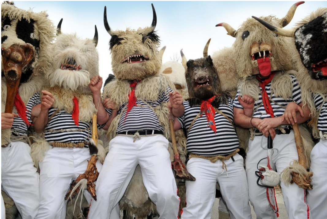
Slika 4. Halubajski zvončari

Valja zaključiti kako su halubajski zvončari jedno od obilježja cijelog pusnog perioda za prostor istočne Kastavštine i šire. Njihova jedinstvenost i autentičnost znak su posebnog djela kulture veoma važnog ne samo za područje Kastavštine ili Primorja, već je i dio baštine Republike Hrvatske. Unatoč sitnim promjenama koja su vremena nanijela ovoj zvončarskoj skupini treba naglasiti kako su oni i dan danas simbol i čuvar tradicije istočne Kastavštine.