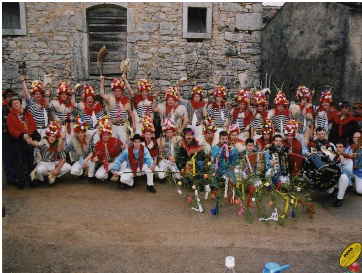
Slika 5. Mučičevi zvončari