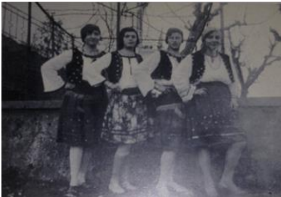
Slika 6. Partenjaki 1929. godine

U povorci partenjaki u pravilu idu dva po dva ili tri po tri, držeći se oko pojasa, krećući se lijevo- desno u taktu glazbe. Mladići su obučeni u lijepe svilene bluže, najčešće plave boje, koje su na krajevima rukava, oko vrata i oko pojasa obrubljene vrpcom u boji ili rubom izvezenim u narodnom vezu. Hlače su najčešće traperice, a za obuću se koriste niske ili visoke elegantne cipele. Oko vrata svaki partenjak nosi svileni rubac, najčešće crvene boje, s cvjetovima. Prije pedesetak godina partenjaki su na glavi nosili posebne kape ovalna oblika, izrađene od kartona presvučenog tankim plišem u boji. Po rubu i obodu kape bile su prošivene staklene perle u obliku cjevčica, danas partenjaki na glavi ne nose ništa. Djevojke su odjevene u posebne svilene suknje-brhane, a pri dnu imaju prišivenu jednu ili više vrpce u boji različitoj od suknje. Na gornjem dijelu djevojke nose bijele bluže, od svile ili sličnog materijala. Preko bluže neke od njih stave najčešće crni prsluk- kamižolin, žutim koncem izvezenih rubova, te tu i tamo prišivenim zlatnim tokama. (Šepić-Bertin, 1997: 12). Nekad su djevojke oko vrata nosile ogrlice umjesto rupca, a rubac su najčešće nosile na glavi, danas djevojke i mladići nose rubac oko vrata. Na nogama su djevojke po starom običaju nosile pletene čarape, a danas najčešće nose hula-hop čarape te čizme.