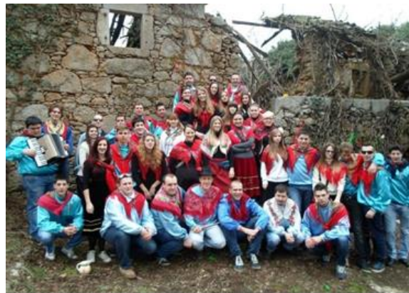
Slika 7. Partenjaki 2016. godine