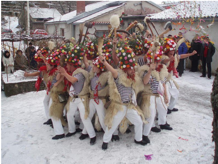
Slika 3. Zvončari sa Zvoneće

Zvoneća i Rukavac veoma su usko povezani pojmovi, kako geografski samom blizinom među dvama selima, tako zvončarskom tradicijom, ali i obiteljskom vezom. Naime stanovnici Rukavca u jednom su periodu počeli nastanjivati područje Zvoneća (a prije toga su to područje koristili za ispašu stoke). Nadalje su se stanovnici dvaju mjesta počeli međusobno ženiti te samim time dolazi do preplitanja među tradicijom, ali i sve manjih razlika u običajima ovih dvaju mjesta. S toga nije začuđujuće kako su ophodi ovih dviju zvončarskih skupina gotovo identični ili neizbježno veoma slični. Najveća je razlika u ruti samog ophoda, odnosno, zvonejski zvončari ne prolaze kroz Škrapnu i Krivu te se odvijaju u suprotnom smjeru te tjedan dana nakon rukavačkog ophoda. Njihova ruta se kreće u smjeru jugozapada te posjećuju sljedeća mjesta: Sušnji, Zdemer, Kućeli, Biškupi, Rukavac, Jušići, Jurdani, Mučići te potom preko Brešca i Zaluka ponovno put Zvoneće. Samo ponašanje i odjeća unatoč tome što su se nekoć razlikovali danas su gotovo identični kao i oni kod rukavačkih zvončara. Muškarci dakle nose, kao i kod rukavačkih zvončara, mornarske majice i bijele hlače. Unatoč svim sličnostima i blizini između dvaju mjesta, u susretima između zvonejskih i rukavačkih zvončara nikada nisu zabilježene veće svađe ili tuče što često zna biti slučaj među zvončarskim skupinama što pokazuje svojevrsni rivalitet među skupinama s područja Kastavštine (Matetić, 1999: 193).