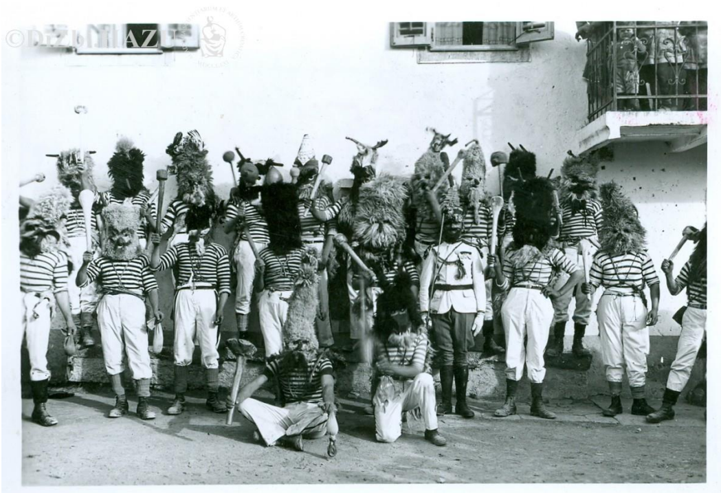
Slika 2. Zvončari 1949. godine