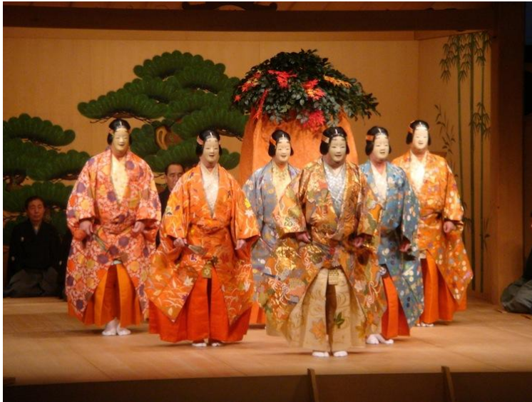
Slika 1 Noh Kazalište

stvorenja, koristeći pritom maske koje prikazuju određene likove. Noh kazalište prati i tzv. Kyogen - komični dijelovi izvedeni između glavnih Noh performansi. Satirični su i vrlo