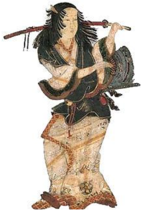
Slika 4 Izumo Okuni

Kreirala ga je jedna dvorska dama po imenu Okuni koja je prebivala u Izumo hramu. Izvela je jedan „čudan“ ples, koji nitko do sada još nije izveo ni vidio. Na sebi je imala šarenu maramu, goleme ogrlice, dugačku haljinu i razne narukvice. Odjevena pod utjecajem mode iz Portugala, Okuni, je za tadašnji Japan bila veoma čudno obučena. Njeni performansi u drevnom glavnom gradu Kyotu prouzročili su senzaciju. Mnoge djevojke su htjele imitirati taj ples (među njima je bilo jako puno prostitutki) i stoga