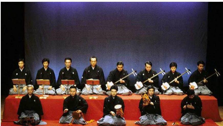
Slika 10 Orkestar

Srž kabuki predstave jest u stvari ples. Bujo znači na starojapanskom igra ili ples, pa tako imamo Noh bujo (ples Noh drame), kabuki bujo (ples kabukia), Nihon bujo (japanski ples) itd. Podvrste plesa čine mai , odori , shigusa . Ova tri naziva označavaju tri različite tehnike koje se u plesu ( bujo ) koriste pojedinačno ili zajedno. Mai je opći naziv za tehniku plesa koja se koristi u Noh kazalištima. Postoje razne vrste ove plesne tehnike. Shigusa označava gestu plača, smijeha, emocije koje su pojačane mimikom ili plesom. Isto tako, važan je i položaj