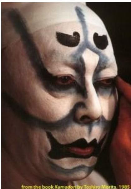
Slika 2 Šminka prikazuje zlog lika

Ichikawa Danjuro II. (1673.), tvorac Aragoto kazališta, je za vrijeme svog prvog nastupa obojao lice koristeći crvenu i crnu šminku, suvremeni primjer su samurajski junaci. Ta kompleksna šminka korištena u Aragoto Kabukiju kao što smo rekli zove se kumadori .