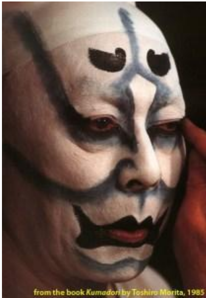
Slika 2 Šminka prikazuje zlog lika

Ichikawa Danjuro II. (1673.), tvorac Aragoto kazališta, je za vrijeme svog prvog nastupa obojao lice koristeći crvenu i crnu šminku, suvremeni primjer su samurajski junaci. Ta kompleksna šminka korištena u Aragoto Kabukiju kao što smo rekli zove se kumadori .