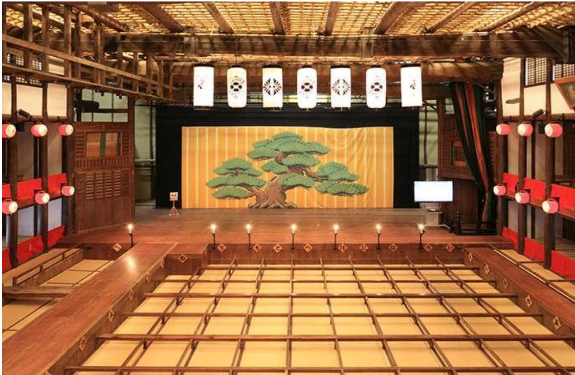
Slika 8 Izgled kabuki pozornice

Tako je izgledala pozornica do i za vrijeme 17. stoljeća. Primjećujemo da, kako je vrijeme odmicalo, događale su se i određene promjene u izgledu pozornice i njezinim dijelovima. Dalje se izgled formirao na temelju tri dominantna faktora: podmetnutih požara, državne politike i postepeno odmicanje od Noh kazališta.