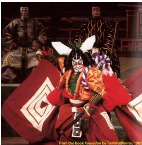
Slika 1 Živuci specijalni efekt

Kao što je Toshiro Morita rekao, kostim, šminka, i kretnja glumca stvara kvalitetu koja je pomalo skulpturalna, upotpunjuje izgled i daje unikatan potpis Kabuki kazališta. Kako bi bila kontra dotadašnjih konvencionalnih maski Noh kazališta, Kabuki je stvorio novi umjetnički izričaj - šminku radi postizanja ekspresivnosti. Noh maske su skrivale lice glumca i lišile su ga prirodnih izraza lica, dok umjesto toga veći izričaj je imala kretnja tijela. Ideja za takvim načinom šminkanja vjerojatno je potekla iz drevnih religijskih rituala, pa je kroz vrijeme