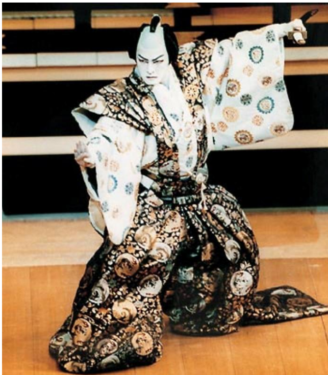
Slika 12 Mie poza

Hashimaki no Mie (poza poslije zamatanja) Isto tako smiješnog naziva, zauzima pozu tako da