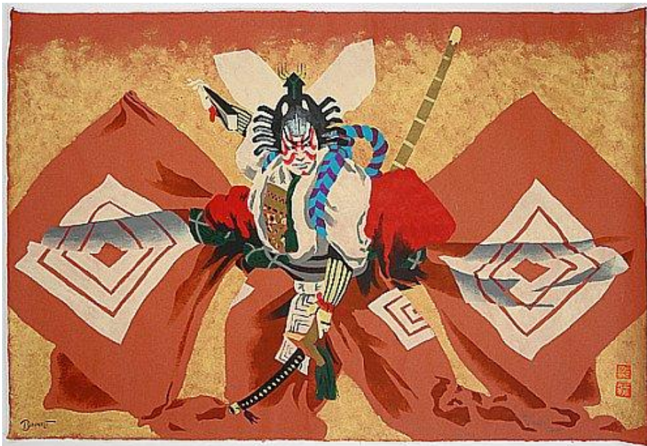
Slika 11 Aragoto Kabuki

Posebna vrsta kabuki plesa, zove se henge , te je mješavina puno različitih stilova plesa. Henge je takav da glumac igra nekoliko uloga za redom, te je svaka drukčija i vidljiva kroz kostimografiju. Rekviziti za henge ples su, mačevi, lule i fenjeri, ali od svih su najvažniji lepeza i tenugui . Tenugui je vrsta višenamjenske marame, koja se u svakodnevnom životu koristi kao npr, traka za kosu, šal, maramica itd. Specijalno za kazalište, tengui je napravljen od svile te ima neku vrstu identifikacijskog grba na sebi. Na kraju predstave se ovi šalovi bacaju u publiku, ako se predstava svidjela publici..