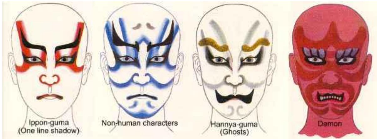
Slika 3 Stilovi šminke

zbog prekomjerne upotrebe alkohola. Laički rečeno, crte na licu označavaju vene, koje u različitim ekspresijama glumcu pomažu u postizanju željenog efekta .