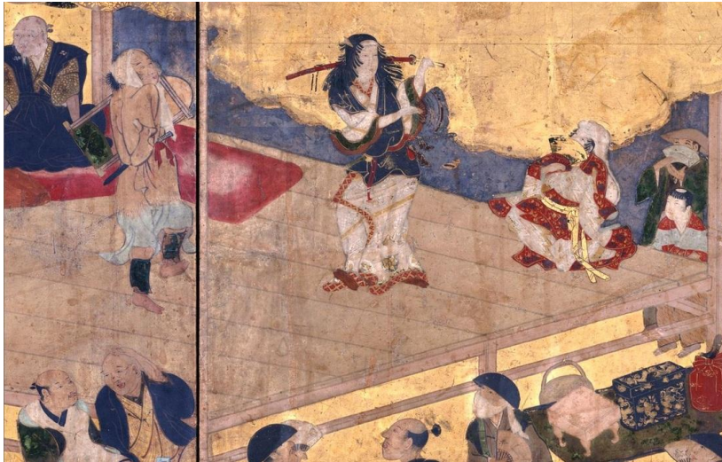
Slika 5 Izumo Okuni performans u Kyoto-u

Od svih vidova umjetnosti, kazalište je najmanje prenosivo iz jedne kulture u drugu osim ako kulture nisu slične. Zbog bojazni od pobune, šoguni su izolirali Japan pobojavši se velikog utjecaja Španjolske i Engleske koji su opskrbljivali oružjem japanske seljake. To su bili uvjeti