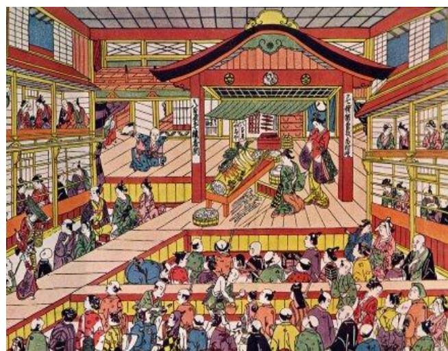
Slika 6 i 7 Kabuki-za danas i Kabuki-za unutrašnjost u 18 stoljeću (Tokio)

Kada je 1923. iznimno razorni potres pogodio Japan, prouzročivši goleme štete, stradala su i Kabuki kazališta. Znamo da je u to vrijeme u Japanu bila Meiji era ili era u kojoj Japan je pod