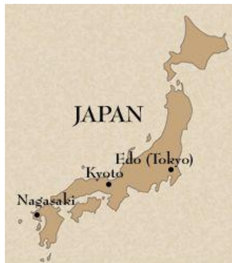
Slika 2 Kartografski prikaz Japanskih otoka

Japan je bio izoliran od utjecaja Zapada, osim Kine i Koreje, sve do velikih zemaljskih otkrića. Prvi koji su stupili na japansko tlo bili su Portugalci u 16. stoljeću, koji su došli sa idejom pokrštavanja naroda i razmjene kulture. Tadašnji japanski vladar je bio Oda Nobunaga i srdačno ih je primio i podupirao je kršćanstvo kao protutežu budizmu. No tada dolaze šoguni 2 na vlast a s njima i period Tokugawa obitelji. Kada je Tokugawa Ieyasu 1603. godine dobio titulu šoguna, počela je centralizacija države, koju će mnogi pobunjenici probati srušiti, ali neće uspjeti. Preselio je prijestolnicu iz Osake u tadašnji Edo (danas Tokyo). Bojao se pokrštavanja i svaki kršćanski ustanak je krvavo ugušio, i time je počelo iskorjenjivanje kršćana i svega što je došlo sa Zapada do tada. Vlada je postala vojna, šoguni i samuraji su vladali zemljom. Vladar se bojao pobune i stoga je donio odluku da ponovo izolira Japan od vanjskog utjecaja. Trgovci su doduše smjeli pristajati u određene luke ali nisu se smjeli kretati Japanskim otokom.