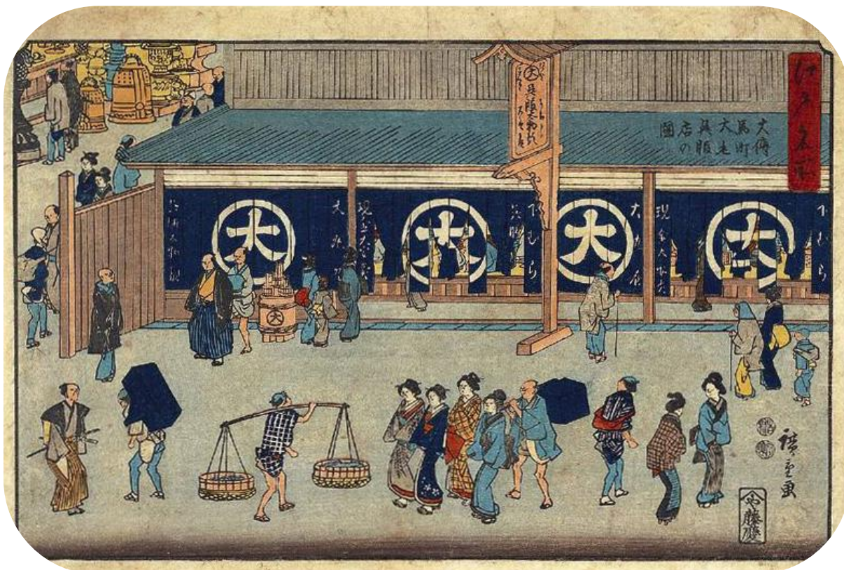
Slika 3 Ukiyo-e drvorez u boji .koji prikazuje društvo Edo perioda u Japanu

Pod utjecajem stroge politike izolacije bakufu-a (vojne vlade), svima nižima od plemstva je zabranjen 1637. izlaz iz zemlje, a 1641. prekinut kontakt s vanjskim svijetom, premda je luka Nagasaki ostala jedina luka koja je tolerirala trgovce zbog diplomatskih odnosa sa Kinom i Korejom. Ieyasu je dakle totalno Japan odvojio od svijeta, te uveo vojnu i strogo kontroliranu državu. No baš zbog takvog režima, sve što je trebalo biti zabranjeno i potisnuto, je naprosto procvatilo. Nastali su novi umjetnički stilovi, kao što su, u kazalištu, Kabuki te Bunraku , a u slikarstvu Ukiyo-e , drvorez u boji.