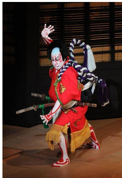
Slika 9 Mie poza

Nije oduvijek postojao scenski asistent, no njegovo postojanje je uvelike cijenjeno i potrebno glumcima. Tako je Nakamura Nakazao prvi poznati Kabuki glumac za svoje vrijeme od 1736. godine do 1790. godine glumio u većini Kabuki kazališta i predstava, kako u državnima tako i onih ilegalnih, te je bio