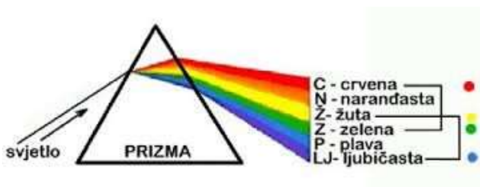
Slika 3. Prikaz Newtonova pokusa sa prizmom [5]

Za Goethea sve boje nastaju iz sive, iz mutnog. Goethe to objašnjava ovako: Sunčeva je svjetlost u biti bezbojna. Ali kada je nebo pokriveno oblacima ili kada se Sunce promatra kroz mutno prozorsko staklo, onda se Sunčeve zrake čine žutima. Što se više zamuti Sunčevo svjetlo, to je intenzivnija njegova boja: u sumrak i u zoru čini se tamnocrvenim. Prema Goetheu, boje također nastaju iz tame, tako da se crnilo zamuti: ako se crno noćno nebo promatra kroz svijećom osvjetljeno, blago mutno staklo, nebo se čini ljubičastim. Što je staklo mutnije, to se nebo čini svjetlije i plavije. Tako iz mutnosti nastaju: žuta, crvena i plava, osnovne slikarske boje, objašnjava Goethe. Svojim Naukom o bojama objavljenim 1810. godine Goethe je želio opovrgnuti Isaaca Newtona, koji je slavljn kao najgenijalniji prirodni znanstvenik svih vremena. Goetheov Nauk o bojama sastavljen je od tri dijela: Didaktičnog dijela, Polemičkog dijela i Materijala za povijest nauka o bojama. Najvažniji je Polemički dio, njegov je podnaslov program: Raskrinkavanje Newtonove teorije. Newton je jedno stoljeće prije Goethea pokazao da Sunčeva svjetlost sadrži sve boje: usmjerio je zraku svjetlosti na jednu stranu trobridne prizme, prizma raspršuje zraku i ona se na drugoj strani projicira kao spektar duginih boja: crvena – narančasta – žuta – zelena – plava – plavoljubičasta–crvenoljubičasta. Tako je Newton zaključio da je bijela svjetlost zbroj svih boja.