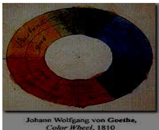
Slika 4. Goetheov krug boja [5]

kojima se temelji Goetheov nauk o bojama. On je želio utemeljiti prirodnu filozofiju koja bi ujedinila sve znanosti. Sa svojom filozofijom prirode Goethe je htio nadmašiti prirodnu znanost. Goetheova filozofija nije revolucionirala znanost, ali je neugodnu pozornost privukla žestina kojom je napao Newtona. Tvrdio je da su Newtonovi eksperimenti prekomplicirani i to samo radi toga ne bi li toliko zavarali ljude da slijepo povjeruju njegovom nauku. Goethe je znanstvene eksperimente smatrao hokuspokusom, a Newtona varalicom koji je sugerirao optičke fenomene koji, ustvari, nisu postojali. Samo onaj koji poznaje silu samozavaravanja i zna da ona graniči s nepoštenjem, moći će objasniti metodu Newtona i njegove škole. Goethe je tvrdio da će dokazati kako Newton radi kako bi neistinito pokazao istinitim, a istinito neistinitim. Ali unatoč velikom obožavanju na koje je nailazio taj pisac, njegov nauk o bojama naišao je na hladno odbijanje. Goetheu se predbacivalo isto ono što je on predbacivao Newtonu: da promatra jedino fenomene koji podržavaju njegovu teoriju. Budući da je osim toga odbijao znanstvene postupke mjerenja, njegove se tvrdnje i nisu mogle provjeriti. Goetheova teorija počinje sa sivom. Prema njegovu načelu polariteta, prirodno jedinstvo tvore one boje koje zajedno daju sivu, dakle, komplementarne boje. To su parovi: crvena–zeleni, žuta–ljubičasta, plava–narančasta i polarnost crna–bijela. Načelo pojačavanja također ukazuje na sivu, a pojačavanje je zamućenje.