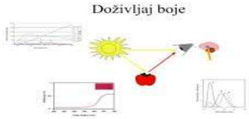
Slika 1.a) Prikaz nastanka boje u oku [5]