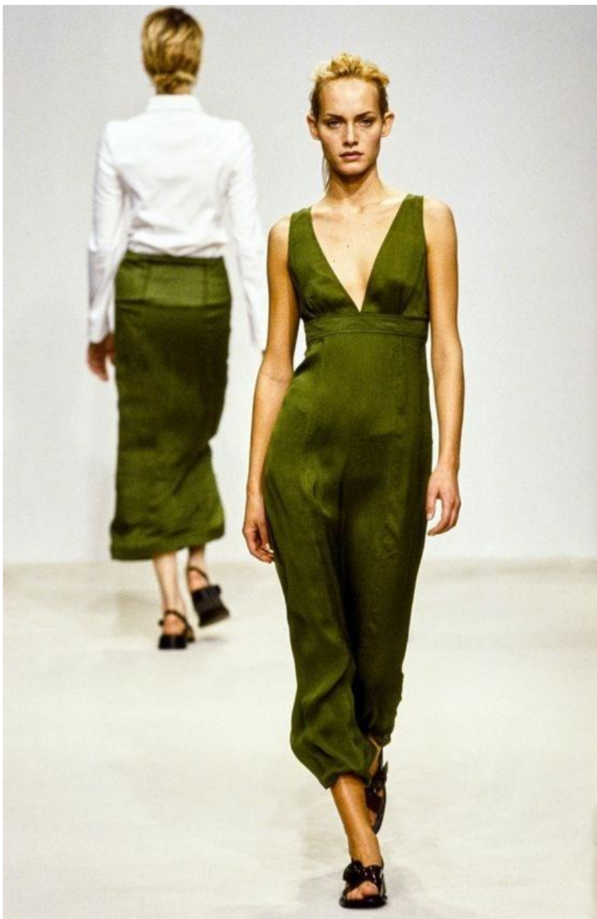
Sl.16. Prada S/S 96

Propitkivanje ružnoće u svijetu ljepote nije postavila samo kroz odjeću nego i stvarne žene, modele. Devedesete su poznate i kao era supermodela – Linda Evangelista, Naomi Campbell, Claudia Schiffer, Cindy Crawford, modeli koji su predstavljali ideale ljepote i sve ono čemu svaka žena treba težiti. Često je pozornost medija i javnosti bila usmjerena na njih više nego na odjeću koju su nosile. Na gore navedenoj modnoj reviji Pradini modeli bili su kratkokosi, mršavi, ni po čemu slični modelima koji bi inače šetali modnim pistama.