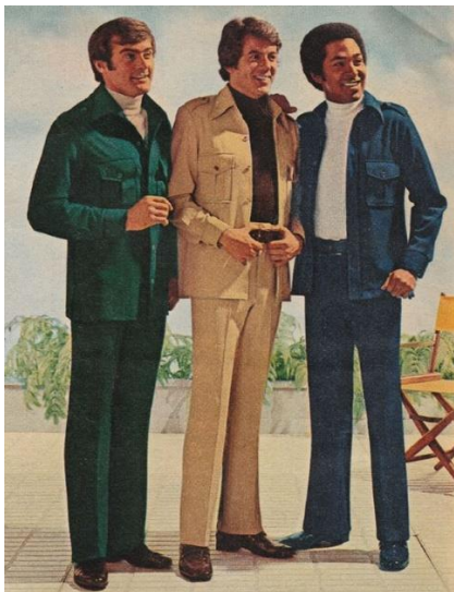
Slika 11. Ležerno odijelo.

opuštenijeg stila. „Alternativa poslovnim odijelima razvijena je za ležerno nošenje.“ (Tortora, Eubank, 2010:569).