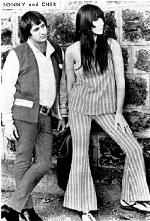
Slika 5. Cher nosi Trapezice, 1968. Wikipedia , Public Domain.

Obične traperice su također postale simbol bunta među mladim ljudima. Traperice su prvotno bile radna odjeća, no kasnije su postale ikona otpora protiv nezadovoljavajućih društvenih normi. „ Tijekom 1960-ih godina, mladi ljudi koji su prosvjedovali protiv establišmenta usvojili su traperice kao simbol solidarnosti s radničkom klasom. „ (Tortora, Eubank, 2010:537). „ Povezanost s kontrakulturom naglašena je za američku javnost 1960-ih godina kada su traperice postale svojevrsna uniforma za mlade prosvjednike protiv rata. „ (Tortora, Eubank, 2010:537). „ Kršenje uspostavljenih normi u odijevanju može uzrokovati da se pojedinci ili grupe osjećaju prijeteće, pogotovo ako "radikalni" novi stilovi budu usvojeni od strane skupina koje dovode u pitanje postojeće društvene vrijednosti ili nastoje izazvati status quo. Mnoge promjene u modi koje su započele u Sjedinjenim Američkim Državama 1960-ih godina upravo su to činile. Autoritet su izazivali "klinici" s dugom kosom, Afroamerikanci u dashijima i afro frizurama, žene u poslovnim odijelima i djevojke u kratkim, kratkim suknjama. „ (Tortora, Eubank, 2010:544).