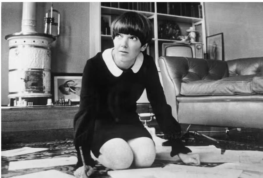
Slika 14. Mary Quant, Getty Images.

Šezdesete i sedamdesete godine 20. stoljeća bile su značajna desetljeća za modu, obilježena inovativnošću, buntom i odmakom od tradicionalnih stilova. Tijekom tog razdoblja istaknuli su se neki dizajneri koji su dali značajan doprinos modnoj industriji tog vremena. Mary Quant bila je britanska modna dizajnerica koja je imala veliku ulogu u modnoj industriji 1960-ih godina. Najpoznatija je po popularizaciji mini suknje, koja je postala kulturni simbol seksualne revolucije mladih. „Nova kultura odijevanja koju je Quant pomogla promovirati nije bila samo pitanje modne odjeće. Bila je izgrađena na socio-ekonomskim temeljima tog vremena i odražavala je, u smislu odijevanja, ključne brige desetljeća. Tako je utjecala na nove percepcije i stavove prema spolu, klasi, mladima i modernosti. Stoga se moda Mary Quant, umjesto da se jednostavno ističe zbog svoje neobične estetske privlačnosti, treba promatrati kao karta složene međugre između individualnih identiteta, društvenih običaja i odijevanja.“ (Chloe, Jian, 2016:284).