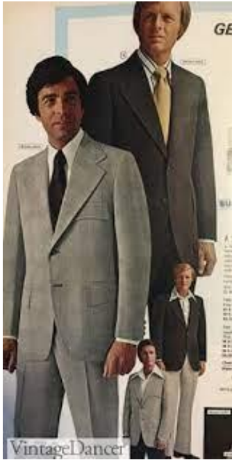
Slika 8. 1973. sivo i smeđe odijelo, Vintage Dancer.

vlakana bile su široko korištene, a hlače su imale tendenciju širenja na dnu. Odiijela su bila jednoredna i dvoredna, iako su jednoredni stilovi prevladavali. U drugoj polovici 1970-ih trodijelna odijela s prslucima, koja su bila u opadanju od 1930-ih, ponovno su se vratila. Reveri su se suzili i produžili. Krojevi su postali opuštjeniji. Muška odijela bila su konzervativno krojena, obično dvoredna, izrađena u tamnim bojama i glatkim tkaninama. Porast interesa za modu među muškarcima bio je praćen snažnom promocijom u medijima, a publicisti su počeli govoriti o "revoluciji u muškoj odjeći".“ (Tortora, Eubank, 2010:567).