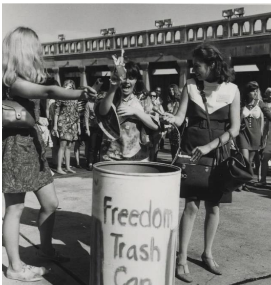
Slika 12. Miss America protest, Alix Kates Shulman Papers / Rubenstein Rare Book & Manuscript Library, Duke University.

Šezdesete i sedamdesete godine 20. stoljeća bilo je razdoblje borbe za ženska prava. Žene su ulazile u muško dominirana zanimanja, a kao način protestiranja koristile su modu. „ Neke feministkinje 1960-ih također su vidjele odjeću kao simbol opresije. Kako bi dramatzirale svoje oslobađanje od društvenih kao i fizičkih ograničenja te prosvjedovale protiv natjecanja za Miss Amerike, koje su smatrale glorificiranjem žena isključivo zbog njihove ljepote, nekoliko je feministkinja demonstriralo i spalilo grudnjake ispred natjecanja u Atlantic Cityju u jesen 1968. godine. „ (Tortora, Eubank, 2010:538).