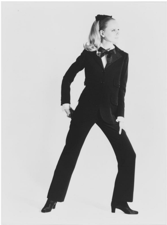
Slika 15. Le smoking odijelo, Yves Saint Laurent.

„Tijekom 1970-ih, Le Smoking je doživio veliki porast popularnosti. Godine 1971., smoking jaknu nosila je Bianca Jagger Perez-Mora Macias na svom vjenčanju s Mickom Jaggerom. Brojne druge slavne osobe, uključujući Lizu Minelli, LouLou de la Falaise i Lauren Bacall, također su bile poznate po nošenju tog izgleda. Nema sumnje da bez Le Smokinga ne bismo imali trend power dressinga koji je dominirao drugom polovicom 1970-ih i tijekom 1980-ih. Ovaj važan pokret bio je vođen željom žena da se osjećaju i ženstveno i moćno u profesionalnim situacijama kojima su tipično dominirali muškarci.“ (Gray, 2022).