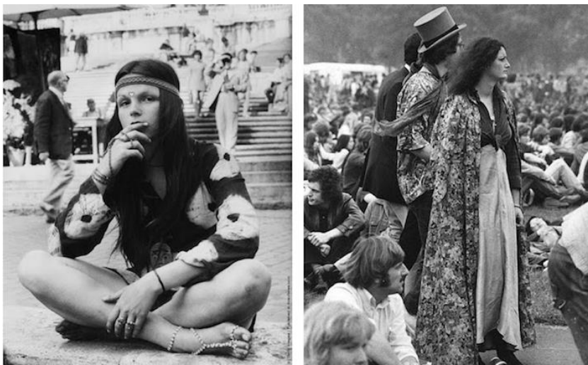
Slika 6. Moda hipija

Članovi hipi pokreta razvili su jedinstveni način oblačenja kojim su pokazivali svoje neslaganje s tadašnjom normom. Članovi hipi pokreta nosili su duge lepršave haljine i suknje, nosili su traperice i „tie-dye“ majice.