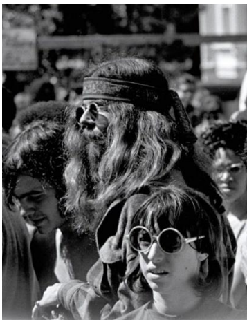
Slika 7. Hipiji s dugom kosom