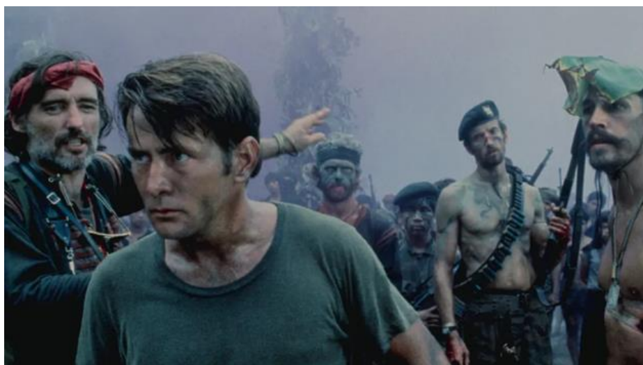
Slika 2. „Apokalipsa danas“

Filmovi koji su prikazivali Vijetnamski rat također su imali utjecaj u oblikovanju javne percepcije. Film „Apokalipsa danas“, snimljen 1979. jedan je od poznatijih primjera te je taj film analizirala autorica Ana Majčica u svom radu „VIETNAM WAR IN US MEDIA“. Analizirajući ovaj film Ana Majčica je došla do zaključka da je najveća dilema Vijetnamskog rata prikazanog u ovom filmu bilo pitanje tko je „dobar“, a tko „loš“. „S obzirom na to da interpretacija ovakvih filmova može biti vrlo subjektivna, postavlja se opće pitanje je li taj film anti-ratni ili pro-ratni.“ (Majčica, 2021:229). Redatelj Francis Coppola, objašnjava autorica, je izjavio kako je „Apokalipsa danas“ politički neutralan film te je njegova izvorna namjera bila prikazati kako se mučenje i ubijanje predstavljaju kao moralno prihvatljivim činom cijeloj naciji. (Majčica, 2021:229).