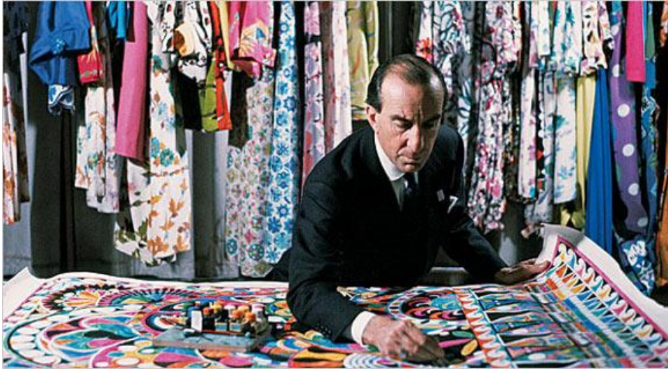
Slika 16. Emilio Pucci, Famous Fashion Designers.