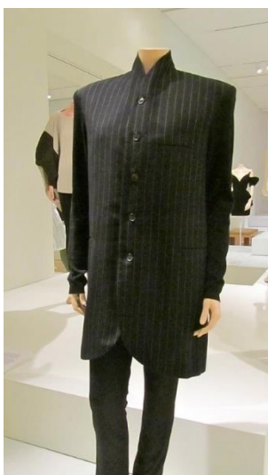
Slika 10. Nehru odijelo, File:Yohji Yamamoto wool suit c 1990.jpg.

Autorice u ovoj knjizi opisuju odjevne predmete koje su muškarci svakodnevno nosili. „Puloveri iz 1970-ih godina prijanjali su uz tijelo, završavajući tik ispod struka. Krajem 1970-ih puloveri su postali veći i opušteniji. Od ranih 1960-ih dolčevite su bile prihvaćene kao alternativa košuljama s ovratnikom. Bile su dostupne u raznim stilovima i bojama.“ (Tortora, Eubank, 2010:569). „Košulje krojene i šivane tako da prate linije tijela, nazvane body shirts, bile su popularne 1960-ih.“ (Tortora, Eubank, 2010:569). U ovo vrijeme razvilo se odijelo