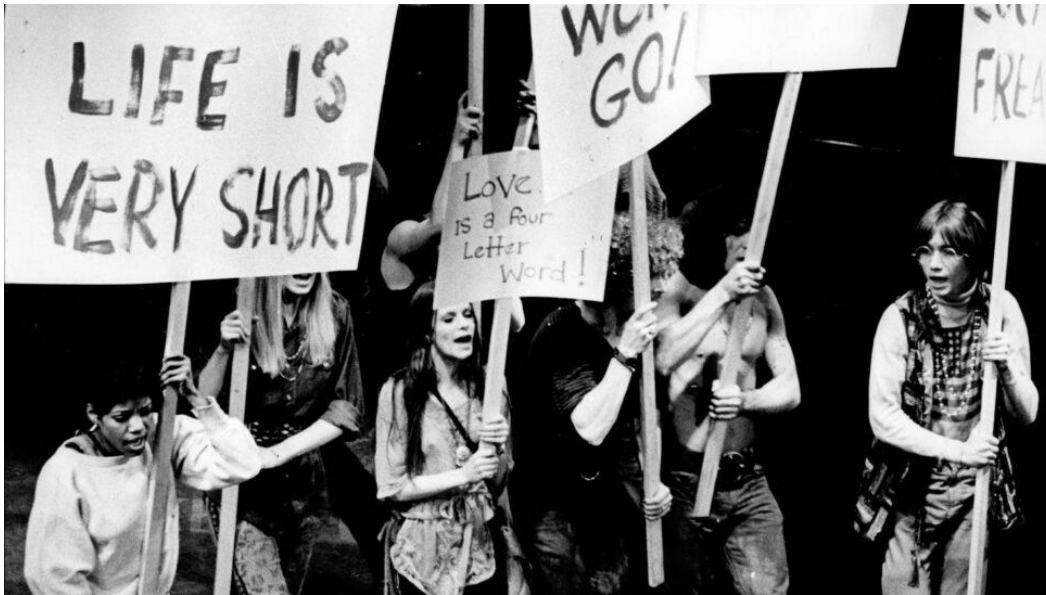
Slika 3. „Kosa“, Playbill

Kada je mjesec u sedmoj kući When the moon is in the Seventh House