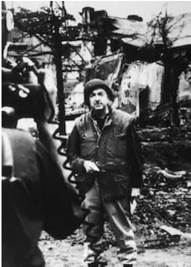
Slika 1. Walter Cronkite izvještava o Vijetnamskom ratu.

Nakon odlaska u Vijetnam 1968. godine mišljenje Waltera Cronkitea se promijenilo, te se samim time promijenilo i mišljenje većine Amerikanaca. Cronkite izjavio je "Reći da smo danas bliže pobjedi znači vjerovati, unatoč dokazima, optimistima koji su u prošlosti griješili. Predložiti da smo na rubu poraza znači popustiti nerazumno pesimizmu. Reći da smo zaglibili u pat poziciji čini se jedino realnim, ali nezadovoljavajućim zaključkom." (Bowden, 2018). Cronkiteov izvještaj bio je značajan. To je uvelike pridonijelo pomaku javnog mnijenja protiv rata.