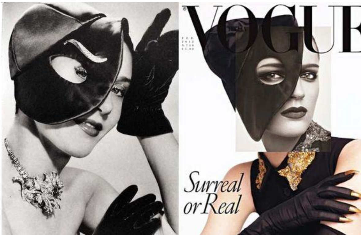
Slika 12. Nalovnica časopis Vogue iz 1949. i 2012. godine