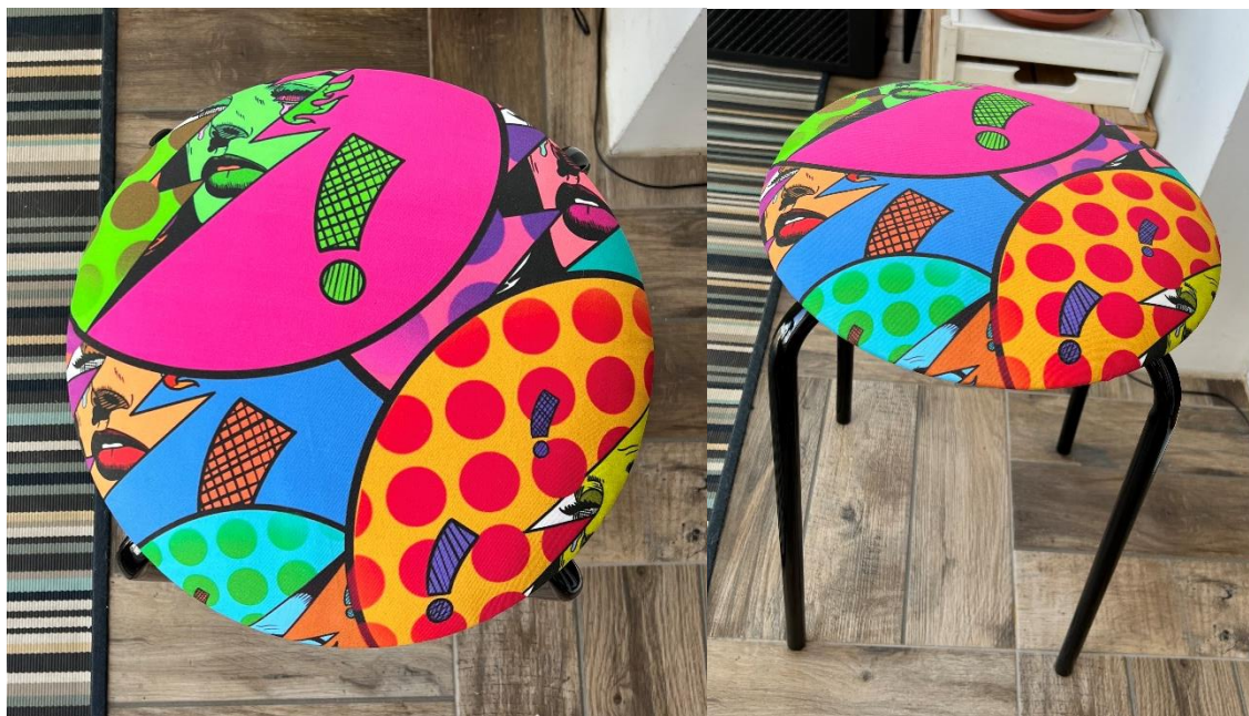
Slika 13. likovno rješenje rada „Energična Transformacija“