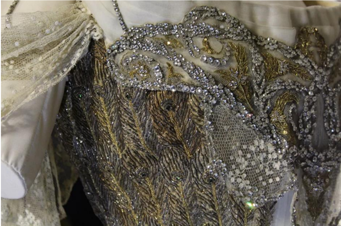
Slika 5. Detalji na dekolteu paunove haljine, prikazi perja, Quello che piaceva Valeria , Italija, https://quellochepiaceavaleria.com/en/worths-dress-with-peacock-feathers-worn-by-lady-curzon/ (Posjećeno 10.05.2023.)