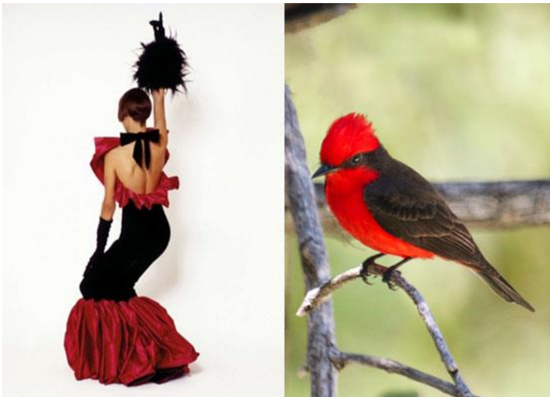
Slika 14. Desno: Yves Saint Laurent, model Talisa Soto, Vogue “ The New Vamps ” 1982. godine. Lijevo: Darwinova ptica muharica ( Pyrocephalus obscurus )