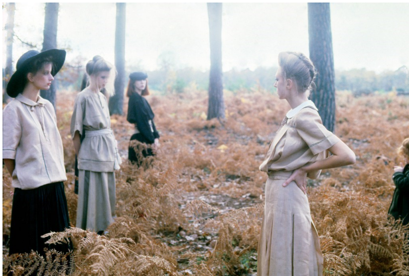
Sl. 5 D. Turbeville, Valentino Fashion , Vogue Italia, 1978.

najkarakterističniji dio fotografske slike, njenu oštrinu. Što je više fotografija bila nadomjestkom za sliku, to ju je više needucirana publika smatrala 'umjetničkom'. 18