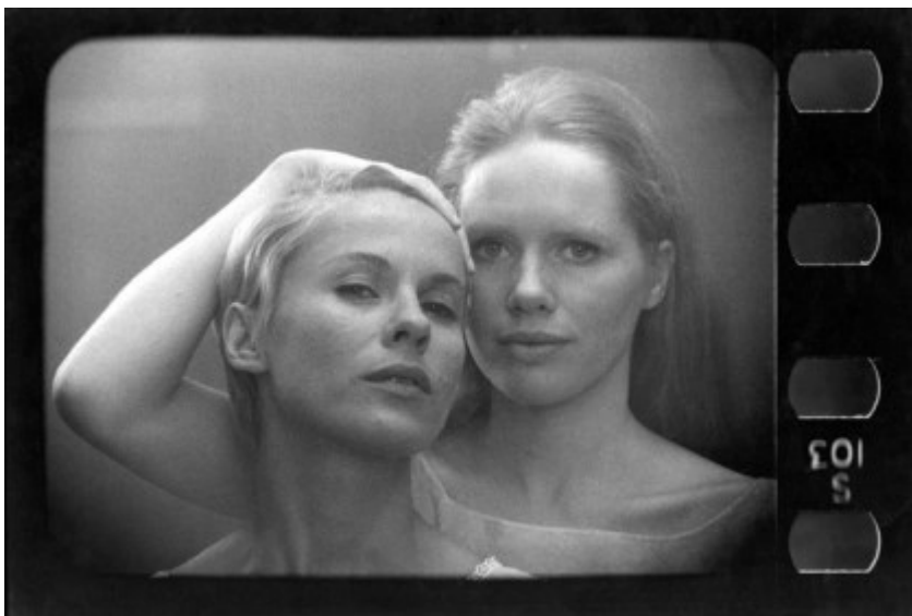
Sl. 11. Sven Nykvist, www.ingmarbergman.se redatelj: I. Bergman

onime čemu postmoderna nije sklona a to su velike naracije i ideje koje nisu na filmu popraćene sa dinamikom montaže niti sa prevelikim mijenjanima mjesta zbivanja. Kao da je mjesto zbivanja istodobno i čovjekov zatvor iz kojeg nema bijega, ali i kao jedino mjesto gdje se čovjek može suprotstaviti samome sebi i nadvladati svoju unutarnju borbu. Snimanjem na svega nekoliko lokacija i s vrlo malim brojem glumaca, Bergman postiže jedinstvo vremena i prostora. Ono lijepo što proizlazi iz filmova je usredotočenost na dramu koja se vodi unutar čovjeka, ali se očitava na njegovu licu koje zapravo dočarava potpunu atmosferu.