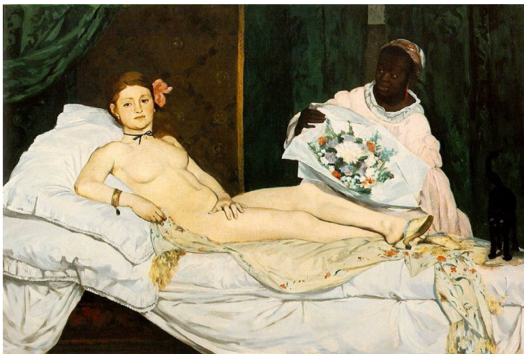
Sl. 6. E. Manet, Olympia , 1866. Pariz

Govoreći o položaju tijela, koji je vrlo bitan segment u radu Turbeville, nanovo se može povući paralela s Manetom: između njegova radom Olimpija 19 iz 1866. i fotografije nastale 1984. za kolekciju Emanuela Ungara.