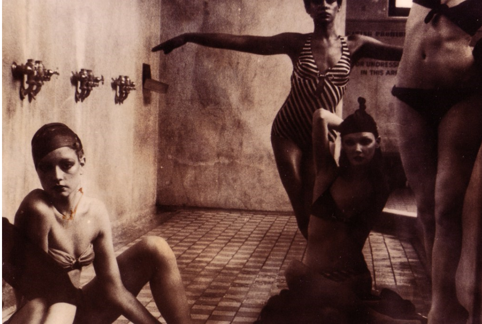
Sl. 1. D. Turbeville, Bathhouse serija, Vogue, 1975

poistovjetiti, spoznati. "Prevlast slike, prema tome, nije omogućena sveprisutnošću medija, nego trivijalizacijom interpretacijskih modela. Jesmo li sigurni da gledati znači vidjeti , a da znati vidjeti nužno znači i moći spoznati ?" 4 Možda bi zaista pogrešno bilo ipak tvrditi da se danas uopće možemo "emocionalno odrediti prema sadržaju ili najdubljem razlogu". 5