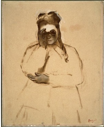
Sl.15. Degas, E., Women with filed Glasses , 1866.

snaga žene ili možda čak kako bi se naglasili tjelesni atributi kao njena najjača karakteristika, Degas ponekad smješta sebe iznad ili ispod svojih subjekata da bi dobio pritsupe drugačijim perspektivama, a Kendall pak takav pristup poistovjećuje s izražavanjem društvenog statusa, s obzirom da "sebe pozicionira iznad svojih subjekata samo kada slika žene radničke klase." 65