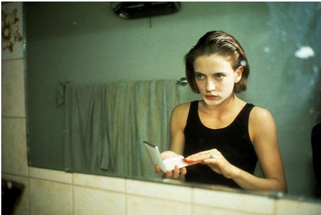
Sl. 9 N. Goldin, Amanda in the mirror , 1992.

isključivo na navedeno, oduzeli bismo joj kompleksnost i sve ostale aspekte koje sadrži. Položaj i geste tijela na fotografijama Turbeville ipak definiraju nešto značajnije. Promatrač se zaista zatekne ispred slike koja istodobno osvaja svojom estetskom privlačnošću, ali i budi intrigantni i pomalo jeziv osjet pitajući se što poručuju uspravne, statične figure čiji pogledi ne izazivaju ravnodušnost. Nalazeći se na granicama lijepog, zavaravajućeg, zavodljivog i onog ružnog, istinitog, neizbježnog, slike portretiraju vrijeme u kojem se društvo zateklo. A osjet takvog vremena ne jenjava. Kao vizualni dokaz tome, ali i propitivanju onoga ružnog, možemo priložiti usporedbu dviju fotografija snimljenih u razmaku od gotovo 20 godina. Ranije je već spomenuto koliki je utjecaj fotografija sedamdesetih imala na rad fotografa devedesetih godina prošlog stoljeća, koje se opisuju kao desetljeće traume, ogoljenosti i progona vlastitog sebstva, a sve to reflektiralo se i u modi.