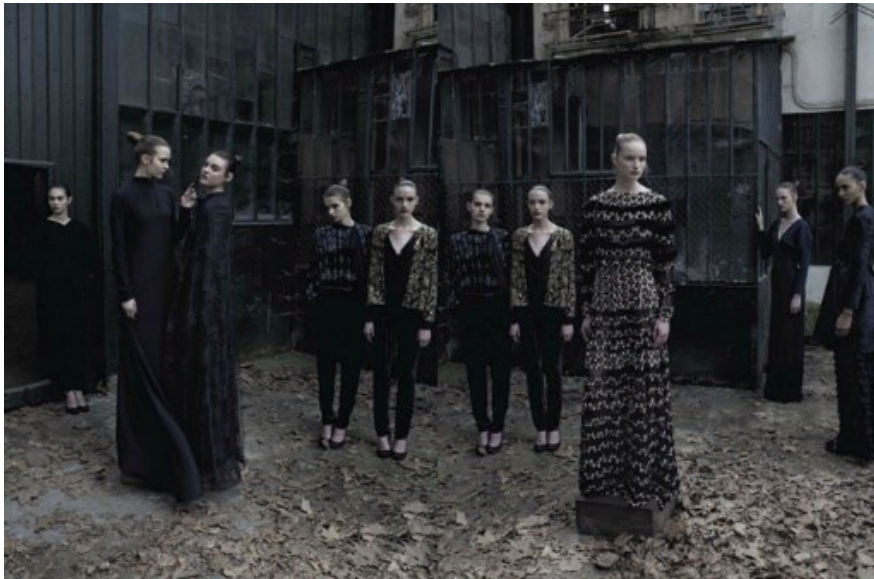
Sl. 8 D. Turbeville, Valentino Haute Couture , fall/winter 2012-13, Vogue Italia

dinamični susret na modnoj fotografiji. Kako opaža Lipovetsky "umjetnost se često nađe u ratu s dobrim ukusom i redovno stvara dislocirana, skandalozna i disonantna djela." 30