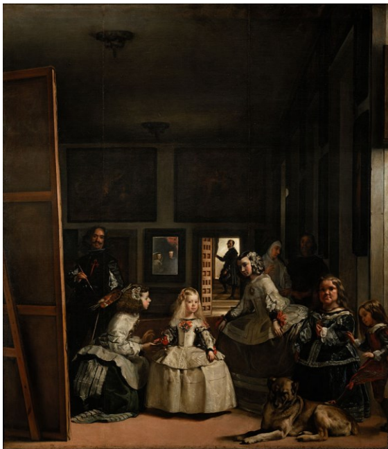
Sl. 3. D. Velasquez, Las Meninas (Male dvorske dame) , 1656. Madrid

desnoj strani, u samom prednjem i zadnjem pozadinskome kutu kao da se pokušava odnekud probiti danje svjetlo, dok u pozadini vidimo otvorena vrata, izvor svjetlosti, ali naziranje stepenica i zastora naslućuje da se možebitna otvorenost nanovo javlja prema zatvorenom prostoru. Pozadinski izvor svjetla kao da se odbija u prednju stranu i tako osvjetljava i donji dio slike. Prednja strana slike reflektira se u ogledalu na pozadini u kojem sasvim nejasno i maglovito razabiremo dvije figure koje nam sugeriraju da i tu postoji zatvorenost prostora. Naime, upravo taj odraz u ogledalu pruža osjećaj promatranja cijele slike iz njihove perspektive. Slikarev pogled usmjeren je prema nama – promatračima – te i na taj način smo potpuno uvučeni u cijeli prizor. Ova slika koliko je oduševljavala svojom mistikom i kompleksnošću, toliko je i zadavala vječite dvojbe svojim promatračima koji, nalazeći se na prednjoj strani bivaju nesigurni u svoju poziciju koja može odgovarati i poziciji likova čiji se odraz očituje u pozadini i poziciji ogledala. Slične motive pronalazimo i u ranije spomenutoj fotografiji Turbeville.