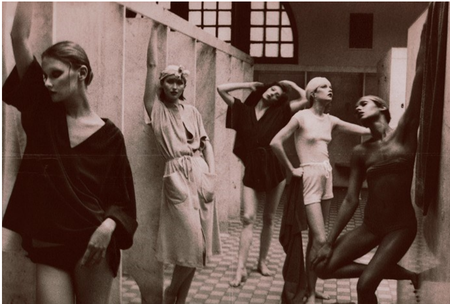
Sl.10 D. Turbeville, There's More to a Bathing Suit than meets the Eye , Vogue, 1975.

što je zaista istina? Koliko se uistinu prikazi šokantnosti i dislociranosti narcističkog društva u svojoj konstrukciji razlikuju od prikaza ideala savršenosti?