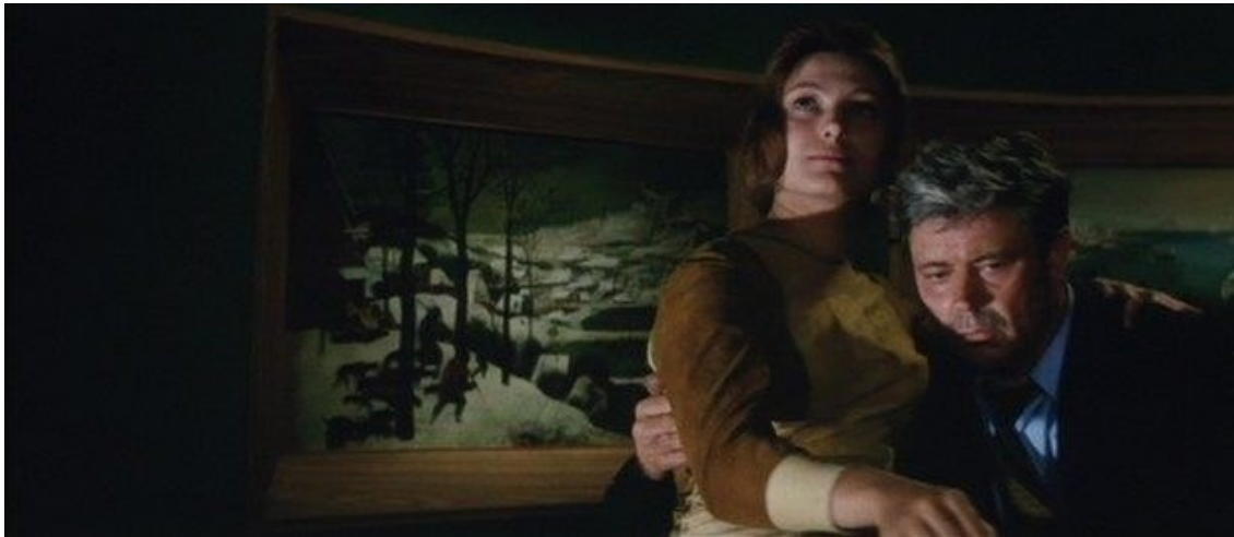
Sl. 12. Solaris , 1972. redatelj: A. Tarkovski

Za Tarkovskog film nije sinteza umjetničkih formi, već film kao forma umjetnosti postoji da bi nam pomogla odgovoriti na toliko važna filozofska pitanja koja se tiču života i postojanja. Njegov izričaj započinje pitanjem o smislu umjetnosti i njezinu utjecaju na pojedinca, ali i na društvo. Umjetničko stvaranje podrazumijeva sjecište na kojem se susreće i prepliće mnoštvo doživljaja, težnji. Ako nas slika želi odvesti u potragu za idealnim, ne možemo zaobići potpunu suprotnost idealnom. Ako želi težiti lijepom, mora nam pokazati i onu drugu stranu. Razumjeti što slika želi znači pristupiti njezinoj estetici, ali na emocionalnom nivou. "Film nije profesionalan, već moralan posao." 53 Kada bismo likove naslikane na platnu zamijenili s pokretnim glumcima, dobili bismo pokretnu sliku. Tarkovski ne kreće od direktne povezanosti slikarstva i filma, već traži ono nevidljivo, ali osjetno. 54 Atmosferu. Stvarajući Solaris upravo je htio oslikati atmosferu renesansnih slika Vittoria Carpaccia, na kojima je mnoštvo ljudi, ali kao da je svatko od njih sam. Ne postoji nikakav odnos među njima, kontakt osnovan bar na pogledima. Stvaranje ambijenta ključna je karakteristika i Turbeville. Njezini likovi uvijek odaju osjećaj osamljenosti bez obzira na njihovu brojnost na prikazu. Destruktivan odnos koji likovi imaju sa svojom okolinom naglašava se uvijek oštrim osjetom nostalgije. Osjećaj