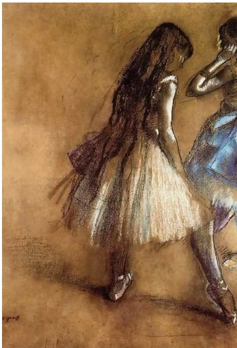
Sl.16. Degas, E. Two Dancers II izvor: edgar-degas.org

privilegijem koji je najčešće bio isključivo namijenjen muškarcima." (Wolin, E., Degas: Agency in Images of Women, www.portal.lvc.edu , str. 7).