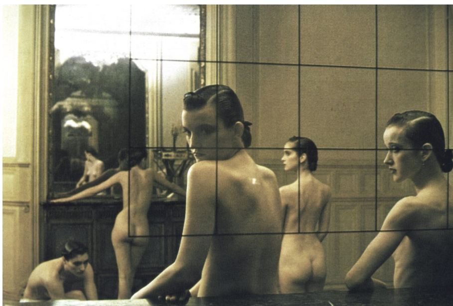
Sl. 4. D.Turbeville, Pet djevojaka u sobi u Pigalleu , Paris, Vogue Italia, 1982.