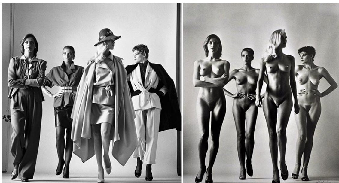
Sl. 14. Newton, H. They're Coming! , 1981.

kroz diptih stil prikazuje dominantnost ženskih figura. Kompozicija i osvjetljenje fotografija je nepromijenjeno, ali modeli su na jednom prikazu odjeveni, na drugom razodjeveni. Crno bijela tehnika, kao u većini njegovih radova, odbacuje boje kao moguće distraktore i tako se sva pažnja usmjerava na tonalitet, kompoziciju, ali i žene. Važnost modela na ovoj fotografiji podebljana je i neutralnom pozadinom. Ovdje nema ulica, hotelskih soba jer sva bitnost je sadržana u dominaciji žena. Uzimajući u obzir da je Newton izbjegavao prazninu fotografskih studija, još je dnom se naglašava važnost kojom pristupa figurama koje odaju isti dojam snage i potpuno odjevene i razodjevene. Noseći samo cipele i fotografiranjem iz lagano spuštenog kuta snimanja, želi se istaknuti ženino potpuno zauzimanje prostora. Ključna karakteristika, ali i poruka njegovog rada je da žena može biti i jaka i elegantna, odnosno u svakome ljudskom biću postoji dvojnost, postoji i maskulini i feminini dio. Reprezentacijom žene kroz erotičnošću nabijene elemente, Newtonov rad može se shvatiti kao direktna kritika društva koje ženu svakodnevno promatra i kritizira.