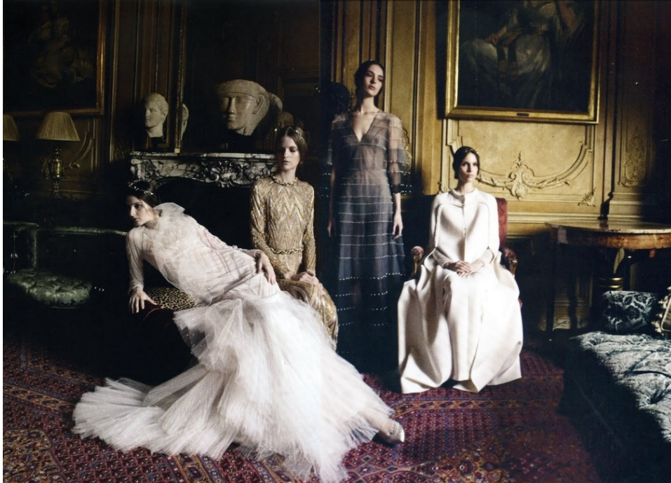
Sl. 13. D. Turbeville, Valentino FW2011-12, Vogue, Italia 2012.

neprispadnosti baš tome mjestu i tome vremenu, prikazani su pozadinskim motivima kadra, kako filmskog tako i fotografskog.