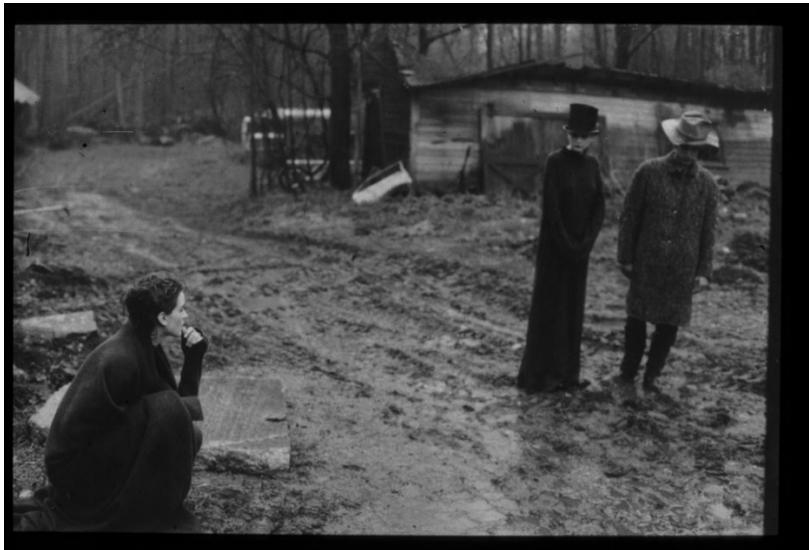
Sl. 2. D. Turbeville, Rainy day People , 1995.

nesavršenosti ukomponirala u svoj rad jednako kao što su ukomponirane i u život. Ako nam već fotografija želi priuštiti putovanje u nepoznato, osvrtnje k prošlosti koju čvrsto držimo pod rukom, onda nam mora pružiti mogućnost vidljive greške. Pogled uperen prema fotografiji pokušava ispružiti ruke i uhvatiti zadnju nit života koji iščezava. Lokacija igra vrlo bitnu ulogu u radu Turbeville. Pločice napuštenih kupališta, gole grane šume, tlo natopljeno kišom i prekriveno blatom; sve to budi sjećanja koja izvire na površinu. Iznad fotografija uvijek lebdi misterija, već toliko puta spominjana, ali lebdi i vizualni prijedlog. Moda je ovdje prerusena. Prikriva se u nelogičnim rezanjima, u zamagljenosti. Uništavanje fotografija zapravo onemogućava da imamo u nju potpun uvid. I ona je nedorečena, napola praznog fragmenta koji očekuje da ga ispuni objašnjenje promatrača. Upisivanje značenja događa se u trenutku kada se želi prekinuti nedovršenost, kada se želi spoznati što se nalazi u dvojnosti naše osobnosti.