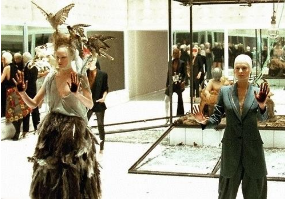
Slika 1. Alexander McQuenn spring/summer 2001”Voss”

djetinjstva gaji ljubav prema ornitologiji, polazi tečajeve za proučavanje struktura ptica tako da nije bilo neuobičajeno da je u kolekciju „Voss“ odlučio uklopiti preparirane ptice na ramenima odjevnih komada. Uz ornitološku ljubav, gajio je ljubav i prema povijesti često tražeći inspiraciju u svojim škotskim korijenima, engleskoj povijesti, osamnaestom i devetnaestom stoljeću te viktorijanskom razdoblju.