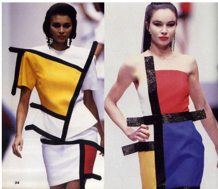
Slika 4 Francesco Maria Bandini Proljeće/Ljeto 1991.

U kontrastu sa Saint Laurentom, krojevi djeluju neskladno, anatomija je narušena prodorima u prostor orukavlja i pratećih ogavlja/šešira. Horizontalne i vertikalne linije iz Mondrianovih kompozicija također se snažno izdvajaju iz kroja prekidajući anatomske linije. Sve oko primjera talijanskog dizajnera je ekscesivno i napadno te se ne podliježe dojmu originala.