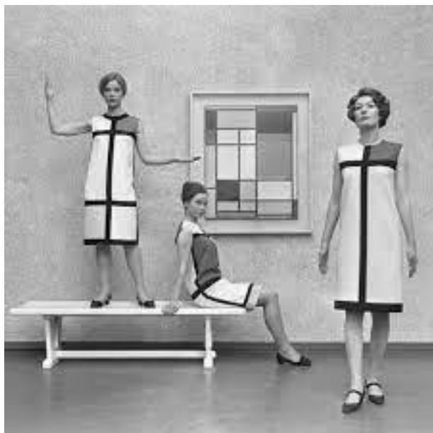
Slika 3 Yves Saint Laurent - Jesen/Zima 1965

U stvaranju kolekcije dizajner posvećuje izniman napor da prenese minimalistički utisak Mondrianovih kompozicija. Take će Saint Laurent prevesti originalne pravokutnike u iskrojene panele koji su ušiveni na način da se šavovi i krajevi tkanine ne prepoznaju. Odabir materijala ne remeti ravnotežu i mirnoću, ne kontrastiraju se teksture, površine, nabori i dr. Skrivanjem strukturalnih elemenata haljine stvara rezultat koji do krajnjih granica prenose čistoću i reduciranost originala. Boje su, kao i u izvorniku, svedene na tri primarne nijanse crvene, plave i žuta s kombinacijama bijele, crne i sive (ne-boje). Prepoznatljive horizontale i vertikale originala su strateški položene da sakriva ušitke haljine.