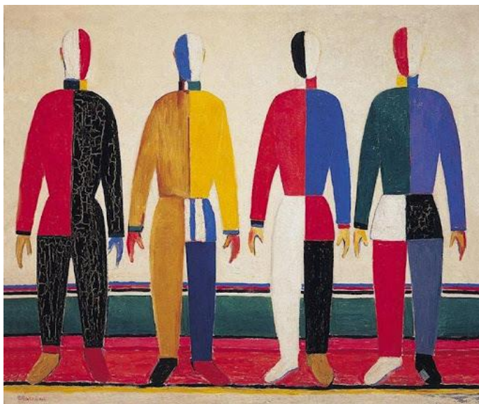
Slika 6 Kazimir Maljevič „Sportaši“ 1933.

Premda je motivu pristupljeno figurativno, što je gotovo oprečno suprematističkim djelima poput „Kvadrata na bijeloj podlozi“ iz 1917. godine, no „Sportaši“ su i dalje primjer suprematističkog slikarstva kojeg Maljevič u periodu od 1920 do 1930-ih godina obrađuje figurativno (Šuvaković, 2005, p. 601).