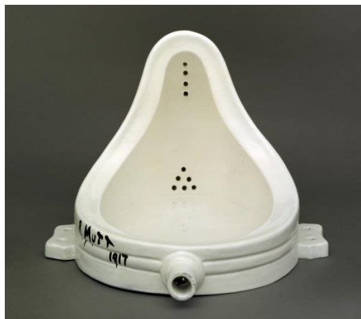
Slika 1 (lijevo): Sherrie Levine „Fontana (po Marcelu Duchampu)“