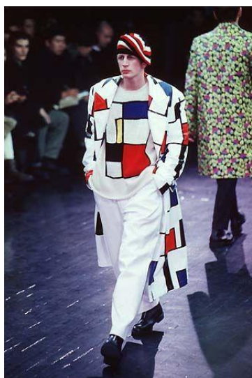
Slika 5 Yohji Yamamoto Jesen/Zima 1997.

Oba primjera posvetila su čitavu reviju modernističkom klasiku dok sljedeći primjer Yohia Yamamota ukazuje na nešto drugačiju praksu. Japanski dizajner poseže za kompozicijom samo za potrebe jednog modela – pletenog džempera i pripadajućeg kaputa.