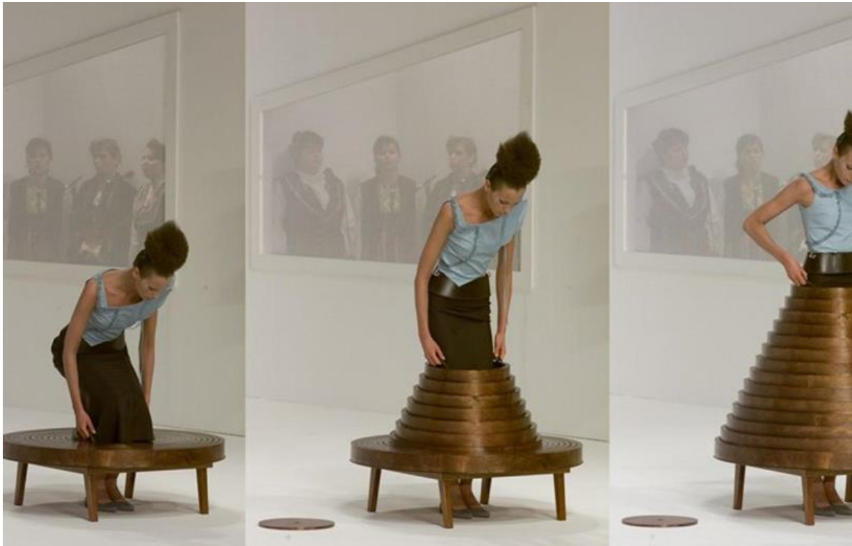
Slika 16: dizajn Husseina Chalayana, 2011. (izvor: posjećeno 12.01.2021. ).

Isti kustos stoji iza poznate izložbe ‘Madame Grès’(2011.) u muzeju ‘Bourdelle’ u Parizu gdje je Hussein Chalayan, uspio stvoriti dijalog između odjeće i skulpture kreirajući haljine od krutih i nenosivih materijala poput drveta, željeza i sl. Jasno je da suvremena moda nerijetko inspiraciju crpi iz povijesnih razdoblja pa čak i kada ona nije povijesno relevantna što ju čini umjetničkom formom jednako vrijednom kao svi ostali oblici umjetnosti.