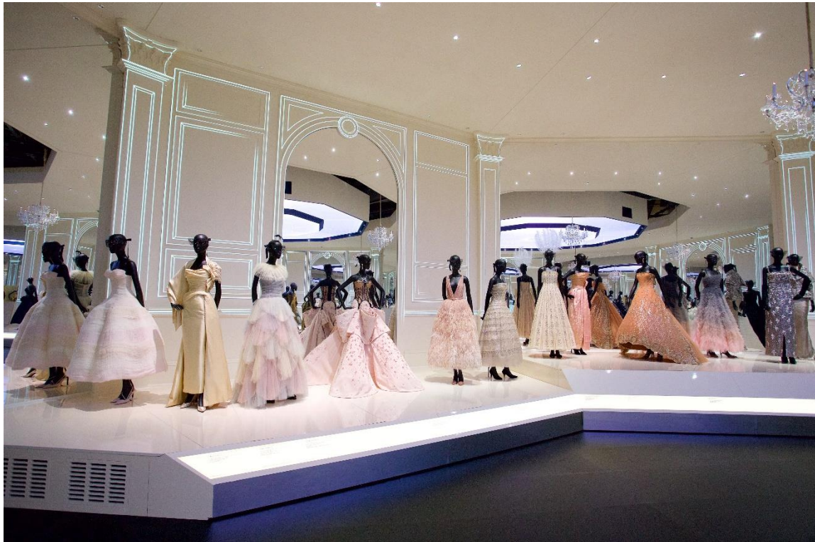
Slika 13: Izložba haljina Christiana Diora .

Koncept izlaganja mode te principi kolekcioniranja odjevnih predmeta znatno se mijenjaju 1993. godine izložbom Street style: from side walk to catwalk , kustosice Amy De La Haye. U muzeju je tada izloženo preko tristo odjevnih predmeta supkulturnih skupina Amerike i Velike Britanije. Bila je to jedna od najpopularnijih izložbi u Victoria & Albert Muzeju koju je nakon svega tri mjeseca pogledalo više od sto tisuća ljudi.