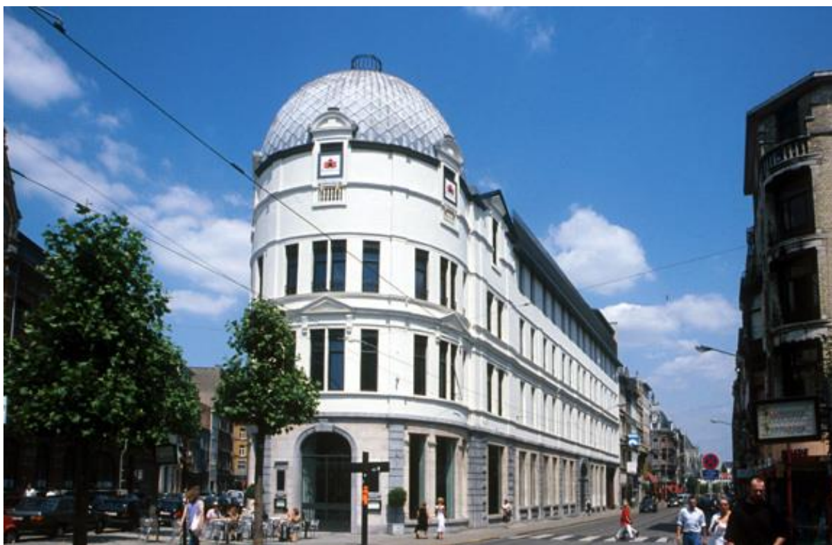
Slika 4: Mode Museum (MOMU, Antwerpen), 2016. (izvor: posjećeno 20.05.2021. )