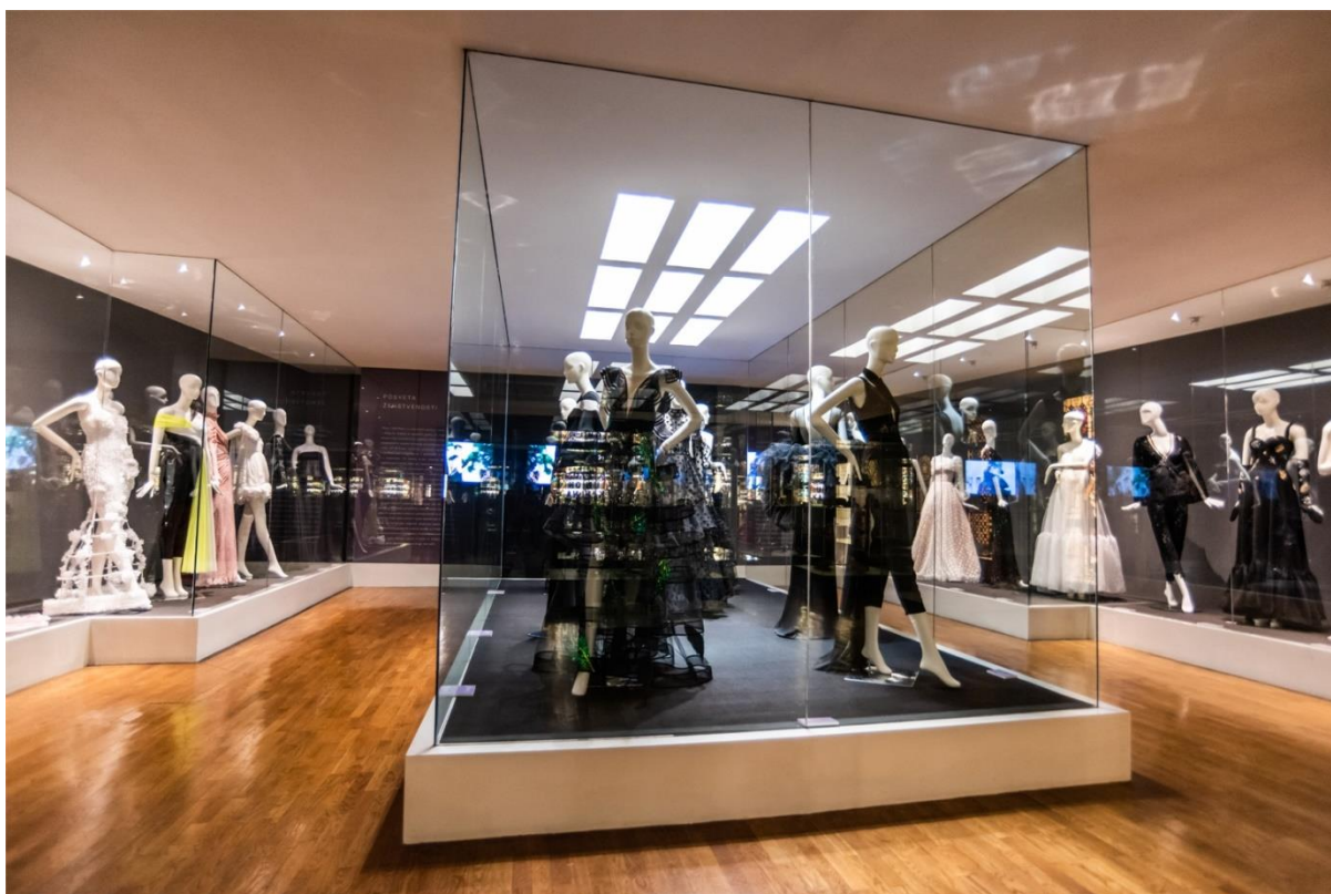
Slika 31: Izložba haljina eNVy room-a