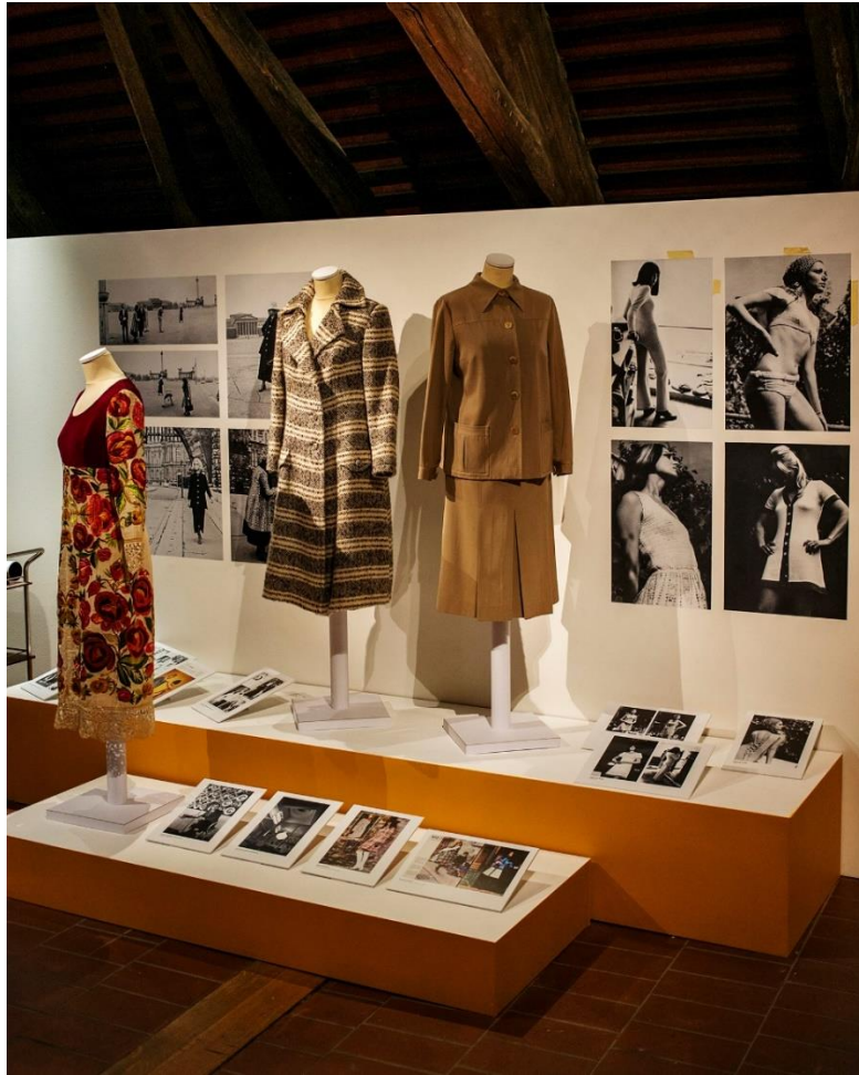
Slika 25: Izložba mode 60ih godina

Naziv izložbe: Moda i odijevanje u Zagrebu 1960-ih