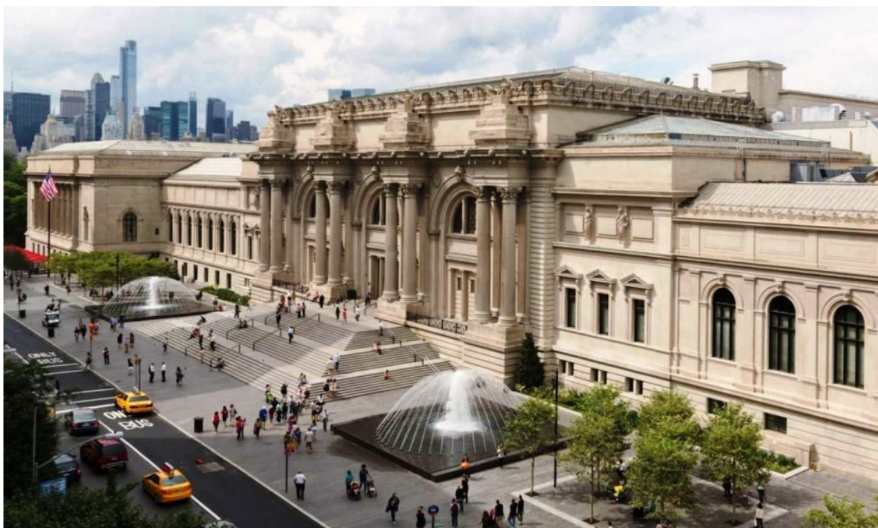
Slika 2: Metropolitan Museum u New Yorku, 2018. (izvor: posjećeno 20.05.2021. )