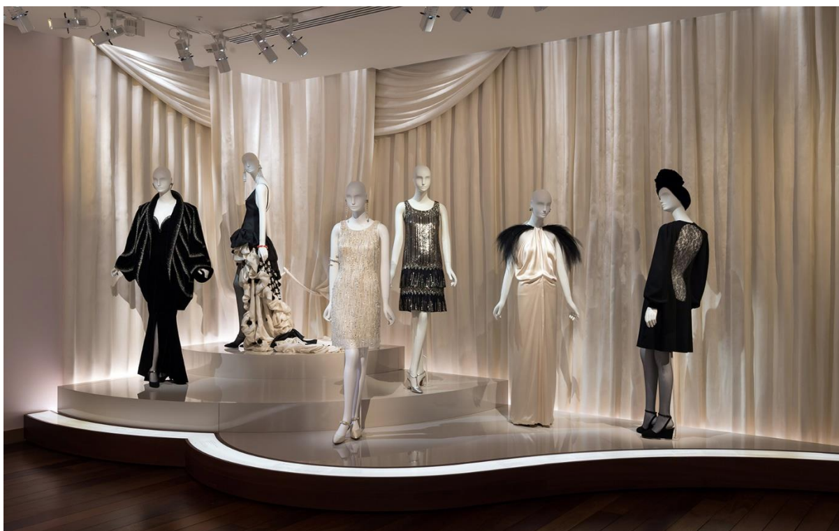
Slika 19: Kreacije Yves Saint Laurenta

Naziv izložbe: YVES SAINT LAURENT'S DIALOGUE WITH ART