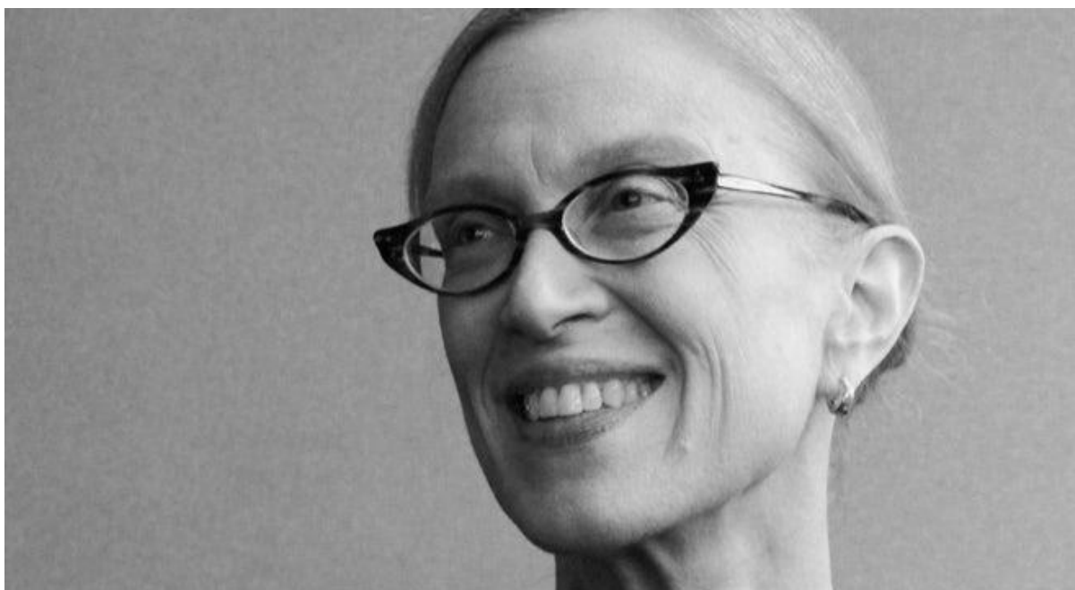
Slika 6: Valerie Steele, 2003. (izvor: posjećeno 20.05.2021. )

Kao što je već navedeno na početku ulomka, <<prvi primjeri izlaganja i kolekcioniranja odjevnih predmeta javljaju se prije drugog svjetskog rata. Tada je bila riječ o artefaktima i tekstilnim predmetima iz 17. i 18. st. i bili su dio nečije privatne zbirke.>> 8