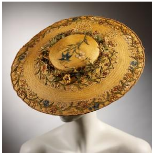
Slika 18: Šeširi Stephena Jonesa

"Od modne piste do pločnika" , održana u muzeju likovnih umjetnosti u Montrealu. Revija je tada obilježila 35 godina kreativnog rada i doprinosa modi. Trideset i pet god nedovoljan je broj godina kako bi se kroz nečiji rad gledalo kroz prizmu povijesno utjecajnog no u svijetu mode koja je podložna čestim i naglim promjenama, trideset i pet godina može biti dovoljno za prikaz razvoja i propasti čitave jedne ere. Čak i više njih. Upravo je iz niza od nekoliko desetljeća aktivnog rada nekog dizajnera moguće kreirati dokumentarnu izložbu ako je taj isti dizajner utjecao na tijek povijesti mode i odijevanja. Nekada ne treba ni biti riječ o jednom dizajneru već o prolaznom trendu ili komadu odjeće koji se kroz određeno razdoblje provlačio u različitim oblicima. Primjeri takvih dokumentarnih tematskih izložbi bi bili The Corset: Fashioning the body (2000. god- FIT Museum) i Extreme Beauty (MET Museum) 2001. godine. U ovim se izložbama analizirao odnos tijela i odjevnih predmeta, a u ovom kontekstu valja spomenuti i izložbu 'Spectres: When fashion turns back' kustosice Judith Clark (Muzeju Victorije i Alberta).