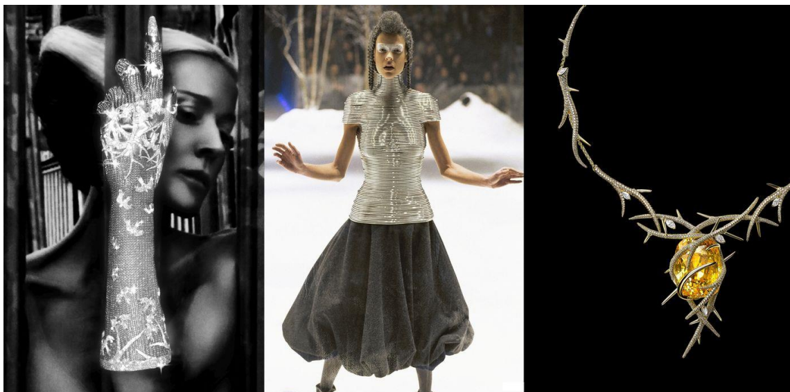
Slika 14: Suradnja Daphne Guinness i Shaun Leanea