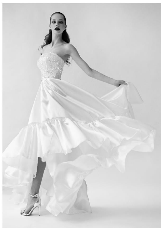
Slika 29: eNVy room bridal kolekcija proljeće/ljeto 2018. (izvor: posjećeno 20.04.2021. )