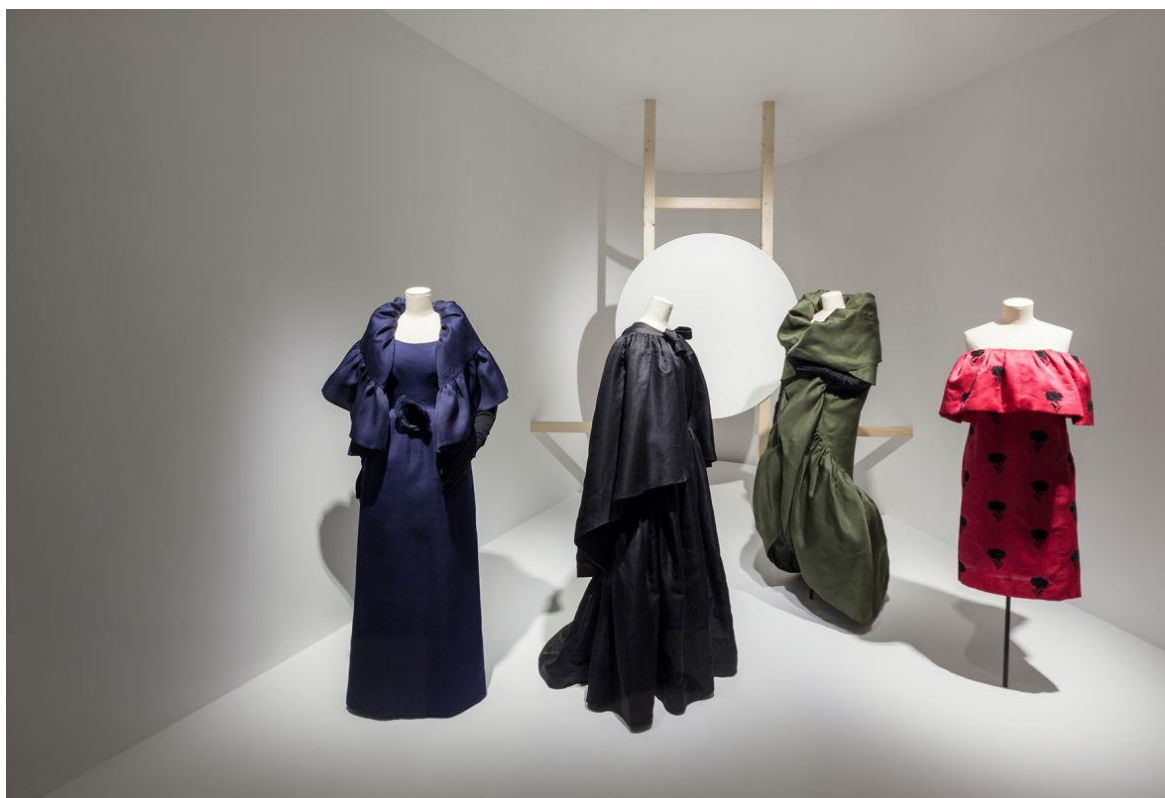
Slika 11: Kreacije Cristóbal Balenciaga

Naziv izložbe: "Alaïa and Balenciaga. Sculptors of shape"