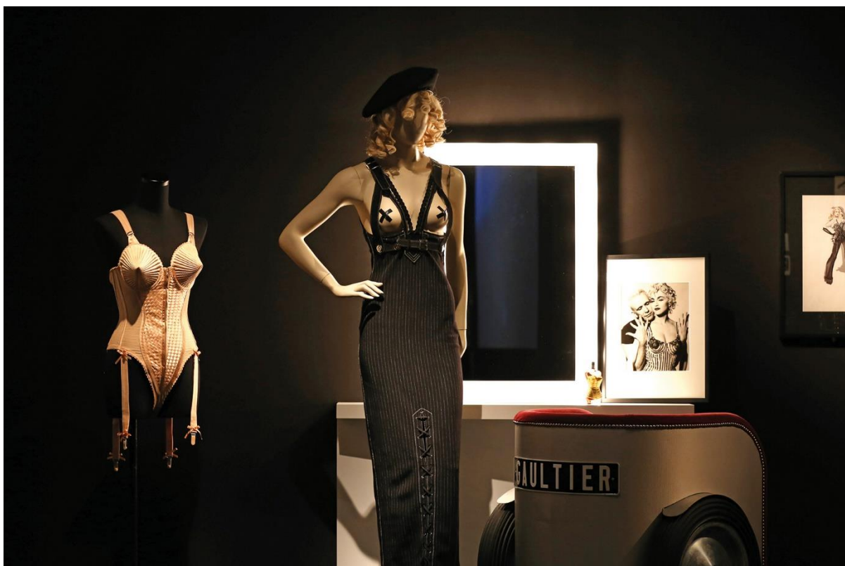
Slika 7: Kreacije Jean Paul Gaultiera

Naziv izložbe: From the Sidewalk to the Catwalk