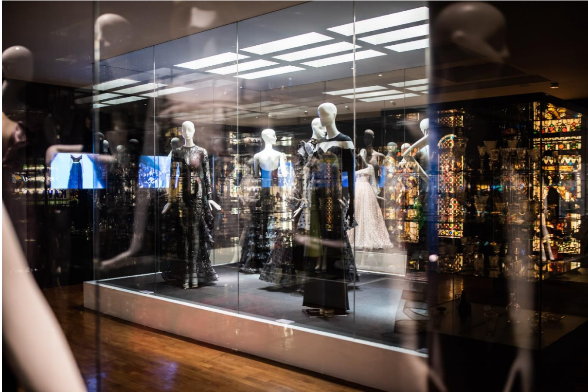
Slika 32: Izložba haljina eNVy room-a

odjevnih predmeta, pretežito haljina, posjetiteljima su pružili bogat uvid u dizajnerski opus jedinstvenog i prepoznatljivog kreatorskog rukopisa koji je godinama rastao i razvijao se pod imenom branda eNVy room. U sklopu prolazne postave muzeja, posjetioци su mogli vidjeti same početke stvaralaštva od prve prikazane revije iz 2004. god do danas.