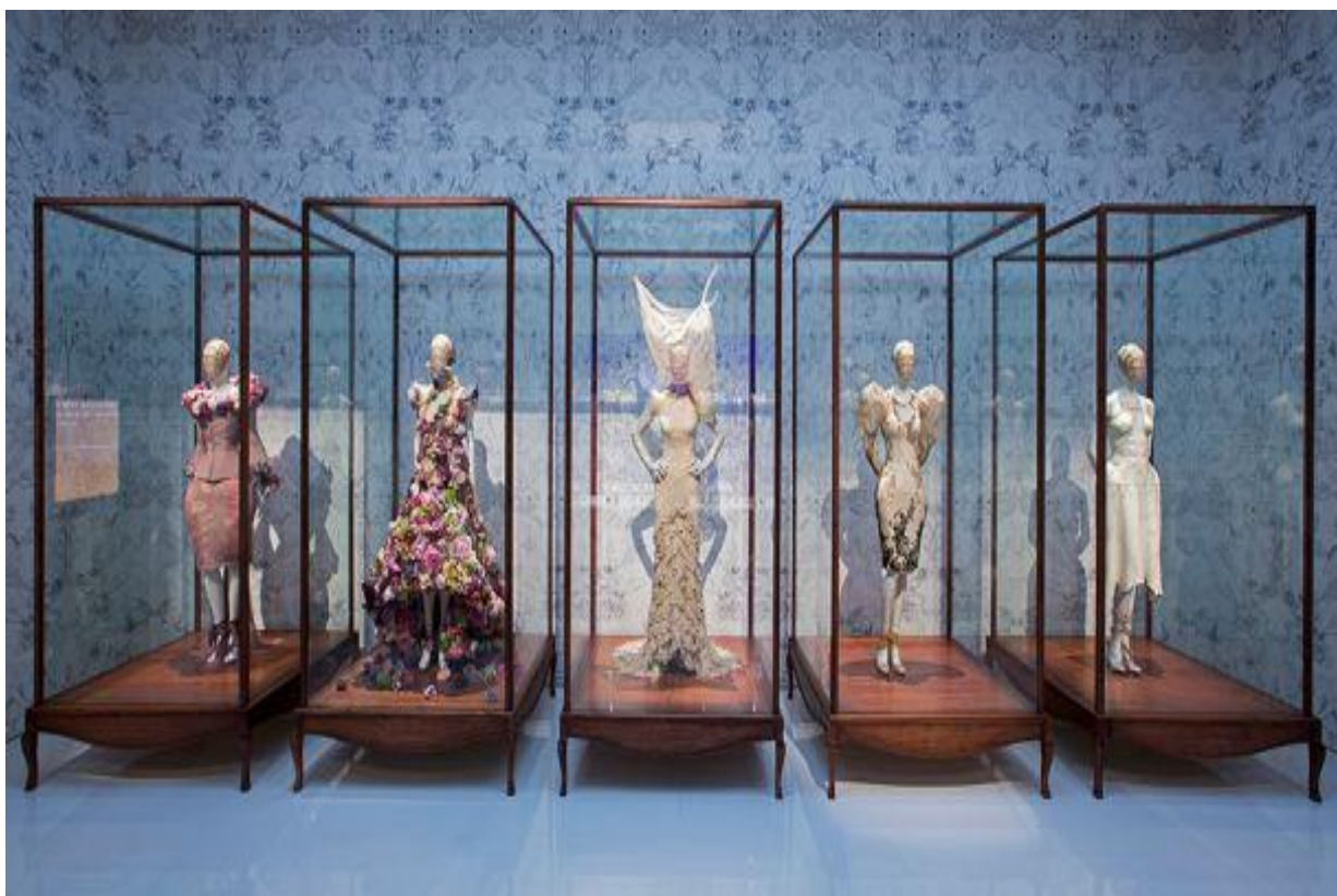
Slika 21: Izložba Alexander McQueena