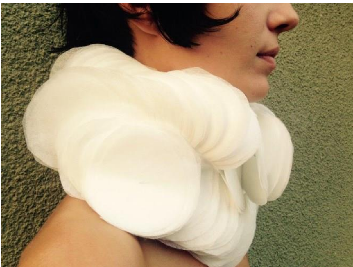
Slika 28: Rad Hlupić-Krpan

Naziv izložbe: 'Materijal i forma - tekstil na novim granicama'