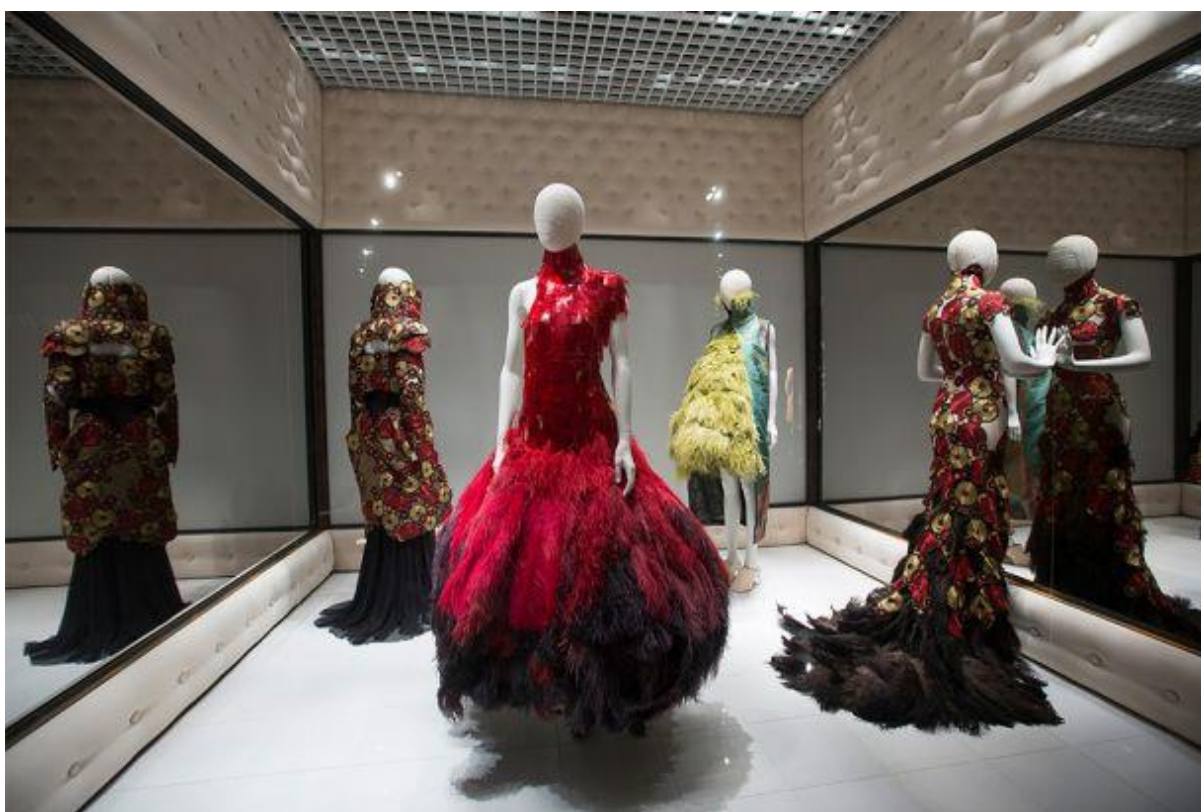
Slika 23: Izložba Alexander McQueena

Unatoč lošim kritikama relevantnih autoriteta iz svijeta mode, upravo je izložba ‘Savage beauty’ proglašena najposjećenijom modnom izložbom u Londonu. Posjetilo ju je gotovo pola milijuna ljudi, a čitav projekt je koštao tri milijuna funti.