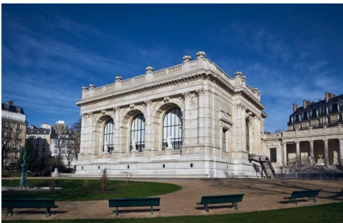
Slika 3: Musée des Arts de la Mode et du Textile u Parizu, 2017. (izvor: posjećeno 20.05.2021. )