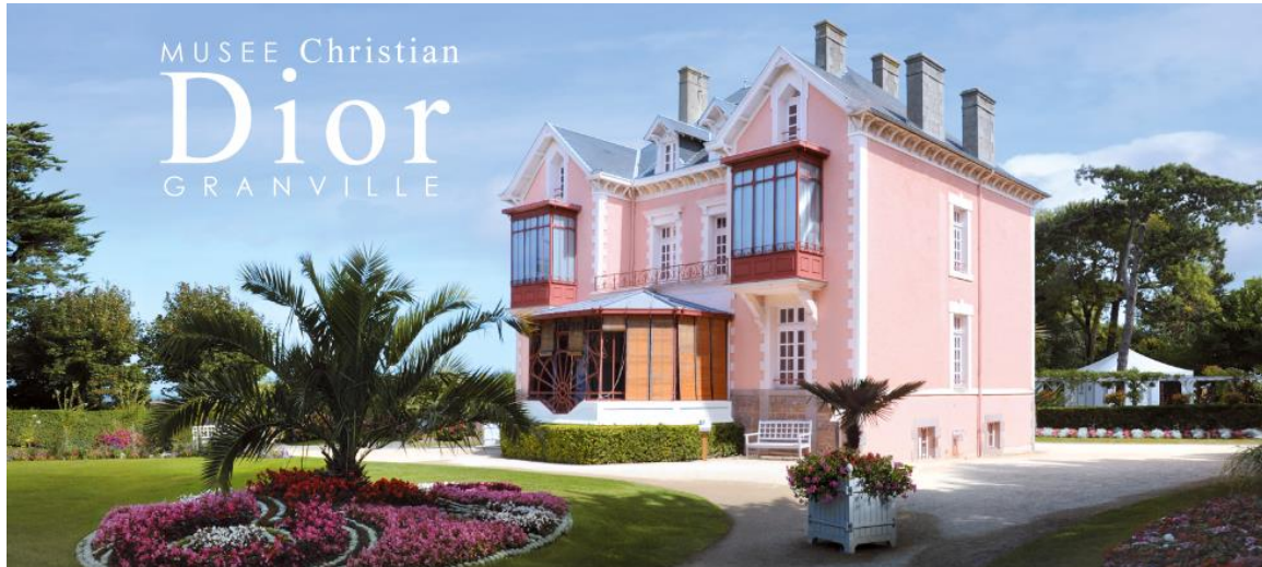
Slika 8: Kuća mode Christiana Diora, 2015. (izvor: posjećeno 20.11.2020. )

couture modnih dodataka te više od 50 tisuća crteža i raznih predmeta koji svjedoče o 40 godina kreativnog rada Yves Saint Laurenta>>. 27