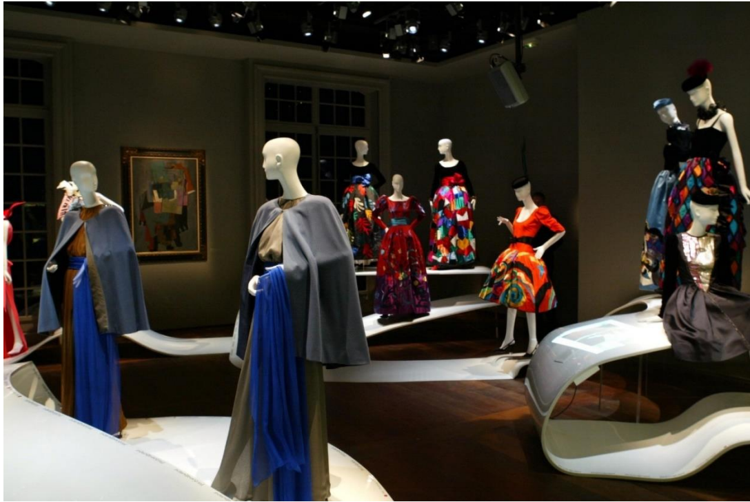
Slika 9: izložba u muzeju Yves Saint Laurenta

Naziv izložbe: Yves Saint Laurent Dialogue avec l'art