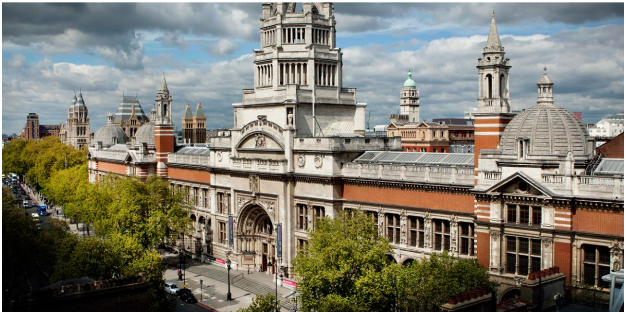
Slika 1: Victoria&Albert Museum u Londonu, 2015. (izvor: posjećeno 20.05.2021. )