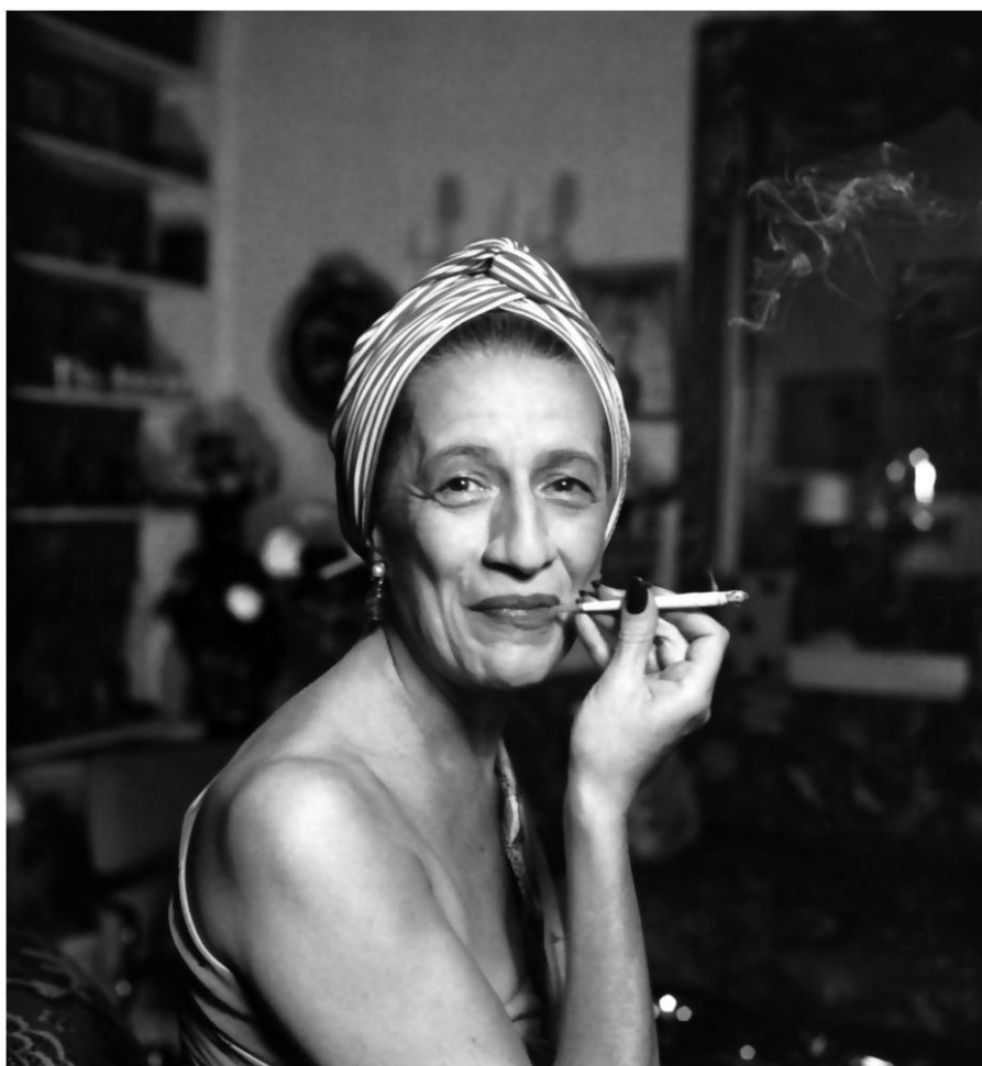
Slika 5:Diana Vreeland, 1953. (izvor: posjećeno 20.05.2021. )

Kroz projekte Valerie Steel kreiraju se nove prakse kuriranja modnih izložbi i na koncu dvadesetog stoljeća sve se više populariziraju izložbe slavnih modnih dizajnera, a takve modne izložbe postaju itekako uspješna marketinška taktika u privlačenju mnogobrojne publike te pažnje medija. Također, Steel je kao kustosica i autorica mnogih tekstova u svojim radovima iznosila problematiku kritičkog pogleda na postavljanje modnih izložbi unutar muzejske institucije.