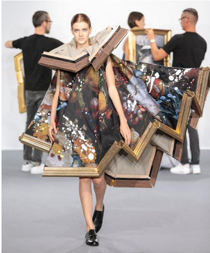
Slika 15: Modna revija : Victor & Rolf A/W15 haute couture collection featuring wearable art dresses, 2015. God (Izvor: posjećeno 10.03.2021. )

Još jedna komercijalna izložba u istom se periodu održavala u Parizu, a bila je posvećena konceptualnom dizajneru Husseinu Chalayanu u muzeju ‘Musée des Arts Décoratifs’. Nedugo zatim je Valentino publici predstavio fascinantant projekt kojim je predstavljeno istraživanje povijesti visoke mode (2011.).