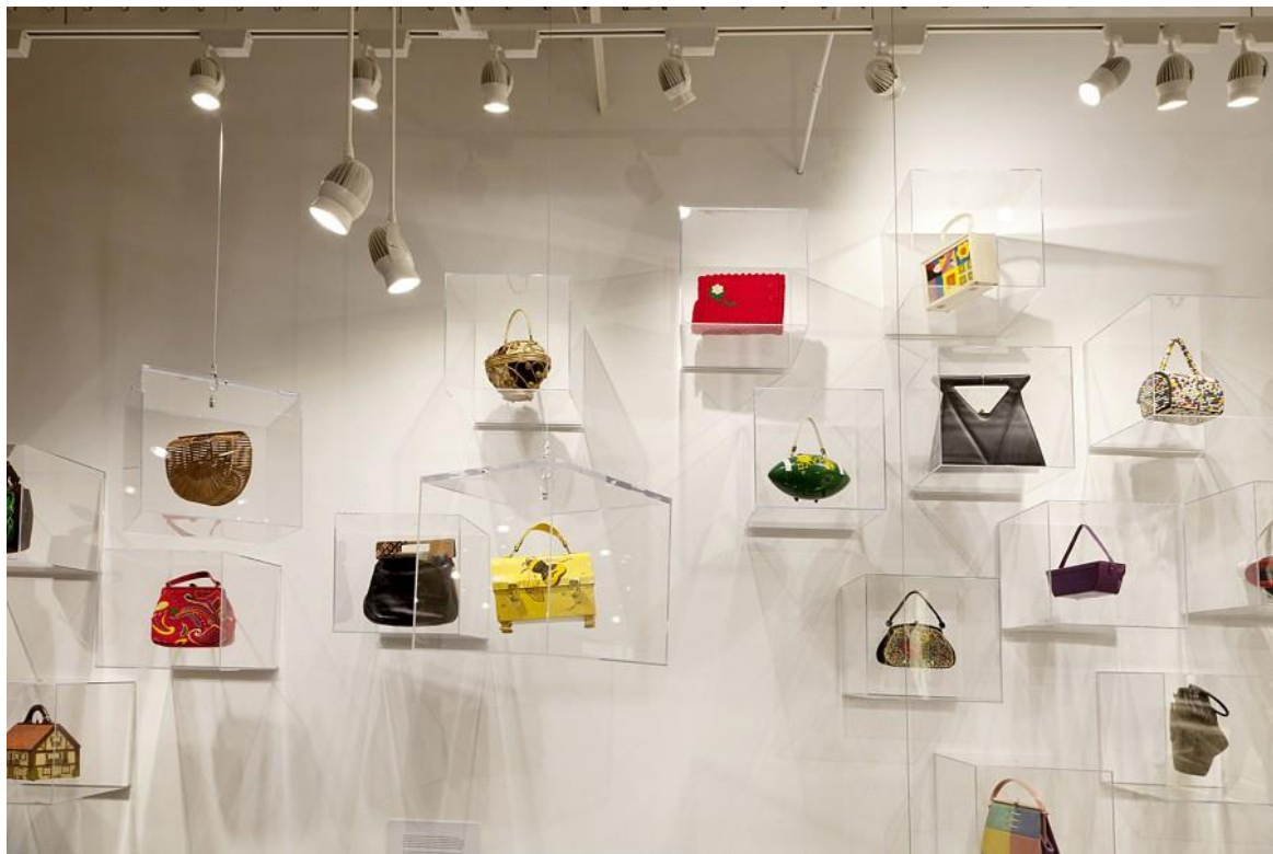
Slika 12: Primjerci iz 'Muzeja torbica'

dodatak) možda može biti izložen s ciljem da je njegova estetska vrijednost i položaj u prostoru muzeja bude njegova jedina funkcija, no može li se zanemariti njegova kupovno-prodajna vrijednost? To nas zapravo dovodi do pitanja može li suvremena moda (čak i kada u sebi ima povijesne elemente) biti dio muzeja bez da iz svoje postavljenosti u muzeju, "izvuče" i financijsku korist te priliku za reklamom i promocijom.