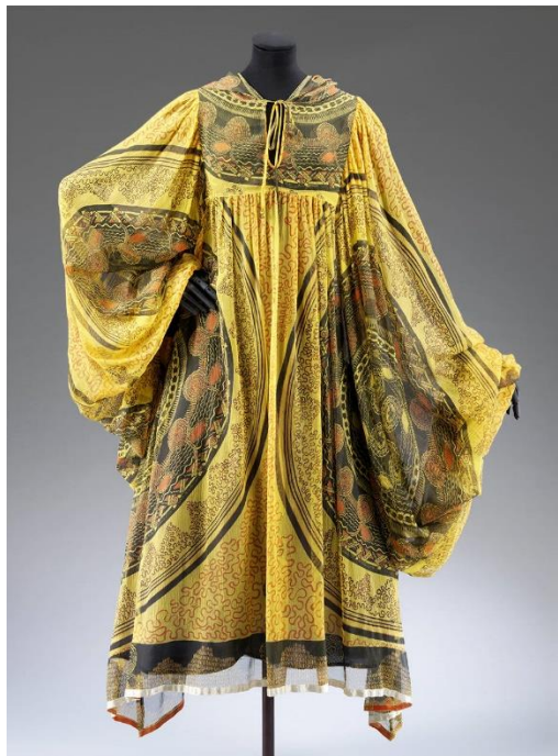
Slika 11. Haljina Zandre Rhodes iz 1969. godine s krugovima