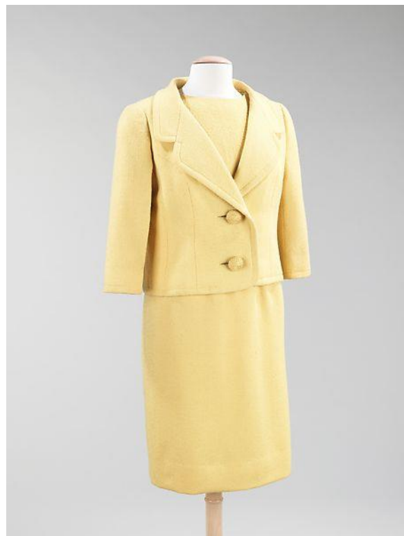
Slika 1. Givenchy sako i suknja iz 1960. godine