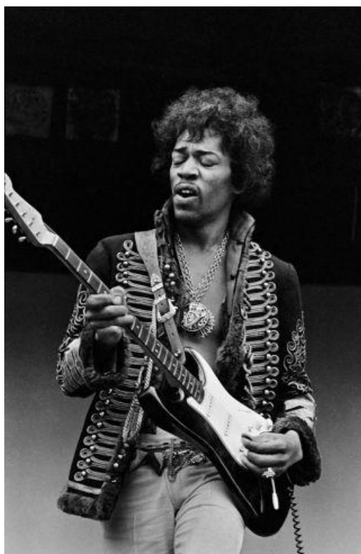
Slika 19. Jimi Hendrix u militarističkoj jakni iz 1967. godine