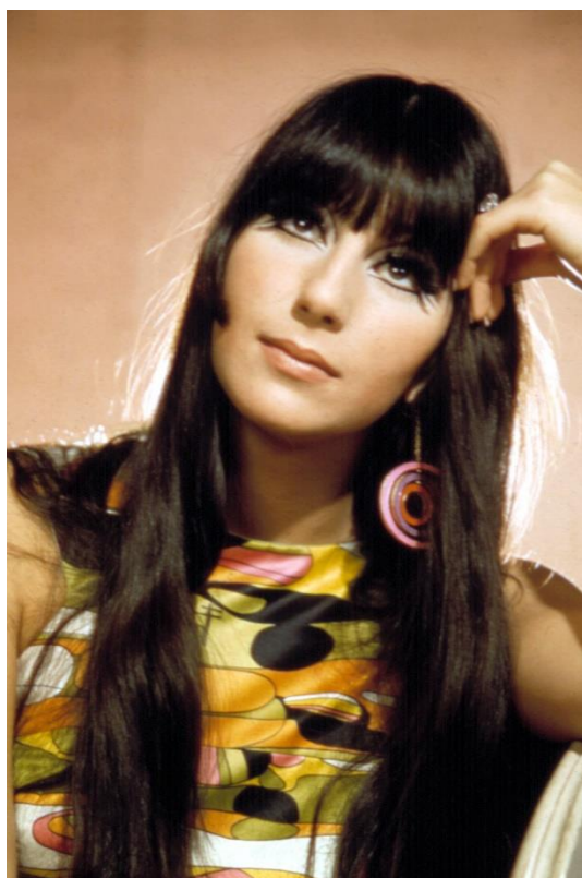
Slika 25. Pjevačica Cher u hipi odjeći geometrijskih uzoraka