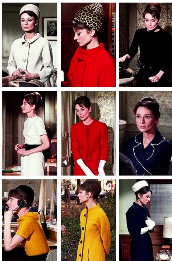
Slika 22. Stil Audrey Hepburn u filmu Charade iz 1963. godine