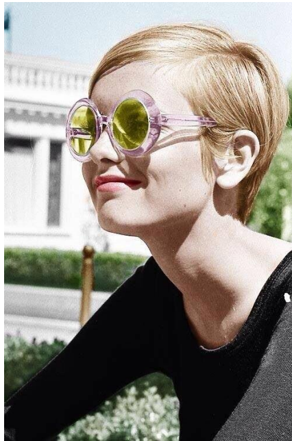
Slika 12. Twiggy nosi geometrijske sunčane naočale