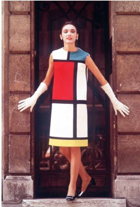
Slika 6. YSL „Mondrian Dress“ iz 1965. godine