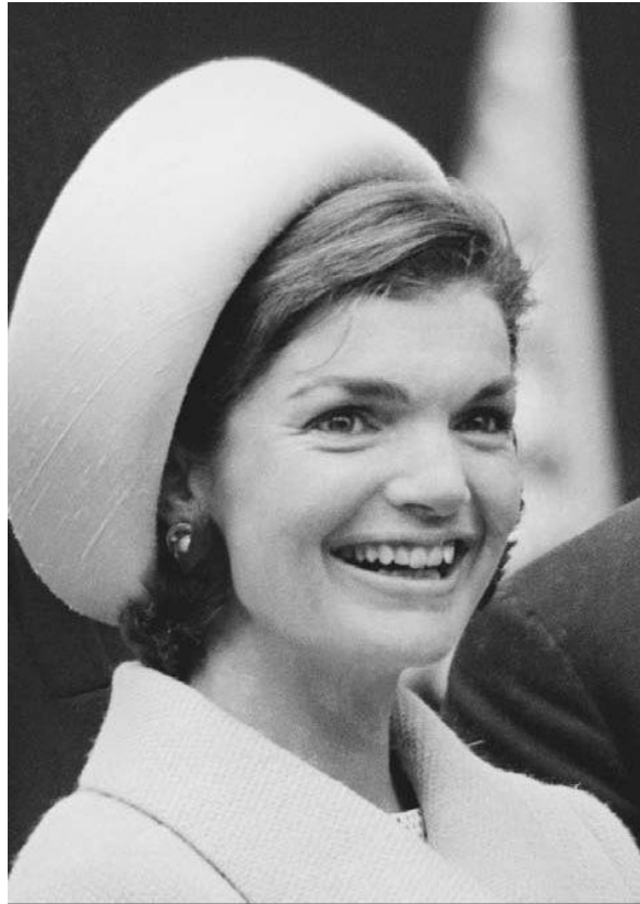
Slika 16. Jackie Kennedy sa okruglim pillbox šeširom