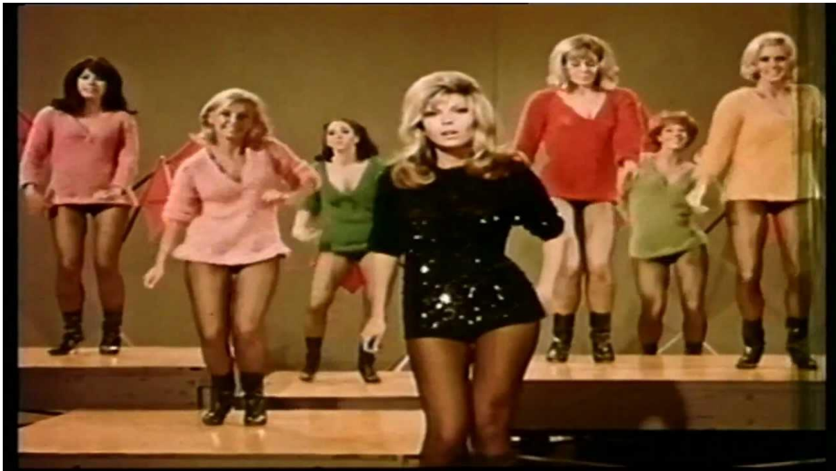
Slika 24. Nancy Sinatra 1966. godine u spotu za pjesmu „These boots are made for walking“