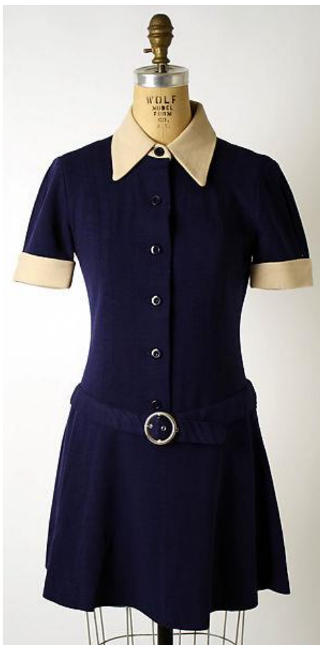
Slika 3. Mini haljina Mary Quant iz kolekcije 1968. godine