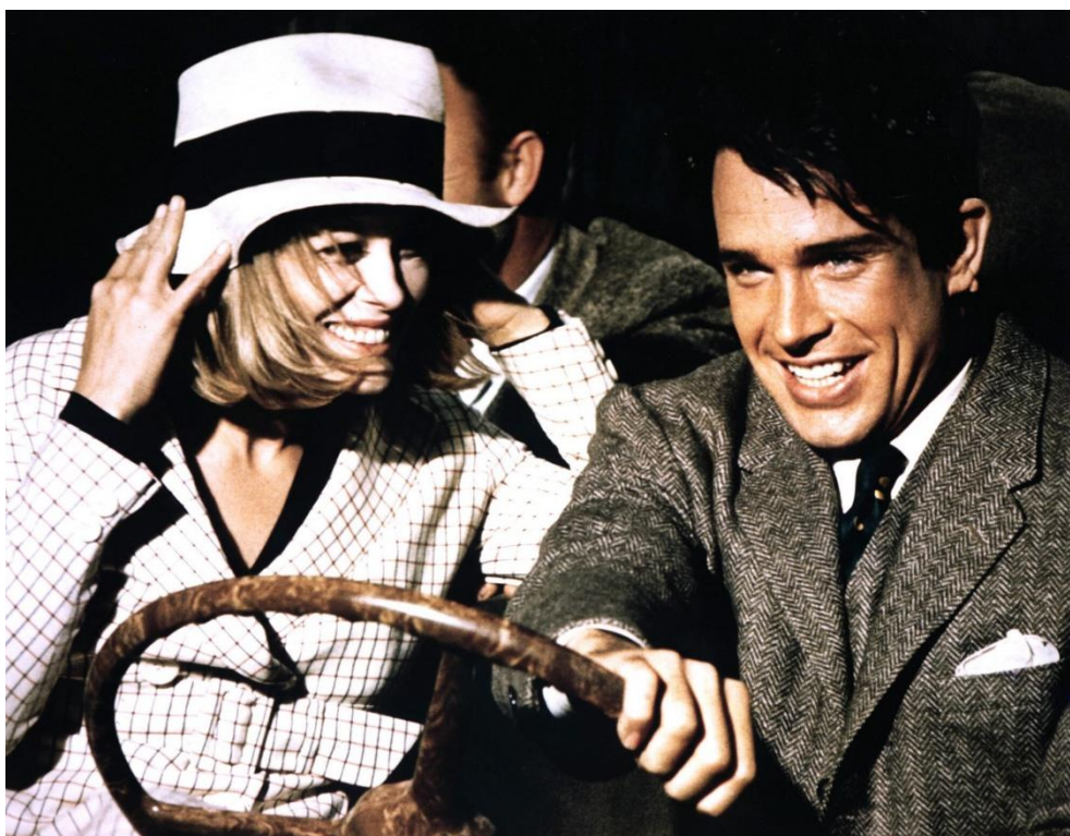
Slika 20. Isječak iz filma Bonnie i Clyde iz 1967. godine